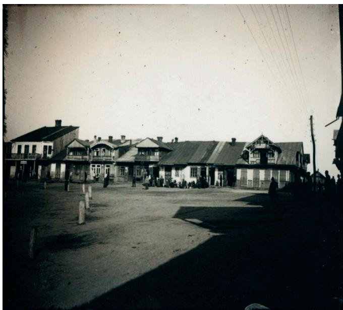
Rys. 1. Rynek w Tyszowcach, 1917 rok, autor nieznan. Zdjęcie ze zbiorów Roberta Horbaczewskiego. Cyfrowa kopia zdjęcia z Archiwum Fotografii Ośrodka „Brama Grodzka – Teatr NN” ( www.biblioteka.teatrnn.pl )

Każdy zachowany drewniany obiekt jest świadectwem tradycyjnego budownictwa drewnianego, ale również źródłem wiedzy dotyczącej zwyczajów, kultury i historii regionów oraz narodów. Obraz wsi i małych miasteczek – czyli miejsc gdzie architektura drewniana była najbardziej widoczna, na skutek wojny uległ radykalnej zmianie. Zginęła żyjąca w nich i nadająca im charakterystyczny klimat społeczność żydowska, w dużym stopniu zniszczeniu i dewastacji uległa typowa drewniana zabudowa. To co pozostało z drewnianego budownictwa stało się synonimem biedy i zacofania, prowadząc do kolejnej fali zniszczeń – zastępowania go budownictwem murowanym. Towarzyszył temu kompletny brak szacunku i świadomości znaczenia drewnianej architektury. Na wiele lat tradycja budowania z drewna praktycznie zanikła. Powstało przekonanie, że architektura drewniana jest anachroniczna.