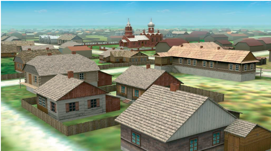
Rys. 3. Makieta Dubienki, okres międzywojenny.

Projekt „Drewniany Skarb. Chroniąc dziedzictwo, kreujemy przyszłość” miał na celu popularyzację i promocję dziedzictwa kulturowego, jednak na poszczególnych etapach realizacji przedsięwzięcia były też realizowane badania. Dzięki współpracy ze specjalistami różnych dziedzin udało się zebrać materiał dokumentujący pierwotny wygląd Krasnobrodu, Wojsławic, Szczeszczyna, Dubienki oraz Tyszowiec i skonfrontować go z obecnym stanem zachowania miasteczek. Postępujący zanik oryginalnej substancji architektonicznej, bardzo wyraźnie rysujący się w wyniku tej konfrontacji, jest problemem ciągle nieobecnym w świadomości mieszkańców małych miejscowości, toteż oprócz wskazania na drewnianą architekturę jako na ważny element kształtujący tożsamość kulturową regionu i podjęcia próby zmiany sposobu myślenia o architekturze tradycyjnej wśród jej użytkowników, jednym z celów projektu jest wizualizacja skali problemu. Użycie nowoczesnych technologii w edukacji o drewnianym dziedzictwie, która w ramach projektu realizowana była także poprzez warsztaty edukacyjne, wystawę oraz publikacje daje możliwość nawiązania dialogu z kolejnym pokoleniem użytkowników architektury drewnianej. W tej perspektywie wydaje się, że tworzenie tego typu wirtualnych makiet może być już traktowane jako forma ochrony zabytków.