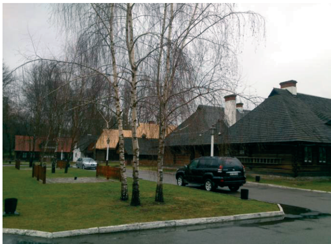
II. 3. Obecny stan „Pastewnika” – jedyna zrealizowana pierzeja „rynku”, fot. Marta A. Urbańska