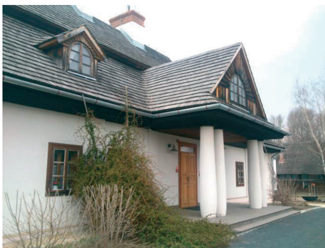
II. 5. Dworek z Krzeczowic, 2015, fot. Marta A. Urbańska