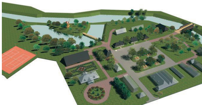
II. 4. Koncepcja rozwoju i rewitalizacji skansenu „Pastewnik”, 2008, wizualizacja całości założenia. Rys. zespół studentów praktyk IHAIKZ PK pod kierunkiem autorki artykułu