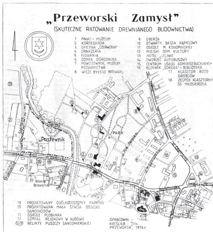
II. 2. Wstępny plan lokalizacji „Pastewnika”, rys. Stanisław Żuk, 1976