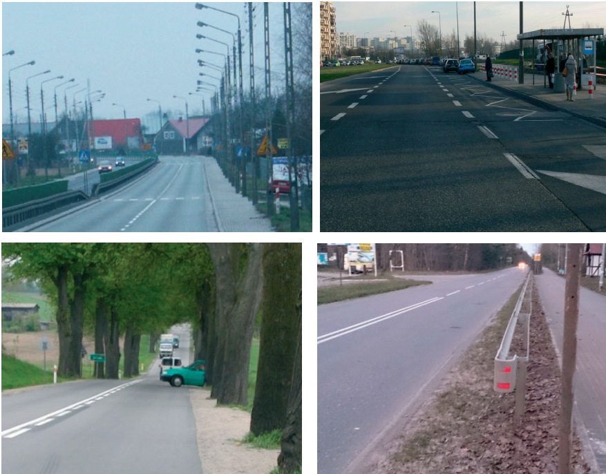
Rys. 1 Przykłady zagrożeń na sieci istniejących dróg

Konieczne jest zbudowanie szczegółowych modeli opisujących zależności miar bezpieczeństwa od wpływu wybranych elementów drogi i jej otoczenia, będących potencjalnym źródłem zagrożenia uczestników ruchu drogowego. Przykład takiej zależności – wpływ występowania drzew w pasie drogowym na gęstość wypadków GW na odcinkach dróg jednojezdniowych, przedstawiono na rys. 3 (przy założeniu średnich wartości dla pozostałych czynników wpływu na GW).