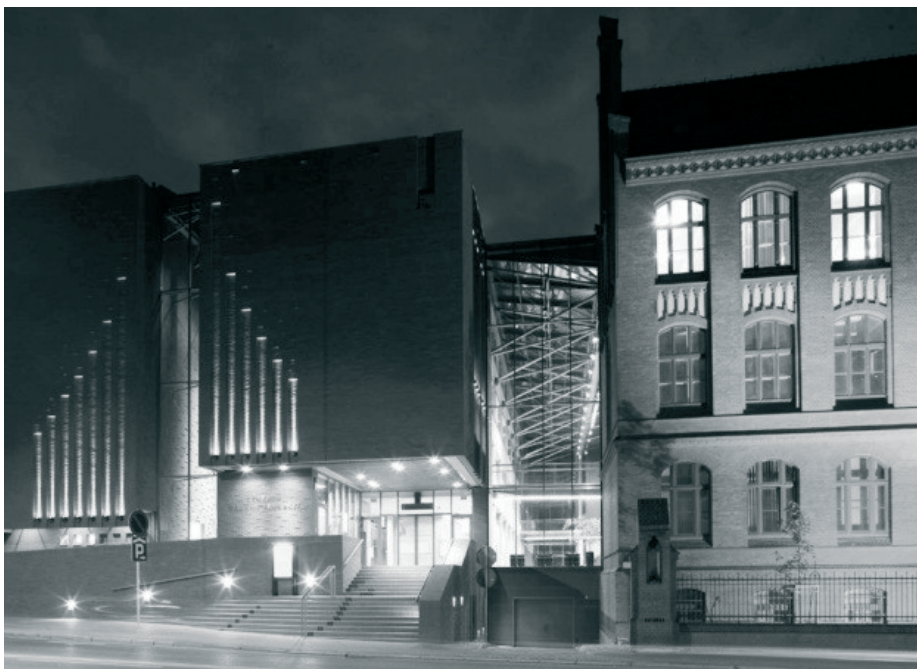
Rys. 5. Konior Studio, Centrum Nauki i Edukacji Muzycznej Symfonia w Katowicach [5]. Fig. 5. Konior Studio, Center of Science and Music Education, Katowice [5].