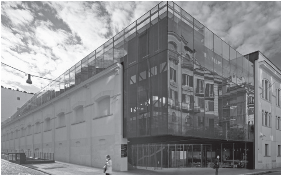
Rys. 6. Odile Decq, Muzeum Sztuki Nowoczesnej w Rzymie (MACRO) [6].

Architektura, podobnie jak inne dziedziny sztuki, była (i jest) narzędziem społecznego dialogu. Wyraża racje architekta i przedkłada je użytkownikowi, stanowiąc miejsce wzajemnych interakcji. Płaszczyzna dialogu rozciąga się jednak dużo dalej niż tylko do linii twórcy – odbiorcy; obejmuje także wszelkie zależności pomiędzy budynkiem a otoczeniem stawiając wszystkich zainteresowanych w określonym kontekście. Owa „kontekstualność” stanowi jednocześnie narzędzie kreacji i oceny słuszności oraz zasadności powstającej architektury, pozwalając obiektywnie oceniać jej kondycję w XXI wieku, Złotym Wieku Różnorodności.