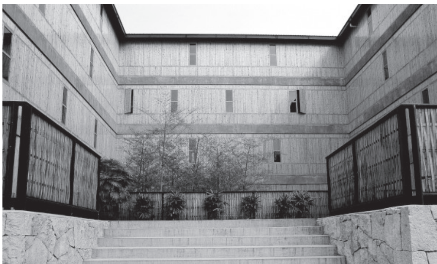
Rys. 1. Wang Shu, Kampus Szkoły Xiangshan, Chińskiej Akademii Sztuki w Hangzhou [1].

Nie tylko w Chinach kontekst miejsca, przestrzeni, uwarunkowań historycznych ma znaczenie. Brytyjski architekt Tony Fretton także jest zwolennikiem architektury kontekstualnej, bo jak mówi: „ Jestem zainteresowany zrównoważeniem projektu, tak, aby wydawał się właściwy w danym miejscu. ” 1 Jego słowa znajdują poparcie w jego projektach, albo raczej stanowią ich świadome odzwierciedlenie. Fretton znany jest przede wszystkim z realizacji obiektów związanych ze światem sztuki – muzeów, galerii, atelier artystów jak np. domu Anish Kapoora w Londynie (Rys 2.).