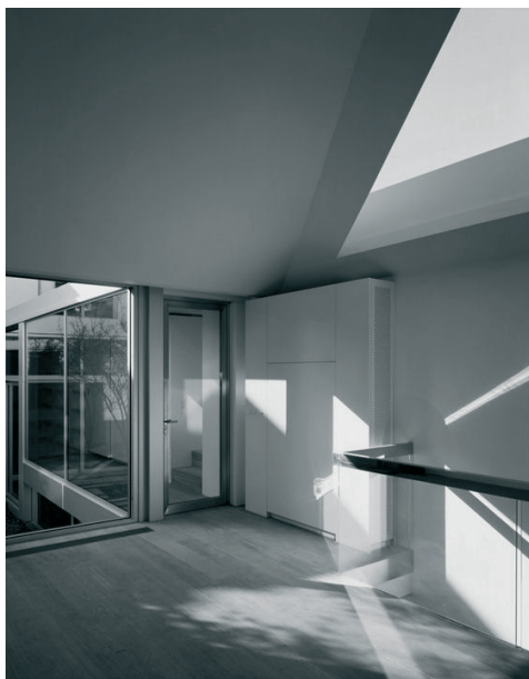
Rys. 2. Tony Fretton, Dom Anish Kapoora w Londynie [2].