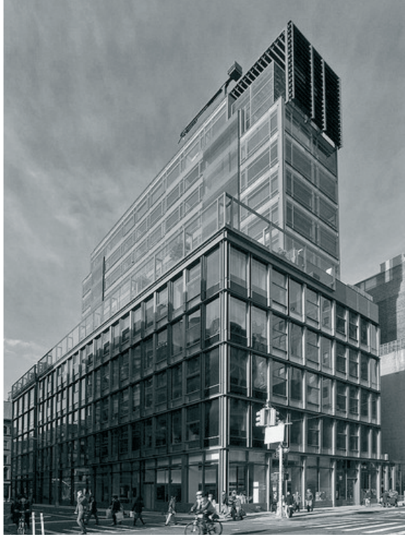
Rys. 3. Jean Nouvel, 40 Mercer Street w Soho w Nowym Jorku [3].

Fig. 3. Jean Nouvel, 40 Mercer Street Soho, New York [3].