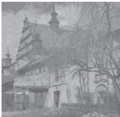
Ryc. 19. Podwórze kościoła poddominikańskiego – 1930 r.

Fig. 18. Former Franciscans monastery and church – 1929.