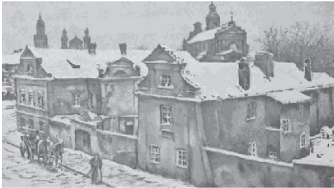
Ryc. 16. Muzeum Lubelskie (obecnie biblioteka) – 1923 r. Fig. 16. Lublin Museum (at present: library) – 1923.