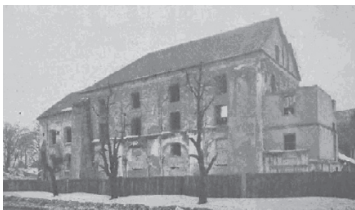
Ryc. 18. Były klasztor i kościół o. Franciszkanów – 1929 r.

Fig. 18. Former Franciscans monastery and church – 1929.