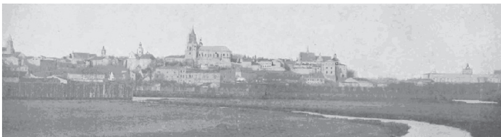
Ryc. 11. Widok Lublina – 1908 r. Fig. 11. View of Lublin – 1908.