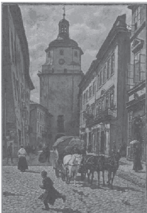
Ryc. 5. Brama Krakowska i Grodzka – 1887 r. Fig. 5. Krakow and Grodzka Gate – 1887.