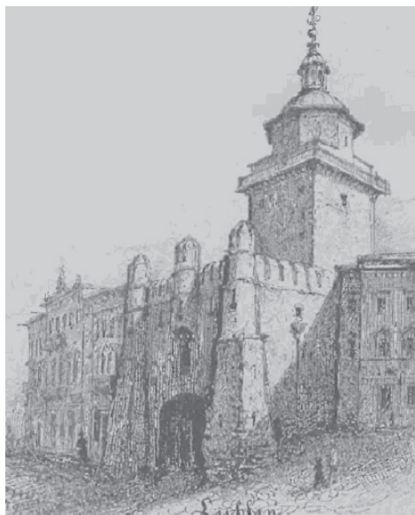
Ryc. 7. Brama Krakowska – 1894 r.