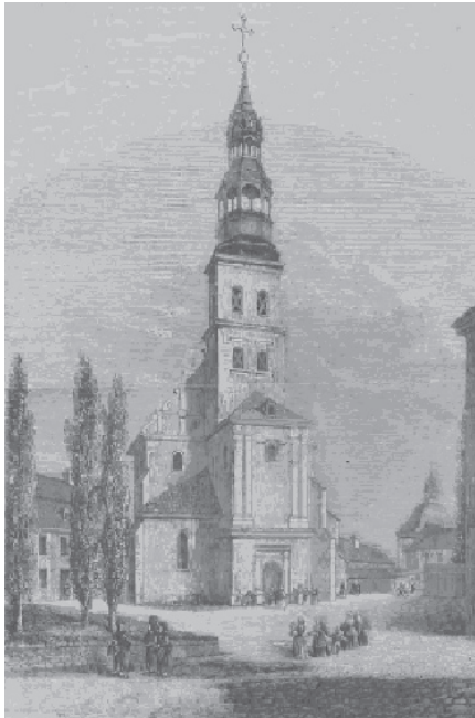
Ryc. 1. Fara św. Michała 1859 r. Fig. 1. Saint Michała's parish church – 1859.