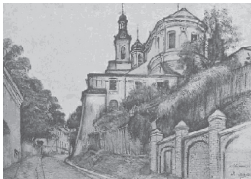
Ryc. 10. Katedra – 1914 r. Fig. 10. Cathedral – 1914.