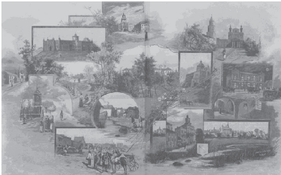
Ryc. 6. Lublin – 1891 r.