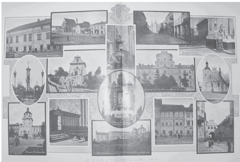
Ryc. 12. Zabytki Lublina – 1912 r. Fig. 12. Monuments of Lublin – 1912.