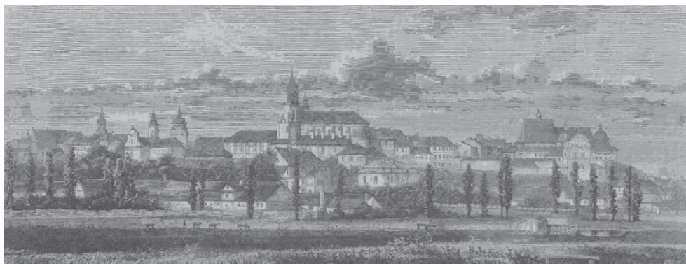
Ryc. 21. Widok Lublina – 1871 r.