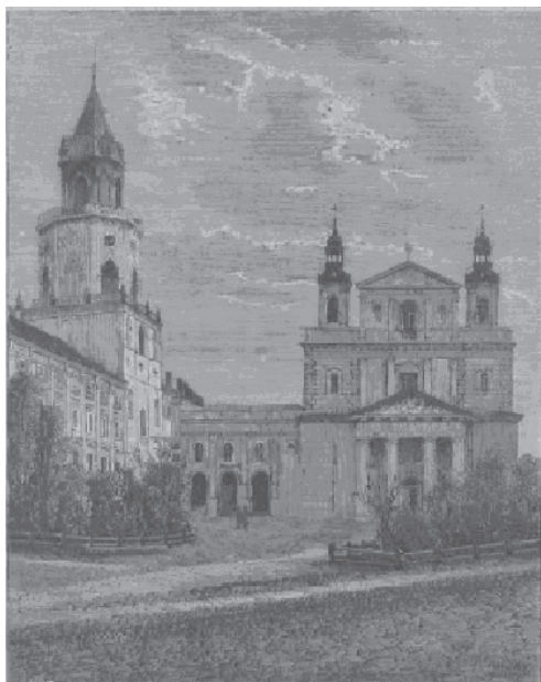
Ryc. 3. Katedra, wieża Trynitarska – 1872 r. Fig. 3. Cathedral, Trynitarian tower – 1872.