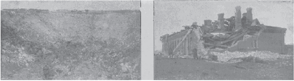
Ryc. 13. Lej po wybuchu oraz zniszczona kamienica – 1919 r. Fig. 13. Crater after explosion and destroyed tenement – 1919.