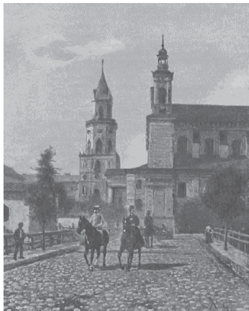
Ryc. 4. Katedra – widok od str. Ul. Zamoyskiej – 1890 r. Fig. 4. Cathedral – view from Zamojska str. – 1890.