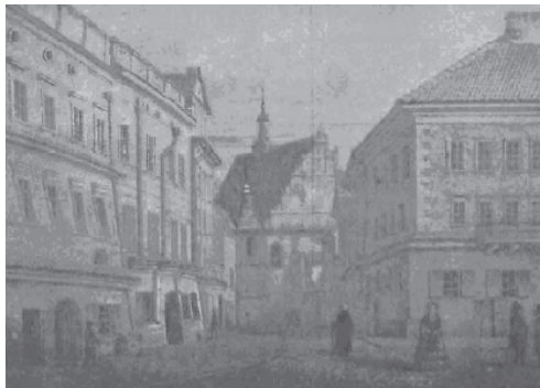
Ryc. 9. Ul. Złota – 1899 r. Fig. 9. Gold str. – 1899.