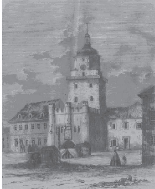
Ryc. 2. Brama Krakowska – 1864 r. Fig. 2. Krakow Gate – 1864.