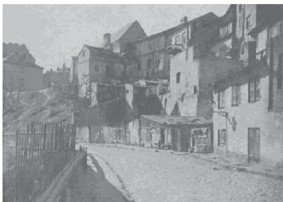
Ryc. 20. Podzamcze – 1933 r.

Fig. 19. Courtyard of after-dominican church – 1930.