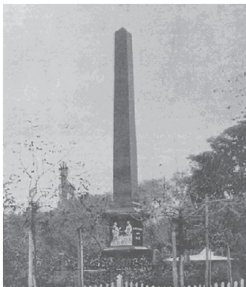
Ryc. 8. Pomnik Unii – 1906 r.