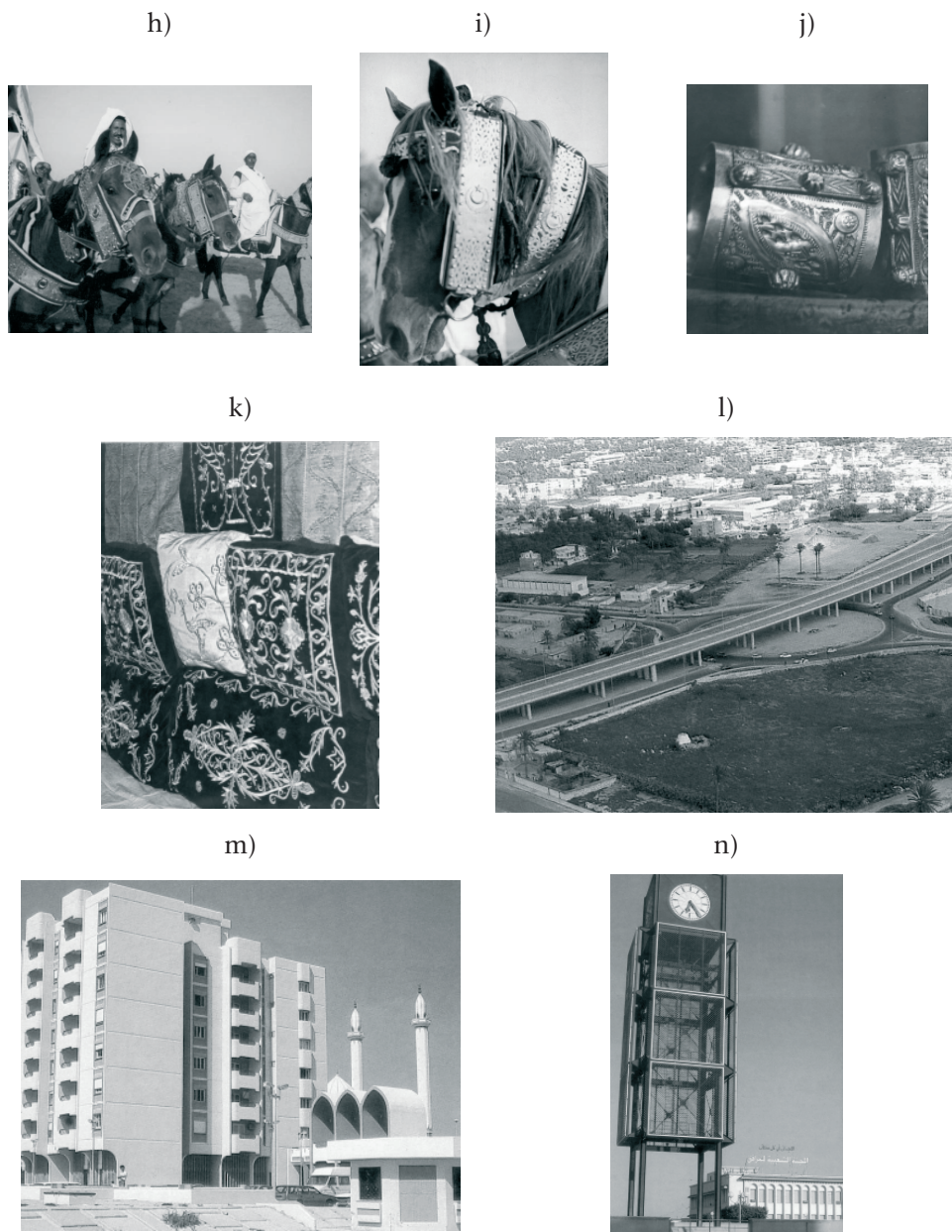
Phot. 1. a) Villa Selena II-gi w. n.e.(kolonia rzymska), b) Leptis Magna stolica kolonii rzymskiej (bazylika wczesnochrześcijańska), c) Sabratha – teatr rzymski, d) ulice starego miasta e) f) meczety na starym mieście, g) geometryczna ornamentyka zdobiąca minaret, h) mieszkańcy regionu na odświętnie udekorowanych koniach, i) uprząże dekoracyjne konia, j) ozdoby kobiece ze srebra, k) ozdobne hafty regionalne, l) Współczesny węzeł komunikacyjny podwiązanie komunikacyjne miasta Misuraty, m) Architektura nowej zabudowy miasta, n) wieża zegarowa – symbol współczesnego miasta.