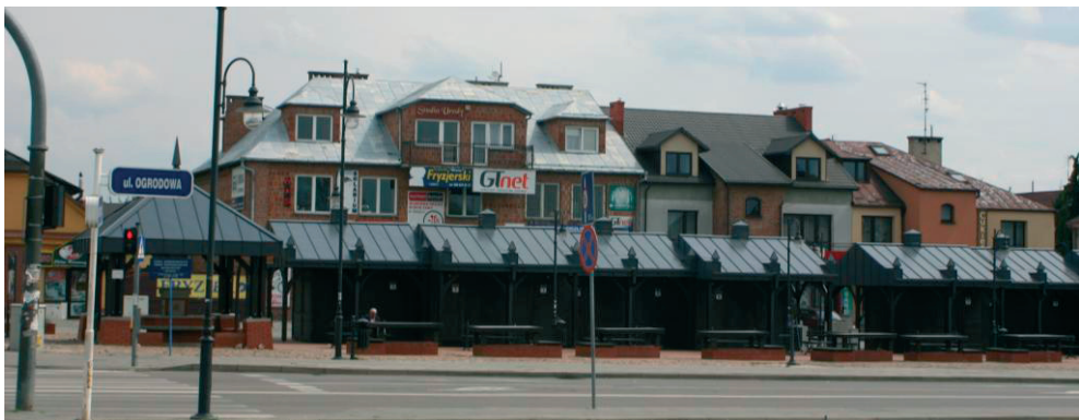
Rys. 7,8. Kramy na Rynku „Nowego Miasta”, fot. J. Wrana 2014