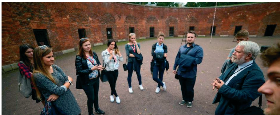
Rys. 10. Uczestnicy i prowadzący podczas wizji lokalnej na terenie Rotundy, 23 IX 2015 r.