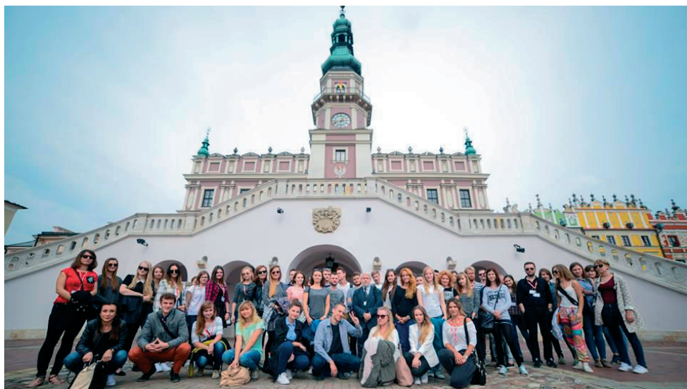
Rys. 9. Uczestnicy Warsztatów „Synergia w Architekturze Lublin-Zamość 2015” pod zamojskim ratuszem, 23.IX. 2015 r.

Problemem jest niematerialne (duchowe) dziedzictwo związane z wielokulturowością. To pamięć o zgładzonych Żydach, o Akcji Zamość (akcji wysiedleńczej społeczności polskiej, w celu przygotowania miejsca dla osadników niemieckich) i ludzkich dramatach związanych z Rotundą – miejscem kaźni. Konieczne jest upamiętnienie tych faktów, jednocześnie pamiętając o potrzebach integracji mieszkańców Zamościa.