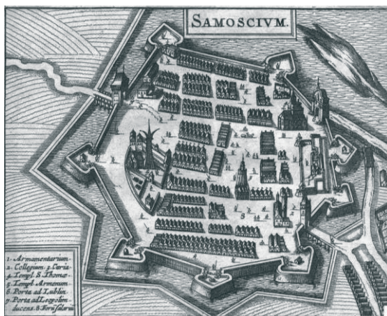
Rys. 1. Archiwalny plan Zamościa.

Zamość, spełnione marzenie hetmana Jana Zamoyskiego (1542-1605) i zrealizowane miasto idealne 3 , położone w południowej części województwa lubelskiego, jest obecnie jedną z 16 dzielnic miasta o tej samej nazwie. Początki ośrodka sięgają roku 1579, kiedy to rozpoczęła się budowa miasta; rok później Zamość otrzymał prawa miejskie. W 1589 roku został stolicą Ordynacji Zamojskiej. Pierwotnie miasto nosiło nazwę Nowy Zamość, w celu odróżnienia od starej osady Zamość, mieszczącej się na północ od nowopowstałego ośrodka. Wkrótce jednak osada przyjęła nazwę „Stary Zamość”, a Zamościem zostało nowe miasto. Powstanie Zamościa było sprawą bezprecedensową. Zbudowanie prywatnego miasta, w dodatku na surowym korzeniu, wiązało się z ogromnym ryzykiem i jeszcze większymi kosztami. Przedsięwzięcie Zamoyskiego i Morando okazało się jednak sukcesem, a już na przełomie XVI i XVII wieku Zamość był ważnym centrum naukowym i kulturalnym.