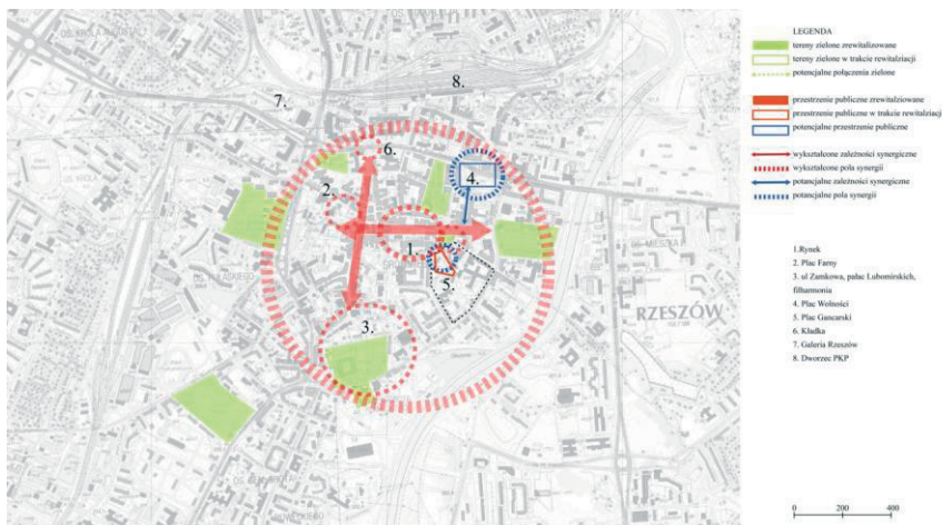
Rys. 5. Analiza wykształconych i potencjalnych zależności synergicznych Rzeszów. Opracowanie własne

Obecnie planowana jest rewitalizacja ul. 3 Maja. Zorganizowany w 2015 r konkurs na plac Gancarski jest interesującym przykładem organizacji konkursu przez SARP na zamówienie prywatnego Inwestora. Zakres projektu dotyczył w znacznej części zabudowy placu budynkiem o mieszanej funkcji wraz z przedstawieniem koncepcji uporządkowania całego kwartału.