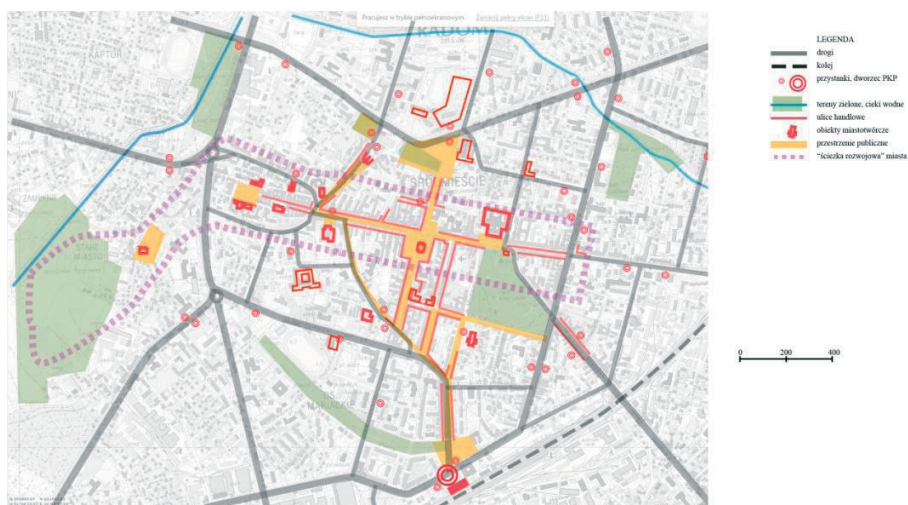
Rys. 1. Model przestrzenny struktury śródmieścia Radomia. Opracowanie własne

Powołana w 2003 roku miejska spółka z o.o. „Rewitalizacja” – jako koordynator – prowadzi dalsze prace rewitalizacyjne na terenie Miasta Kazimierzowskiego. W tym czasie zostały opracowane dwa Programy Rewitalizacji. Pierwszy dla miasta Radomia, wyznaczający dwa obszary kryzysowe: śródmiejski o pow. 1 054 ha (obręb całego śródmieścia) i Potkanów o pow. 7 ha. Drugi LPR dotyczy bezpośrednio Miasta Kazimierzowskiego. Spółka rozpoczęła działalność wg działań i zasad w nim zawartych dotyczących remontów elewacji i modernizacji kamienic, odbudowując wiele obiektów w obrębie Miasta Kazimierzowskiego np przy ul. Rwańskiej, Wąskiej, Wałowej oraz prowadzi rewaloryzację przestrzeni publicznych np. atrakcyjny przestrzennie Skwer Unii Wileńsko – Radomskiej.