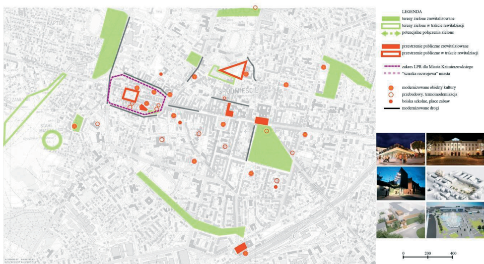
Rys. 2. Projekty rewitalizacji w obrębie MK i śródmieścia z LPR na lata 2007 - 2013. Opracowanie własne