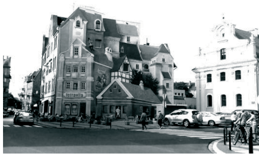
Fot. 8. Mural na ślepej ścianie kamienicy.

Od 2015 roku przestrzeń otwartych tarasów przed ICHOT jest również miejscem wydarzeń kulturalnych dzielnicy. Udział mieszkańców jest coraz większy i coraz większa ich liczba uczestniczy w cyklicznych i jednorazowych wydarzeniach. Współpraca Rady z organizacjami i fundacjami oraz grupami artystów, miała na celu zarówno integrację mieszkańców jak i upiększenie dzielnicy. Spektakularną zmianą okazało się wykonanie (2015 rok) muralu doskonale wpisującego się w przestrzeń przedkościelnego placu. Umieszczona na ślepej ścianie kamienicy wychodzącej na plac kompozycja „uzupełnia” istniejącą zabudowę. Mural "Opowieść śródecka z trębaczem na dachu i z kotem w tle", autorstwa Radosława Barka, w bajkowej konwencji przedstawia spiętrzone kamienice, budynki ze sklepami i ludzi w sytuacjach, jakie mogłyby się wydarzyć w tym miejscu.