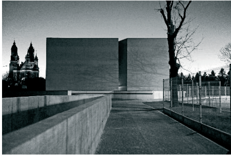
Fot. 7. Brama Poznania ICHOT, 2015.

Dzieci Niesłyszących, placówka mieszcząca się w budynkach po klasztorze Reformatów. Młodzież uczestniczy aktywnie w wydarzeniach dając przedstawienia i popisy, towarzysząc zapraszanym artystom, aktorom, muzykom.