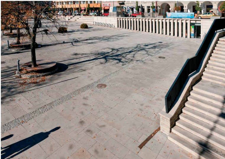
Rys. 6. Rynek w Gorlicach