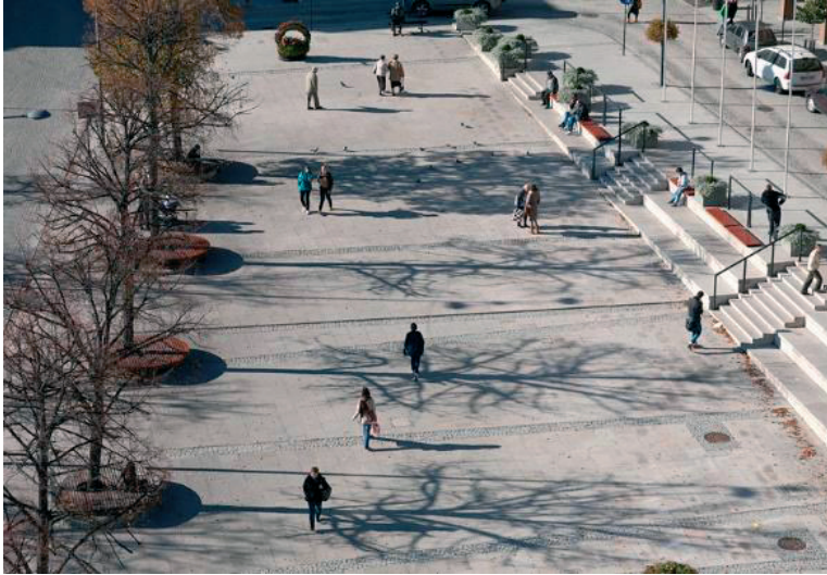
Rys. 5. Rynek w Gorlicach, źródło: strona internetowa pracowni eM4 Pracownia Architektury. Brataniec www.em4.pl

mieszkańców Gorlic. Dostęp do tej przestrzeni publicznej jest łatwy i czytelny, użytkownicy placu czują się w jego wnętrzu bezpiecznie. Sposób, w jaki jest zagospodarowany sprawia, że jest dostosowany dla użytkowników, również niepełnosprawnych. Przestrzeń ta tworzy szczególny związek emocjonalny, dający człowiekowi poczucie bycia u siebie, „swojskości” [17]. Swojskość tą można rozważać, jako tożsamość miejsca, budzącą silną identyfikację mieszkańców z tą przestrzenią. Miejsce starówki można uznać za przestrzeń dośpołeczną, skłaniającą ludzi do obcowania ze sobą, rozmowy oraz przedłużania kontaktu między sobą [18]. Jest to przestrzeń integrująca, dająca poczucie bezpieczeństwa, a przez to skłaniająca do skracania dystansów personalnych.