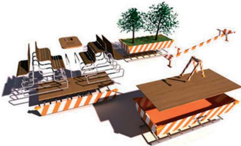
Rys. 3. Propozycje rozwiązań miejsc spotkań

Warto podkreślić, że w Hiszpanii działa również grupa Recetas Urbanas pod przewodnictwem architekta Santiago Cirgueda, którego celem jest zapewnienie poprawy warunków społecznych. Proponuje on rozwiązania dla osób dążących do zmiany swojego najbliższego otoczenia. Projekty, które można odnaleźć na stronie internetowej, w bardzo obrazowy sposób wskazują drogę od koncepcji do realizacji [12]. Architekt przedstawia gotowe, szczegółowe instrukcje w postaci opisów, filmów i fotografii. Rozwiązania cechuje mobilność, prostota, szybkość realizacji przy ograniczonym budżecie. Nowatorskim przykładem może być ustawienie huśtawki i kreacja miejsc spotkań na takich obiektach jak kontenery. Grupa wykorzystuje luki prawne w celu stworzenia lepszego środowiska życia.