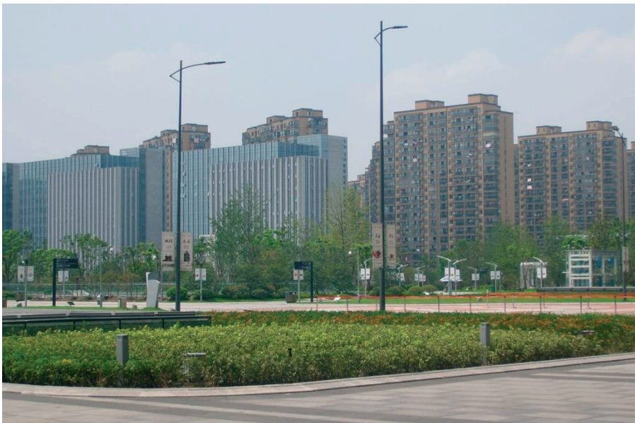
Fot. 2. Ogromne dzielnice mieszkaniowe na obrzeżach Hangzhou (prowincja Zhejiang) są typowym zjawiskiem rozlewania się miast.

Przez wiele lat gospodarki komunistycznej świadomość społeczna ochrony środowiska i usuwania odpadów była na niskim poziomie i zupełnie niekontrolowana. Do ziemi przedostawało się wiele związków i substancji trujących. Przy kolejnych inwestycjach, dochodzi do odkrywania miejsc gromadzenia tych trujących i dzikich wysypisk odpadów.