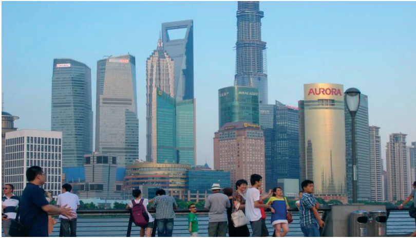
Fot. 3. Widok na dzielnicę Pudong – nowoczesne centrum handlowo- usługowe składające się przede wszystkim z wysokościowców, w centrum Szanghaju.

Czynniki miastotwórcze w przypadku Chin stają się tylko pochodną wzrostu gospodarczego. Przechodzenie od potrzeb człowieka, do odpowiedniego poziomu kreacji przestrzeni, powinno odbywać się w dialogu z nim samym. Jednak tworzenie przestrzeni miejskiej w kategoriach dobrze zorganizowanej przestrzeni publicznej środowiska zbudowanego wymaga wielu różnorodnych działań, których najczęściej nie można dostrzec 3 .