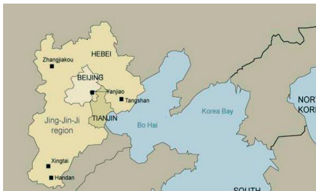
Rys. 1. Skala i zasięg terytorialny planowanego super-miasta Jing – Jin – Ji (Źródło: [1])

W ciągu ostatniego ćwierćwiecza migracja ludności wiejskiej do miast wyniosła około połowę ich obecnych mieszkańców, czyli ponad 300 milionów. Sprawia to, że miasta chińskie stają się coraz większe. Planowane super miasto dla 130 mln ludności, ma połączyć stolicę kraju Pekin z nadmorskim Tianjin i całą prowincję Hebei. [1]