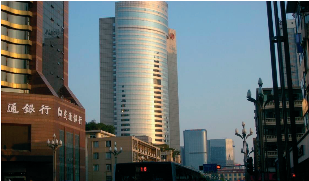
Fot. 4. W centrach miast chińskich szybko powstały wyniosłe wysokościowce, to one są najszybszym odczuwalnym efektem wzrostu gospodarczego – Chengdu (prowincja Syczuan).