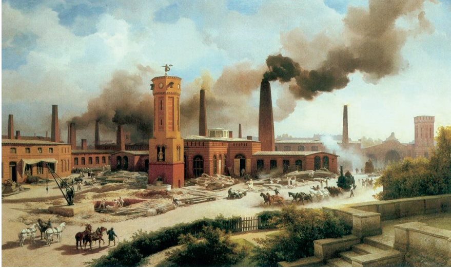
Ryc. 2. Zakłady Borsig AG w Feuerland, Berlin, mal. Karl Eduard Biermann, 1847, scan z Preußen Kunst und Architektur

Wynalazki dokonane w II połowie XIX i oparte na nich technologie, w okresie wyprzedzającym bezpośrednio Gründerzeit , miały fundamentalne znaczenie nie tylko dla procesu industrializacji Niemiec i reszty świata, ale i dla ich kultury, w tym szczególnie dla architektury Gründerzeit . Gdyby nie one, szczególnie te dotyczące użycia stali i cementu, nie mogłoby dojść do masowego budownictwa mieszkaniowego, realizowanego już jako wielokondygnacyjne, z użyciem konstrukcji stalowych, stropów typu Klein'a, a także technologii żelazobetonu.