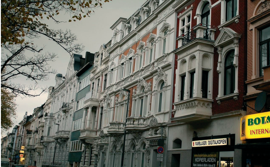
Fot. 3. Pierzeja zabudowy z okresu Gründerzeit , pocz. XX w., Aachen, foto: Sb2s3 – Own work, CC BY-SA 4.0, https://commons.wikimedia.org/w/index.php?curid=44133053DPA