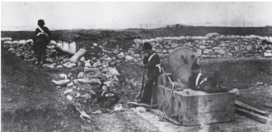
Fot. 4. Armata żeliwna używana w trakcie oblężenia Sewastopola, ok. 1855 r. fot: Roger Fenton

Szczególne znaczenie zyskała stal, bo żelazo było już wcześniej, ale metody jego obróbki pozostawały nadal archaiczne, aż do wynalazku metody jego przetopu przez H. Bessemera. Wprawdzie Wojna Krymska lat 1853-1856 stanowiła idealny poligon testowania nowych technologii, ale bariera wytrzymałości żeliwnych odlewów armat przy rosnącej wadze pocisków została już przekroczona, potrzebny była wytrzymalsza i tania stal, a ta była stosowana dotąd jedynie do produkcji sztuców.