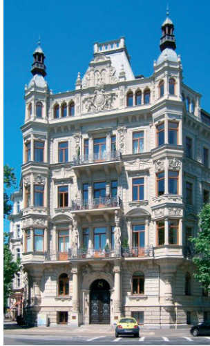
Fot. 1. Kamienica z okresu Gründerzeit w Musikviertel w Lipsku (niem. Leipzig). Beethovenstraße 8, proj. 1892, arch. Arwed Roßbach, rekontr. 2004/2005

pejskiej, tak jak to jest w literaturze polskiej, wyłącznie synonimu tych wynaturzeń, lecz określenie rozpoznawalnego i uznanego stylu estetycznego, nazywanego czasem „pluralizmem stylowym”, panującego szczególnie w architekturze i meblarstwie 2 .