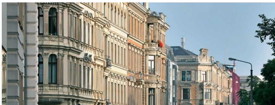
Fot. 2. Pierzeja zabudowy z okresu Gründerzeit , Lipsk (niem. Leipzig)

Trudno wyobrazić sobie spełnienie potrzeb mieszkaniowych takiej masy ludzi na drodze realizacji budownictwa mieszkaniowego metodami tradycyjnymi i to w formule jednorodzinnej. W tej sytuacji boom budowlany budownictwa wielorodzinnego, przemieszanego ze strefami przemysłowymi, w okresie Gründerzeit stał się wymuszoną koniecznością, a proces urbanizacji objął całą Europę Zachodnią i Centralną. Koniecznością stało się znalezienie nowej formuły i technologii budownictwa mieszkalnego. Tak jak neoklasycyzm realizował potrzebę stworzenia narodowej architektury monumentalnej, tak Gründerzeit , jako jedyny z pozostałych stylów historyzujących, powstały i oparty na społecznej potrzebie budowy tożsamości i kultury narodowej Niemiec stanowił zaplecze ideowe i intelektualne dla budownictwa masowego a nie monumentalnego.