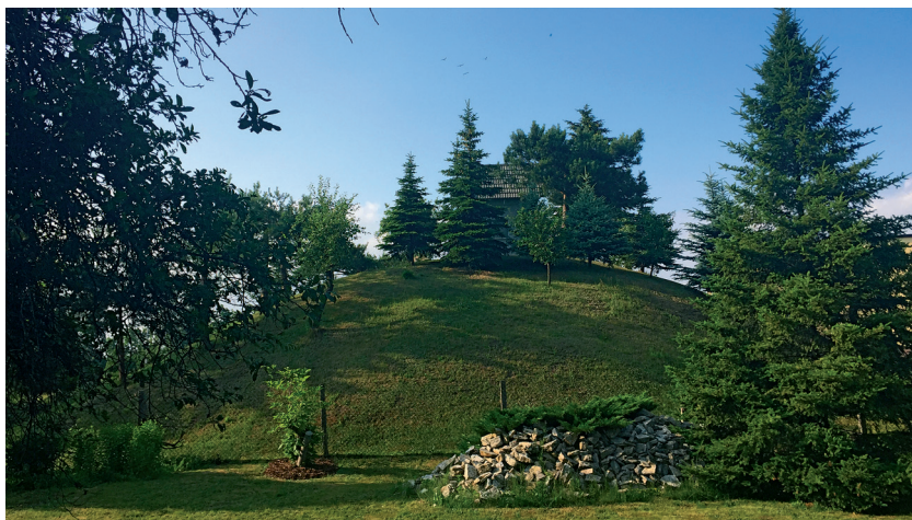
Fot. 1. Widok kopca w Bieruniu.