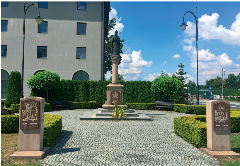
Fot. 6. Widok placu św. Walentego – kolumny oraz tablic.