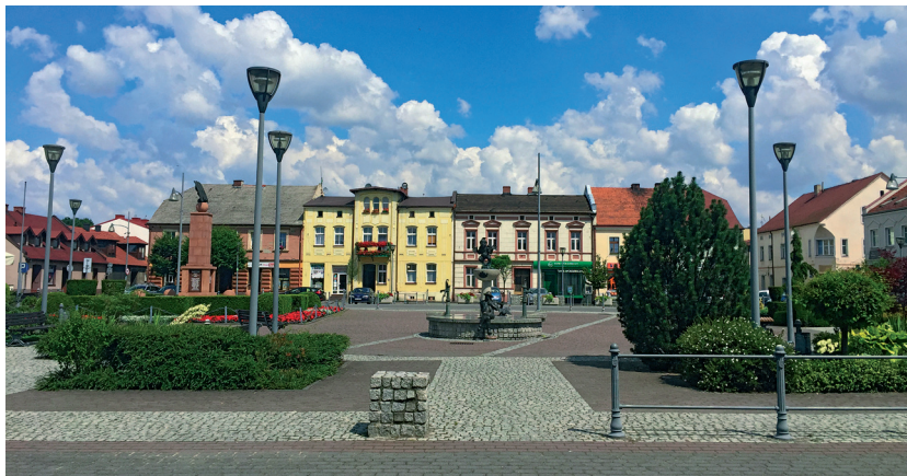
Fot. 2. Widok rynku w Bieruniu.

Kierując się z rynku w stronę południowo-wschodnią i zarazem podążając wyżej wymienioną ul. Krakowską, w odległości kilkuset metrów od płyty głównego ośrodka życia społecznego i gospodarczego zlokalizowane jest kolejne bardzo ważne miejsce kulturowe Bierunia. Stanowi go zabytkowy kościół pod wezwaniem św. Walentego, drewniany, o konstrukcji wieńcowej, wraz z cmentarzem oraz sąsiadującym, współcześnie zaprojektowanym i zrealizowanym skwerem (placem) św. Walentego, z kolumną – pomnikiem św. Walentego Patrona Miasta Bierunia. W przypadku obiektu sakralnego nie znamy daty jego powstania. Pierwsza historyczna wzmianka pochodzi z 1628 roku. Skwer lub tzw. plac św. Walentego zbudowano w 2008 roku. Autorami projektu są: mgr art. plastyk Roman Nyga, mgr art. rzeźbiarz Stanisław Hochuł, mgr inż. arch. Michał Kucziński oraz dr inż. arch. Grażyna Lasek. [3, 4, 5]