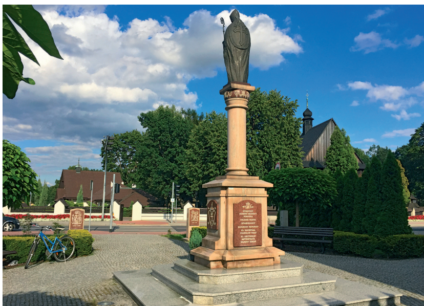
Fot. 3. Widok kościoła p.w. św. Walentego oraz placu św. Walentego.