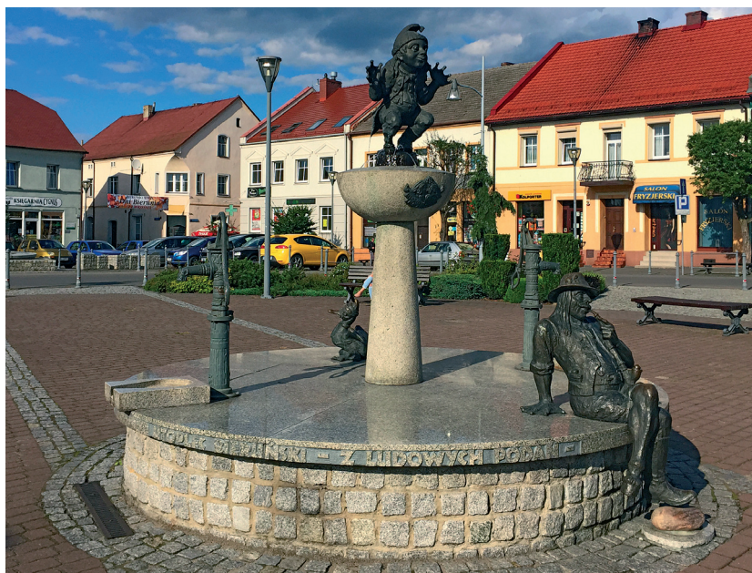
Fot. 5. Widok studni miejskiej zlokalizowanej na płycie rynku w Bieruniu.