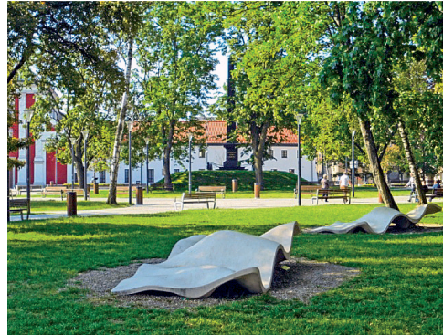
Fot. 9. Detal urbanistyczny jako uzupełnienie zieleni wysokiej.