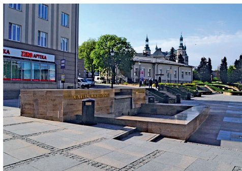
Fot. 5. Detal urbanistyczny – w postaci fontanny.

Najważniejszym atutem tej wolnej przestrzeni jest jej otwartość i połączenie z centrum poprzez deptak. Plac stanowi żyjącą przestrzeń odwiedzaną przez zatrzymujących się tu mieszkańców. To tutaj ustawiane są konstrukcje drewniane tężni – w ramach akcji „tężenie sztuki”, lub rzeźby prezentujące różnych autorów. Przez wiele miesięcy plac przekryty był rodzajem sieci pajęczej, tworząc i obrazując nieznaną dotąd walory wnętrza urbanistycznego w ramach akcji – krystalizacja przestrzeni. Pomysł na otwartą przestrzeń miejską jest jednocześnie ciekawą formą aktywizacji mieszkańców, wzbogacania życia kulturalnego, uwrażliwieniem na współczesne formy prezentacji sztuki. Lokalizacja w obrębie otoczenia usług centrotwórczych, jak kawiarnie, ośrodka informacji turystycznej czy obiektów handlowych, stwarza możliwość biernego wypoczynku dla użytkowników.