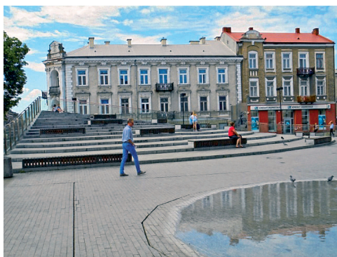
Fot. 2. Skrót pieszy do ul. Focha, z widokiem na amfiteatr.