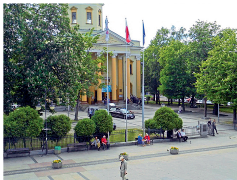
Fot. 3. Plac Konstytucji z Kościołem Św. Bp. Stanisława.

Dodatkowo przestrzeń ta jest wzbogacona jest o wbudowane w posadzkę wodotryski i niezależne siedziska. Miejsce to stanowi skrót narożnika do ulicy Focha, dlatego ruch pieszy o obrębie miejsca miesza się z deptakiem miejski. Teren iluminowany kolorowym światłem fontann oraz oświetlony niskimi lampami.