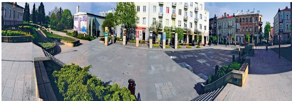
Fot. 4. Panorama Placu Artystów w Kielcach, od otwarcia widokowego na Wzgórze Zamkowe, do zabudowy ul. Sienkiewicza.

Nieco innym przykładem jest Plac Artystów w Kielcach. Przestrzeń oparta o dwie ważne ulice w tym mieście – Kapitulną – prowadzącą do katedry i Pałacu Biskupiego (ważnych obiektów zabytkowych) i Sienkiewicza, stanowiącą główną oś miejską. [15] Przestrzeń obudowana z trzech stron z otwarciem krajobrazowym na zieleń Wzgórza Zamkowego i imponujące wieże obiektów zabytkowych. W zasadzie jest to płaska powierzchnia przeznaczona do prezentacji sztuki, na kiermasze, happeningi i jako miejsce gromadzenia się mieszkańców (spotkania, wiece).