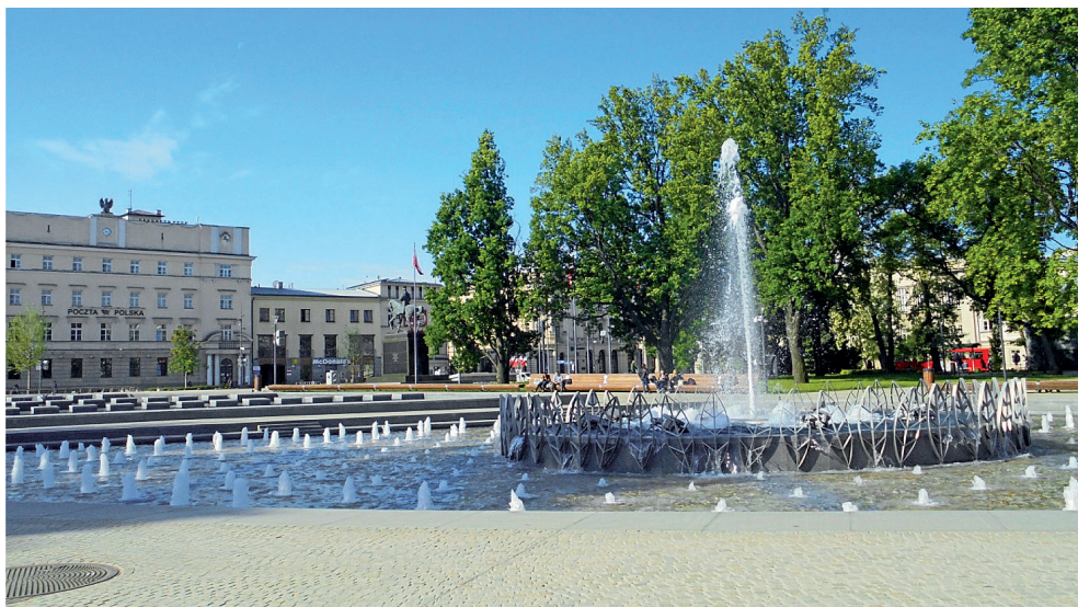
Fot. 7. Główny element Placu Litewskiego w Lublinie, kaskadowa fontanna, w otoczeniu zieleni wysokiej drzew.

Stworzone wewnątrz urbanistyczne zakłada w centralnym swoim miejscu usytuowanie nowoczesnej formy fontanny składającej się z 2 części. Pierwsza z nich z wieloma małymi płaskimi wodotryskami, druga z pojedynczym centralnie usytuowanym wysokim wodotryskiem. Obydwie części dzieli grobla, która jednocześnie stanowi sprzężenie, obydwu części placu z odnowioną szatą roślinną. Włączenie placu do przestrzeni deptaka odbywa się poprzez stworzenie, płaskiego otwartego przedplacu z wyraźnym rysunkiem posadzki nawiązującym do istniejących jej podziałów.