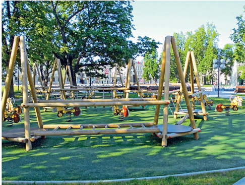
Fot. 8. Koziółkowy plac zabaw w obrębie zieleni Pl. Litewskiego.

Opisywane przykłady rewitalizowanych przestrzeni miejskich placów świadczą o tworzeniu nowych interesujących form łączących stare i kreowane struktury miejskie, z uwzględnieniem współczesnych jakże różnorodnych potrzeb mieszkańców. Świadome korzystanie z wielu zróżnicowanych form wyrazu w budowaniu przestrzeni publicznej może służyć scalaniu struktury urbanistycznej miast.