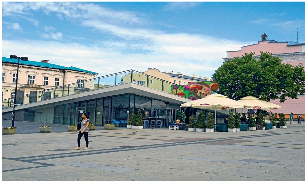
Fot. 1. Wkomponowanie elementu nowoczesnej architektury – amfiteatru, w historyczną przestrzeń centrum Radomia.