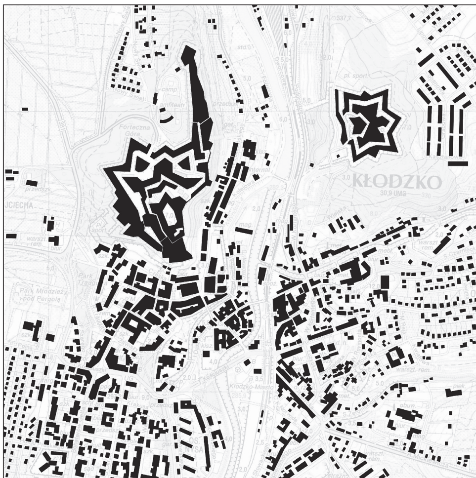
Rys. 4. Analiza kompozycyjna – opracowanie Katarzyna Drobek, Katarzyna Tkaczyk, Karol Knap

Tego typu wartościowy obiekt staje się więc swoistym miejscem węzłowym zarówno dla samego miasta ale również dla całego regionu. Omawiana fortyfikacja stanowi oprócz wartości zabytkowej bardzo atrakcyjne turystycznie miejsce przyciągające ludzi a tym samym napędzające gospodarkę oraz rozwój miasta Kłodzko. Potrzebna jest świadomość, iż obecna funkcja nie jest skazana wyłącznie pod przeznaczenie obiektu muzealnego. Należy poszukiwać nowych odważnych rozwiązań związanych z adaptacją [13]. Czasem ważnym jest zrozumienie potrzeby społecznej i ekonomicznej w pozyskiwaniu przyszłego inwestora dla tak nietypowych budowli [14]. Będzie miało to ogromny wpływ na dalsze istnienie (w tej lub innej formie) obiektu, które ściśle powiązane jest z funkcjonowaniem i rozwojem przestrzennym jak również ekonomicznym czy kulturowym miasta.