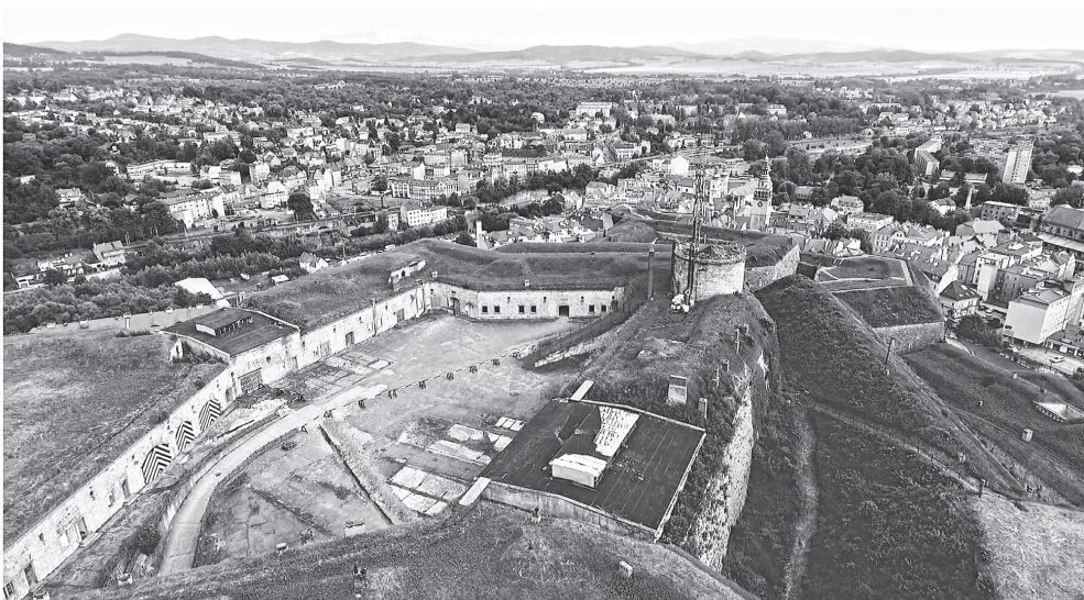
Rys. 3. Widok z lotu ptaka Twierdzy Kłodzko na tle miasta – opracowanie autor