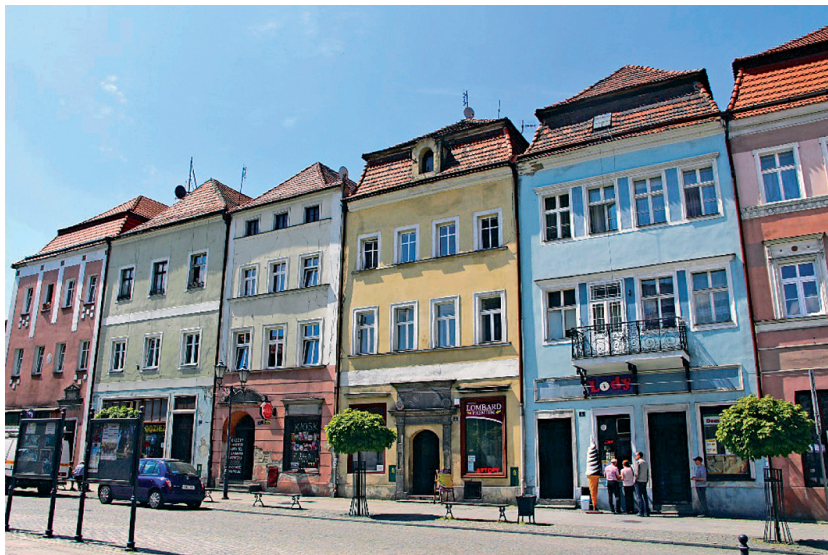
Fot. 6. Kozuchów, kamienice w zachodniej pierzei starego rynku