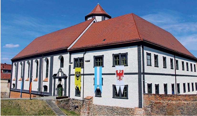
Fot. 2. Kozuchów, zamek, widok od południowego wschodu

Zamek , wzniesiony w pierwszej połowie XIV wieku na miejscu średniowiecznego grodu kasztelańskiego. Przez lata był siedzibą książęcą, rezydencją możnych rodów, klasztorem zakonu karmelitów, zbrojownią. Zbudowany w stylu gotyckim, obecnie o zatartych znamionach stylowych. Obiekt powiązany jest z systemem obronnym miasta.