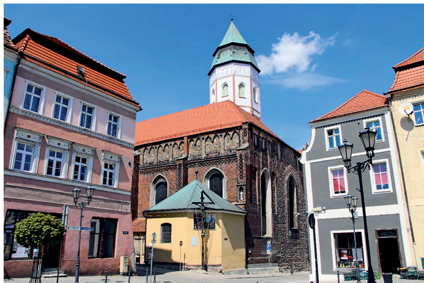
Fot. 4. Kozuchów, kościół parafialny pw. Oczyszczenia NMP