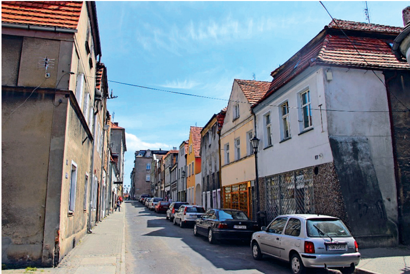
Fot. 7. Koźuchów, wjazd do starego miasta od strony zachodniej

Ruch kołowy w obrębie centrum miasta jest bardzo źle zorganizowany. Nieczytelny, zwłaszcza dla osób spoza Koźuchowa, jest dojazd do wnętrza starego miasta. Również nieczytelna jest organizacja ruchu w systemie ulic jednokierunkowych. Mała ilość parkingów, zarówno dla mieszkańców miasta jak i dla turystów, jest przyczyną powstawania tzw. „dzikich” parkingów. Ruch pieszy, jako istotny element komunikacji, również należy przeorganizować. Widoczny jest brak segregacji ruchu pieszego i kołowego. Nieczytelna jest organizacja ruchu pieszego. Nie ma wytyczonych i oznakowanych tras turystycznych.