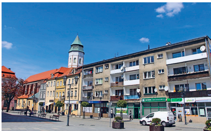
Fot. 12. Kozuchów, zabudowa w północnej pierzei starego rynku

W sylwecie staromiejskiej istnieje rozrzut punktów wysokościowych, niekorzystnie konkurujących ze starymi. W XX wieku w zespole staromiejskim powstały trzy czterokondygnacyjne bloki mieszkalne (ul. Rynek, ul. Klasztorna, ul. Mickiewicza) zakłócające dawny układ przestrzenny, przytłaczające optycznie pobliski zamek. Spowodowały zakłócenie panoramy historycznego miasta. Budynki te usytuowane w pobliżu zamku, murów obronnych, popsuły całkowicie osie widokowe. Zachwiana została także zabytkowa skala. Zgodnie z powszechnie stosowaną zasadą, w zespołach staromiejskich najwyższe i najbardziej okazałe budynki stały na centralnie położonym rynku, a wysokość obiektów malała proporcjonalnie do oddalania się od środka miasteczka. Budynki czterokondygnacyjne zbudowane zostały obok trzy- i dwukondygnacyjnych.