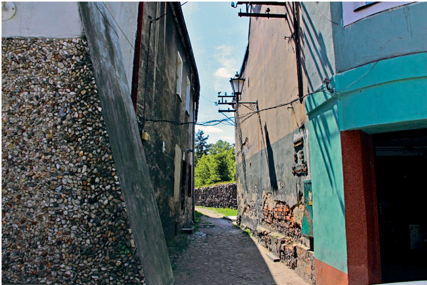
Fot. 8. Koźuchów, uliczka przymurna w zachodniej części starego miasta

Ruch kołowy w obrębie centrum miasta jest bardzo źle zorganizowany. Nieczytelny, zwłaszcza dla osób spoza Koźuchowa, jest dojazd do wnętrza starego miasta. Również nieczytelna jest organizacja ruchu w systemie ulic jednokierunkowych. Mała ilość parkingów, zarówno dla mieszkańców miasta jak i dla turystów, jest przyczyną powstawania tzw. „dzikich” parkingów. Ruch pieszy, jako istotny element komunikacji, również należy przeorganizować. Widoczny jest brak segregacji ruchu pieszego i kołowego. Nieczytelna jest organizacja ruchu pieszego. Nie ma wytyczonych i oznakowanych tras turystycznych.