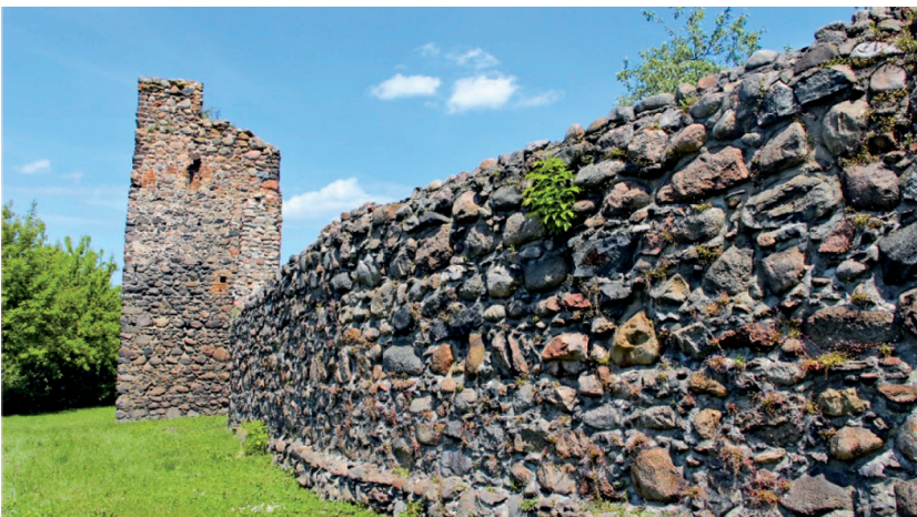
Fot. 3. Kozuchów, fragment murów obronnych, widok od zachodu

Mury obronne , zbudowane na przełomie XIII i XIV wieku w miejscu wcześniejszych umocnień drewniano-ziemnych. Wykonane z kamienia polnego, układanego warstwowo. Pierścień murów opasywała dochodząca miejscami do 20 metrów szerokości fosa. Do miasta można było dotrzeć trzema bramami: Głogowską, Krośnieńską i Żagańską. Później w południowej części przebito czwartą bramę zwaną Szprotawską. W 1764 roku, po wielkim pożarze, część fortyfikacji została rozebrana – materiał wykorzystano do budowy domów. Mury i fosa do dziś zachowały się niemal w pierwotnej długości i są unikatem w skali kraju.