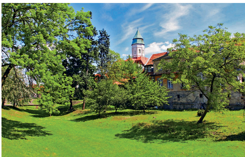
Fot. 10. Koźuchów, fragment fosy miejskiej, widok od południowego zachodu

Wzdłuż murów miejskich projektuje się ciągi piesze. Przebiegać będą one po zewnętrznej stronie murów, wzdłuż fosy, częściowo od strony wschodniej a także południowej i zachodniej. Wewnętrzny ciąg pieszy przebiegać będzie wzdłuż całego obwodu obronnego oraz na północ od zamku.