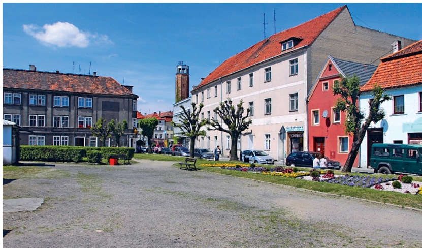
Fot. 9. Koźuchów, zaniedbany skwer, miejsce po dawnej zabudowie po stronie wschodniej od rynku