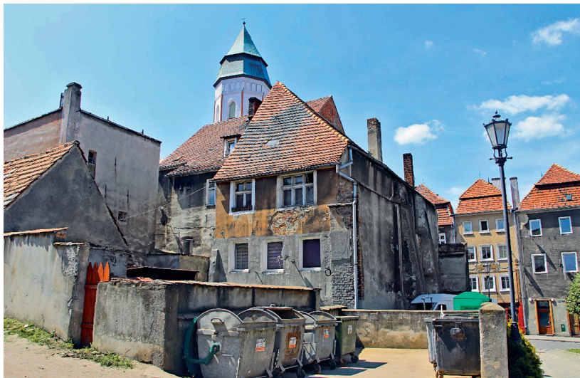
Fot. 13. Kozuchów, zabudowa na tyłach kamienic w północnej części starego rynku