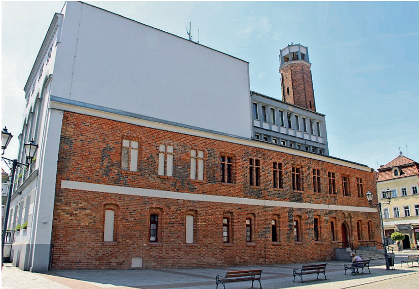
Fot. 5. Koźuchów, późnogotycki ratusz z powojenną rozbudową

Ratusz , wzniesiony na początku XIV wieku jako murowany, piętrowy budynek, usytuowany w północnej części placu rynkowego. Obiekt spłonął w 1488 roku, zachowały się tylko przesklepione piwnice ukryte pod nawierzchnią rynku dostępne z podziemi obecnego ratusza. W roku 1489 wzniesiono następny ratusz późnogotycki. Ratusz był budowlą piętrową murowaną z cegły nakrytą dachem dwuspadowym, z dekorowanymi szczytami w postaci ostrołukowych wnęk i sterczyn. Otwory posiadały profilowane obramienia ceramiczne. Wieża ratuszowa z dzwonem i zegarem nie była związana z bryłą ratusza. Liczne pożary sprawiły wiele zniszczeń i liczne przebudowania. W XIX wieku ratusz został rozbudowany o neoklasycystyczny fragment budowli. Spalony w 1945 roku, po wojnie został przebudowany, łącząc elementy historyczne ze współczesnymi.