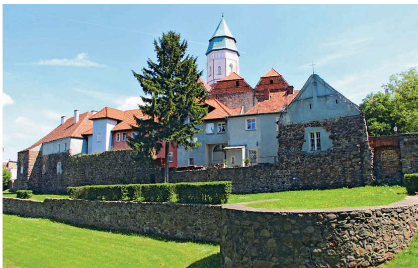
Fot. 1. Kozuchów, widok starego miasta od strony zachodniej

W ostatnich latach, na Wydziale Budownictwa, Architektury i Inżynierii Środowiska Uniwersytetu Zielonogórskiego, prowadzono prace, których celem było znalezienie cech charakterystycznych, jakie posiadają wybrane miasta średniej wielkości w województwie lubuskim, które mogłyby być wykorzystane w planach ich rewitalizacji. Np. Krosno Odrzańskie, którego stare miasto zostało zniszczone prawie w całości wskutek działań II wojny światowej i do dzisiaj nie jest odbudowane. Ośno Lubuskie, częściowo zniszczone lecz zamknięte, z doskonale zachowanym, pierścieniem średniowiecznych fortyfikacji. Gubin, z centrum zniszczonym w czasie wojny, później częściowo, chaotycznie zabudowanym, z potężną, gotycką sylwetką kościoła farnego. Jednym z nich jest Kozuchów, historyczne miasto zamknięte średniowiecznymi fortyfikacjami, które przez dziesięciolecia ulegało powolnej degradacji.