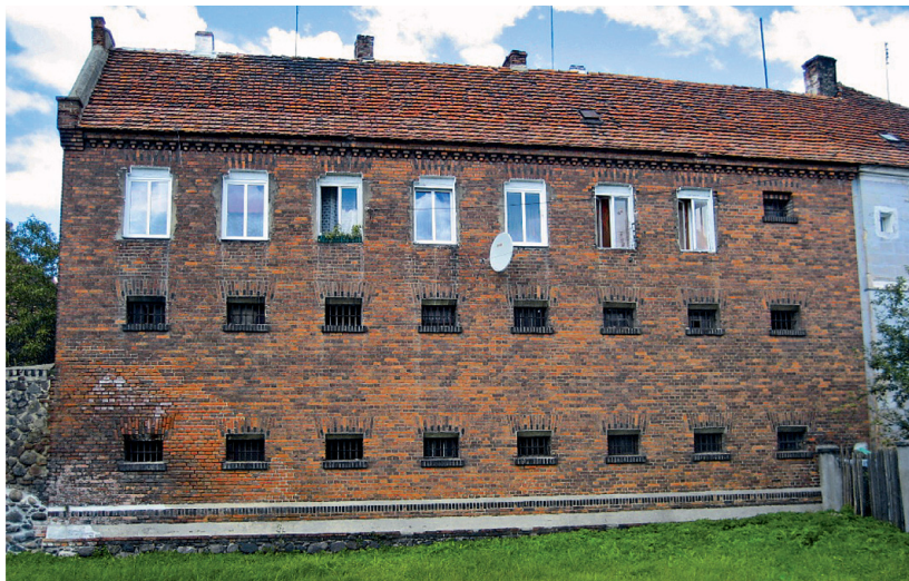
Fot. 11. Kozuchów, przemysłowy budynek wzniesiony w linii murów obronnych od strony południowej