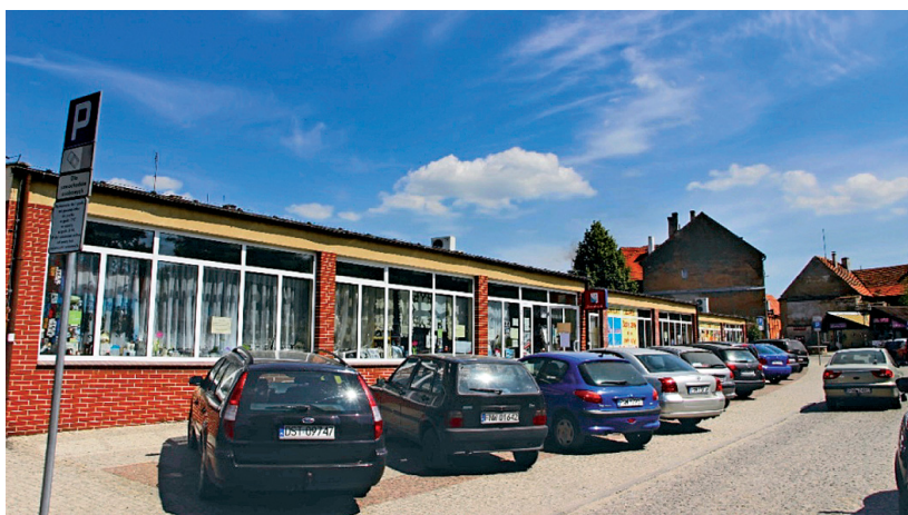
Fot. 14. Pawilony handlowe we wschodniej części starego miasta

Postuluje się zaplanowanie ogólnego uporządkowania terenu polegające na usunięciu obiektów tymczasowych, zabudowy oficynowej, garaży, budynków gospodarczych (ul. Mickiewicza, Kościelna, Legnicka, Głogowska, Limanowskiego, Obywatelska, Daszyńskiego) z pozostawieniem jednak fragmentów zabudowy oficynowej przeznaczonej do modernizacji (ul. Krzywoustego).