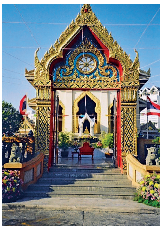
Fot. 6. W wielu miejscach architektura sakralna

Chcąc określić miejsce przecinania się kierunków i sieci dróg w obrębie centrum – należy powiedzieć o dworcu kolejowym Hua Lamphong. Jako znaczący obiekt kubaturowy o wymiarze historycznym stanowi on dominantę przestrzenną i istotny komunikacyjny węzeł przesiadkowy w obrębie miasta. Specyfika tego miejsca polega na jego randze i znaczeniu dla samych mieszkańców, ich miejscu pracy (małych straganów rozlokowanych w okolicznych uliczkach) i walorach jako miejsca przecinania się arterii komunikacyjnych. Postępująca unifikacja i globalizacja sprawia iż przestrzeń publiczna wokół, staje się coraz częściej ograniczona i sprowadzona do wymiaru funkcji komunikacyjnej.