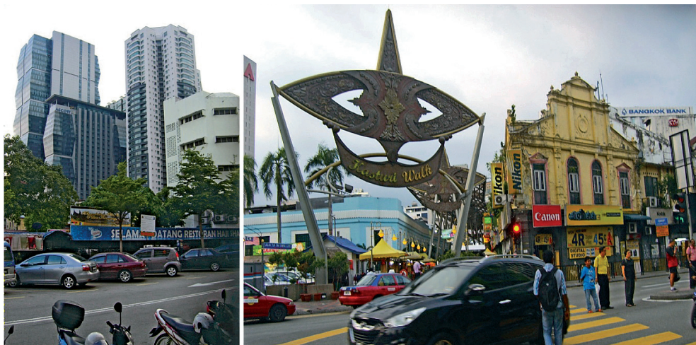
Fot. 2. Otoczenie nowoczesnych budynków

KL Sentral to przede wszystkim węzeł centralny. Jednak nie jedyny w tym mieście. O podobne miano rywalizują KLCC (Kuala Lumpur City Center) z nowoczesnym symbolem tego miejsca w postaci wież Petronas Towers, oraz China Town z odmienną niską dość chaotyczną przestrzenią i niejednorodną zabudową. Do niedawna istotną była lokalizacja centralna głównego dworca autobusowym Putra w podziemiu. Niespójne centrum miasta z wieloma węzłami strategicznymi i rozbudowaną wielopoziomową komunikacją kołową wydaje się organizować przestrzeń wokół nowoczesnych wysokościowców, czy to o charakterze biznesowym czy sakralnym, wielu meczetów (a dokładniej ich dominant – minaretów).