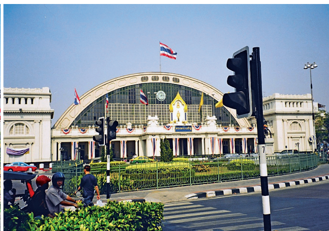
Fot. 7. Okolice dworca kolejowego Hua Lamphong – punkt strategiczny Bangkoku miesza się z zabudową miejską.