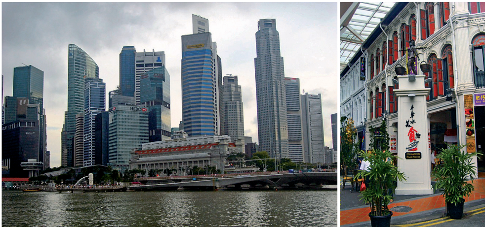
Fot. 4. Promenada wzdłuż wybrzeża morskiego – zabudowa wysoka centrum Singapuru

Niespotykany nigdzie indziej na Dalekim Wschodzie przemysłany proces urbanistyczny kształtowania miast, polega na wykorzystaniu aspektów zrównoważonego rozwoju, poprzez połączenie rozwiązań proekologicznych ze świadomą partycypacją społeczną mieszkańców. Tego typu podejście stawia Singapur w szeregu państw innowacyjnych przysposobujących zdobycze naukowo-techniczne do potrzeb rozwoju przestrzennego.