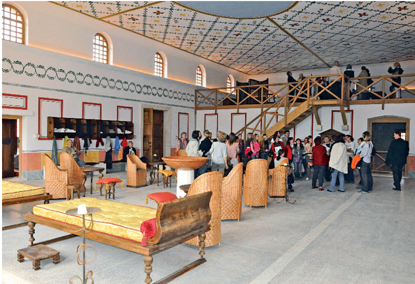
Rys. 7. Park archeologiczny Petronellum-Carnuntum w Austrii, wewnątrz „antycznego” budynku term rzymskich, odbierane przez zwiedzających jako autentyczny „zabytek” (na podstawie sondaży)

Niezależnie od wątpliwości i zastrzeżeń, muzealizacja pozostanie istotnym czynnikiem w kształtowaniu współczesnej przestrzeni publicznej, która jest paradoksalnie przestrzenią „historyczną”, skoro poruszamy się wśród rzeczy już zasiedlających tę przestrzeń, a więc należących do przeszłości, a ich percepcja i relacje pomiędzy tymi rzeczami jest wynikiem doświadczenia możliwego do zaistnienia wyłącznie z perspektywy przemijania czasu.