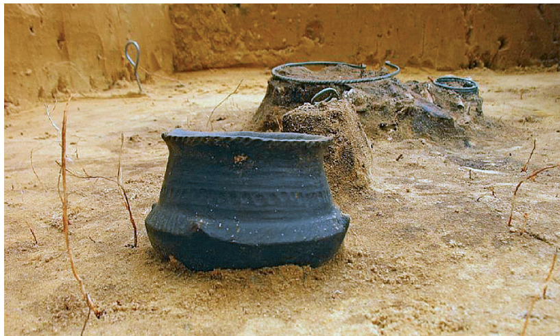
Rys. 4. Amfory znaleziona na cmentarzysku kultury łużyckiej na budowie autostrady A4 koło Kokołowa w rejonie Wieliczki, datowane na VII–V w. p.n.e.

Biorąc pod uwagę, że pojęcie „środowisko kulturowe” ma wymiar niematerialny i materialny zarazem, warto zauważyć, że muzealizacja w dużej mierze dotyczy właśnie przestrzeni publicznej , a polega na lokowaniu w niej nie tylko obiektów sensu stricto muzealnych, quasi muzealnych, czy w ogóle obiektów publicznych: często centrów kultury projektowanych z założenia jako struktury funkcjonalnie hybrydowe przystosowane także do okazjonalnej prezentacji nowości z przeszłości – pomieszczenia kuluarów Stadionu Narodowego w Warszawie były np. wykorzystane w 2016 roku do prezentacji wystawy Muzeum Archeologicznego Herkulanum (Rys. 5) – wreszcie kreowanych intencjonalnie muzealizacji miejsc historycznych dedykowanych wyłącznie nowościom z przeszłości , czyli odzyskiwanym artefaktom pochodzącym z przeszłości. Wszystkie te formy muzealizacji naszej przestrzeni kulturowej coraz liczniej „zasiedlają” tę przestrzeń, integrując elementy profanum i sacrum .