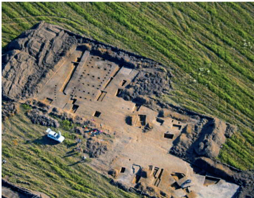
Rys. 2. Stanowisko archeologiczne na trasie autostrady A4 w rejonie Wieliczki