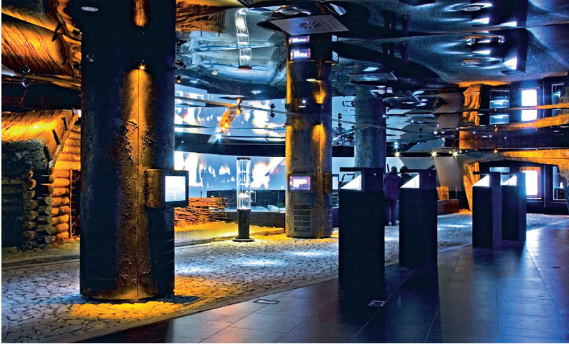
Rys. 9. Muzeum Podziemne Rynku Krakowskiego, główna sala ekspozycyjna