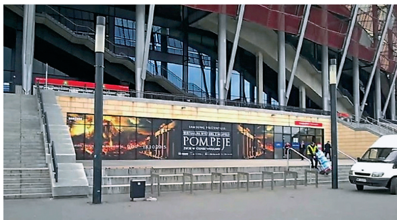
Rys. 5. Stadion narodowy w Warszawie jako miejsce prezentacji wystawy Wirtualne Muzeum Herkulanum (MAV – Museo Archeologico Virtuale, Ercolano)

Biorąc pod uwagę, że pojęcie „środowisko kulturowe” ma wymiar niematerialny i materialny zarazem, warto zauważyć, że muzealizacja w dużej mierze dotyczy właśnie przestrzeni publicznej , a polega na lokowaniu w niej nie tylko obiektów sensu stricto muzealnych, quasi muzealnych, czy w ogóle obiektów publicznych: często centrów kultury projektowanych z założenia jako struktury funkcjonalnie hybrydowe przystosowane także do okazjonalnej prezentacji nowości z przeszłości – pomieszczenia kuluarów Stadionu Narodowego w Warszawie były np. wykorzystane w 2016 roku do prezentacji wystawy Muzeum Archeologicznego Herkulanum (Rys. 5) – wreszcie kreowanych intencjonalnie muzealizacji miejsc historycznych dedykowanych wyłącznie nowościom z przeszłości , czyli odzyskiwanym artefaktom pochodzącym z przeszłości. Wszystkie te formy muzealizacji naszej przestrzeni kulturowej coraz liczniej „zasiedlają” tę przestrzeń, integrując elementy profanum i sacrum .