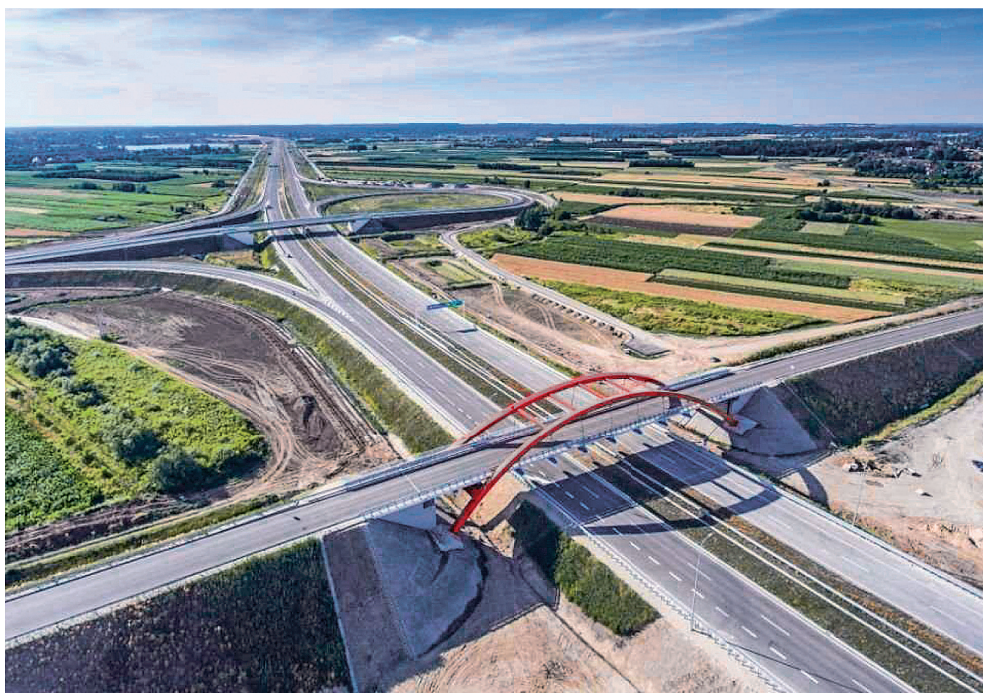
Rys. 1. Autostrada A4 przebiegająca przez tereny historycznej małopolski na odcinku Kraków-Korzowa której budowę poprzedziły badania archeologiczne stała się źródłem rewolucyjnych zmian w wiedzy o przeszłości tego obszaru

Rzeczywiście, nie tylko w Europie, ale także w Polsce jest zauważalna postępująca muzealizacja środowiska kulturowego wyrażająca się w „gwałtownym przyroście muzeów w świecie współczesnym i we wzroście ich społecznej roli” 10 . Jest to nie tylko rezultat wzrostu zapotrzebowania na kulturę wynikającego z wykształcenia i poziomu intelektualnego społeczeństwa, ale także wynik „uboczny” coraz szerszej modernizacji infrastruktury komunalnej czy industrialnej w postaci nowych odkryć archeologicznych i atrakcyjnego zagospodarowania ich rezultatów. (rys. 1, 2, 3, 4)