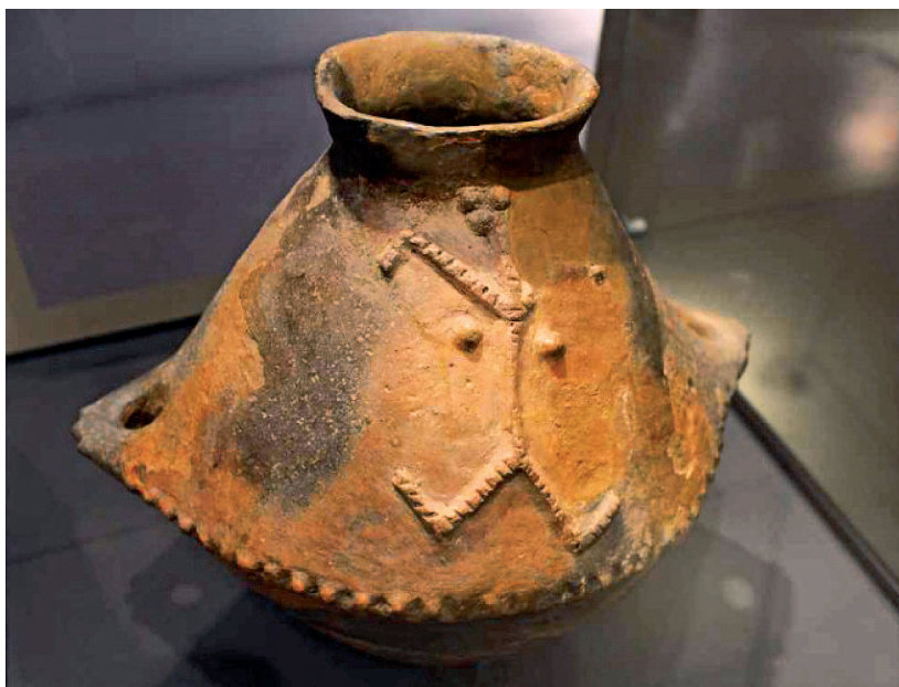
Rys. 3. Amfora z symbolicznym wizerunkiem kobiety datowana na 4,5 tysiąca lat p.n.e., znaleziona na terenie budowy autostrady A4 na Odcinku Rzeszów-Jarosław