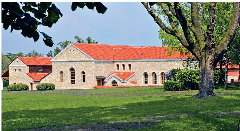
Rys. 6. Park archeologiczny Petronellum-Carnuntum w Austrii, nowo wzniesiony w oparciu o założenia archeologii eksperymentalnej „antyczny” budynek term rzymskich

Zastrzeżenia związane z nadmiernym stosowaniem substytucjonalnych wartości dotyczą także współczesnej doktryny konserwatorskiej, a zwłaszcza wartości naukowo-historycznej „ rekonstruowanych rzeczywistości ” 16 , które wypierają „ coraz bardziej faktyczną realność rzeczywistości ” 17 i stają się już nie tyle substytutem ile powszechnie rozumianym atrybutem autentyzmu. (Termy Rzymskie w Carnuntum, Park Archeologiczny w Xanten, muzea archeologiczne limesu rzymskiego na linii Mosela-Ren; Rys. 6, 7)