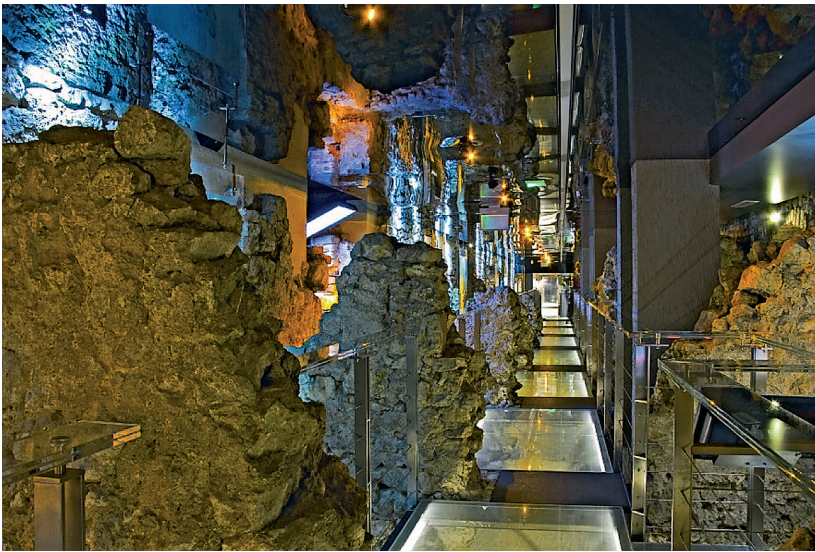
Rys. 10. Muzeum Podziemne Rynku Krakowskiego, galeria ekspozycyjna, pasaż o długości 100 m, poprowadzony wzdłuż komór zachodniego traktu Kramów Bogatych do wnętrza Wagi Wielkiej

Badania na obszarach inwestycji uzupełniają wiedzę o przeszłości, która jest zapisywana w formie Archeologicznego Zdjęcia Polski (AZP). Realizowane od 1978 roku przedsięwzięcie poszukiwania, identyfikowania i dokumentowania stanowisk archeologicznych ma na celu ochronę tych stanowisk i gromadzenie informacji zwłaszcza pod kątem ich wykorzystania w kontekście planowanych inwestycji 22 .