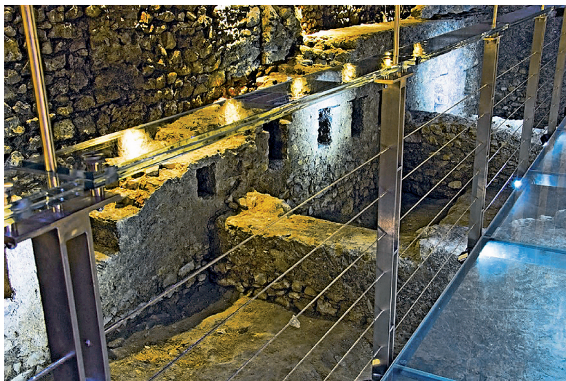
Rys. 11. Muzeum Podziemne Rynku Krakowskiego, galeria ekspozycyjna nad pomieszczeniami pierwszych, lokacyjnych kramów kamiennych z II połowy XIII wieku

W badaniach humanistycznych i społecznych zwraca się uwagę, że owa muzealizacja przestrzeni , będąca reakcją na potrzeby modernizacyjne i poszukująca przywrócenia wagi odniesienia do przeszłości, oraz spełniająca funkcje równoważące wobec rozwoju cywilizacji, oznacza de facto rewaloryzację całych krajobrazów kulturowych i restaurację starych, niekoniecznie artystycznie cennych budynków i budowli, ale posiadających „wartość starożytniczą”, wreszcie – rosnący dynamicznie popyt na relikty historii naturalnej 23 .