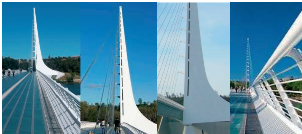
Rys. 5, 6. Detale mostu „Sundial” w Redding.

estetycznych, przeciwpoślizgowych szklanych paneli, które dają wrażenie lekkości, wyznaczeniem ścieżki rowerowej kawałkami granitu, pokryciem podparć i zakotwiczeń drobno połączoną białą ceramiką. Zróżnicowano również kształt i profile barierek, dzięki czemu podkreślono dynamikę konstrukcji. Most jest dziełem dopracowanym w najdrobniejszych szczegółach, a tendencja ta dotyczy wszystkich dzieł Calatravy.