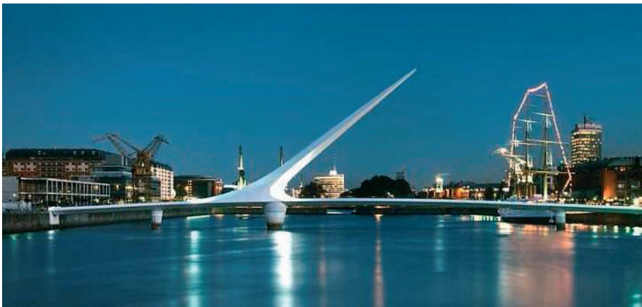
Rys. 1. Most „Puente de la Mujer” – widok nocą.

Most „Puente de la Mujer” („Most Kobiet”), oddany do użytku w 2001 roku, zlokalizowany jest w dzielnicy Puerto Madero - rejonie portowym Buenos Aires. Łączy on Dok 3 z miastem. Obiekt ma konstrukcję podwieszaną (wantową), jest przeznaczony wyłącznie dla pieszych. Składa się z trzech części: dwóch stałych – po stronie nabrzeży i środkowej – oraz ruchomej. Głównymi elementami mostu są 35-metrowy pylon w kształcie iglicy