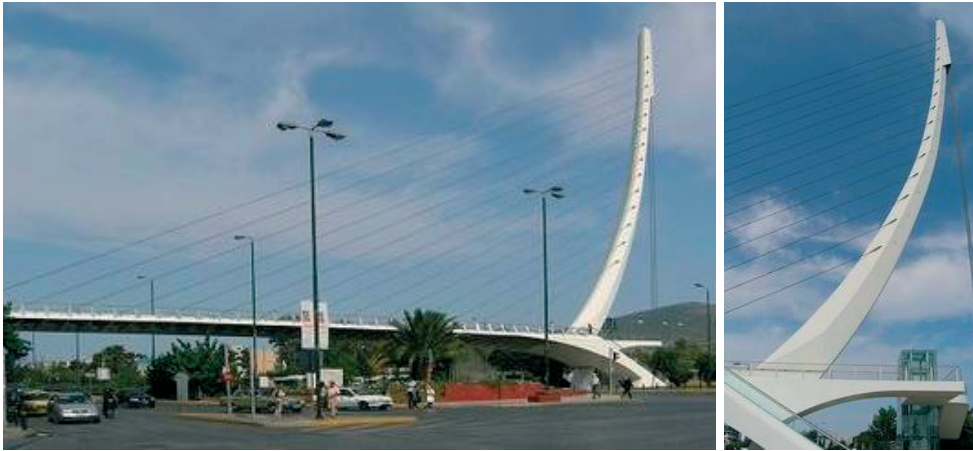
Rys. 3, 4. Kładka w kierunku terenów Olimpiady w Atenach – widok ogólny i zbliżenie na pylon.

Kładka „Katehaki” jest jednym z symboli Igrzysk Olimpijskich w Atenach w 2004 roku, a jednocześnie jubileuszowym, 50. mostem w dorobku Calatravy. Cały kompleks olimpijski, zlokalizowany w Marousi, na północnym przedmieściu Aten, jest dziełem właśnie tego architekta.