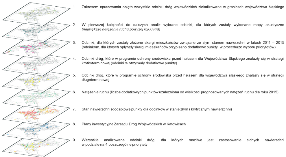
Rys. 1. Procedura postępowania przy wyborze i klasyfikacji odcinków dróg wojewódzkich do priorytetów określających kolejność zastosowania cichych nawierzchni

Powyższe kryteria weszły w skład procedury wyboru i klasyfikacji odcinków, którą przedstawiono na rys. 1.