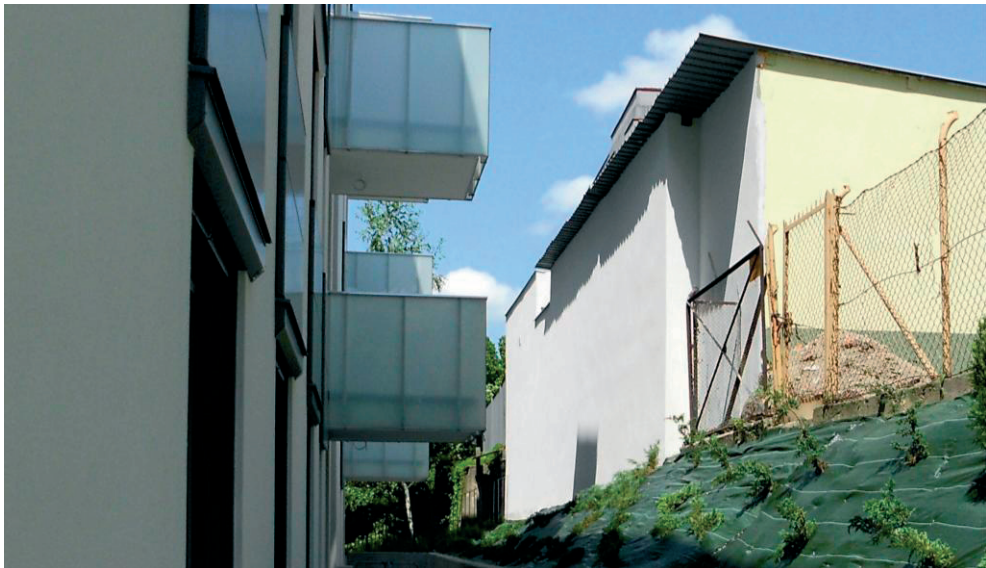
Fot. 3. Omawiana ściana garażu

Koncepcja dotyczy tylnej ściany garażu, stanowiącej bezpośredni widok z okien nowo wybudowanego bloku przy ulicy Leszczyńskiego (Fot. 3). Koncepcja zakłada wprowadzenie ogrodu wertykalnego, który ma na celu przysłonięcie nieatrakcyjnej i monotonnej ściany garażu oraz zapewnienie miłego widoku z okien mieszkańcom nowego budynku mieszkalnego.