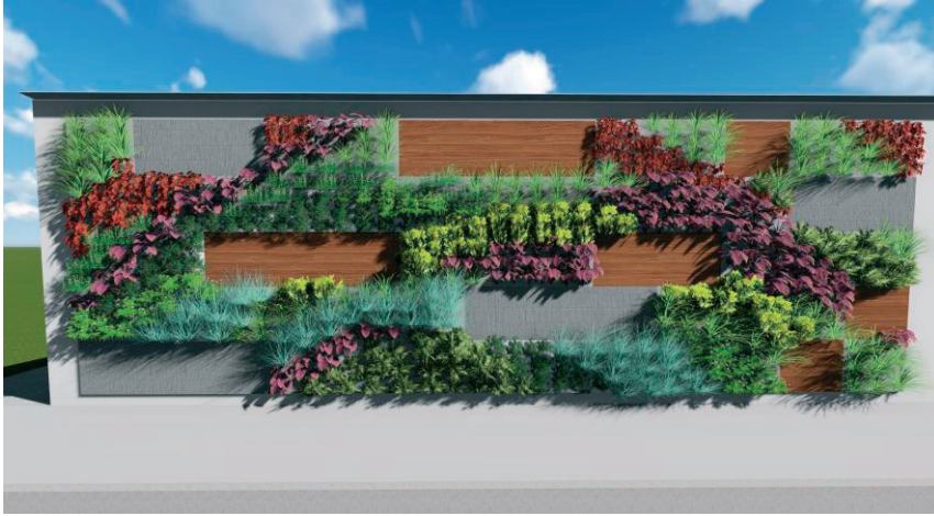
Rys. 3. Widok ogrodu wertykalnego na ścianie garażu - wizualizacja