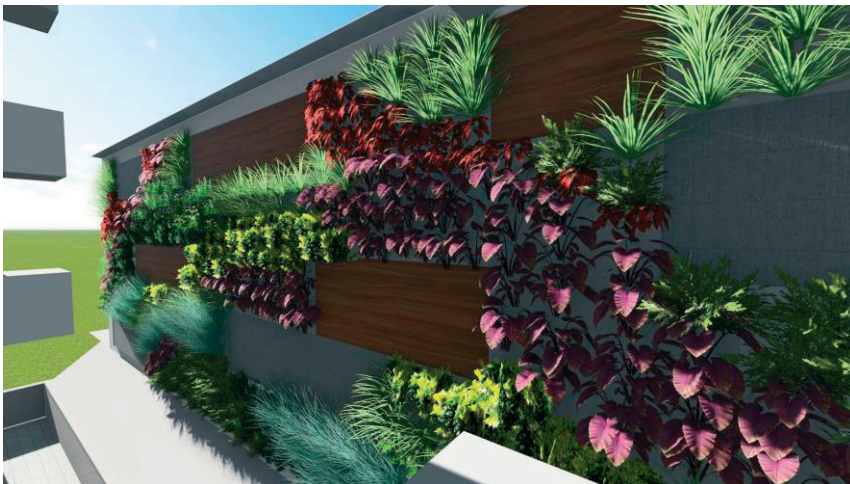
Rys. 4. Widok na ścianę garażu zabudowaną ogrodem wertykalnym – wizualizacja