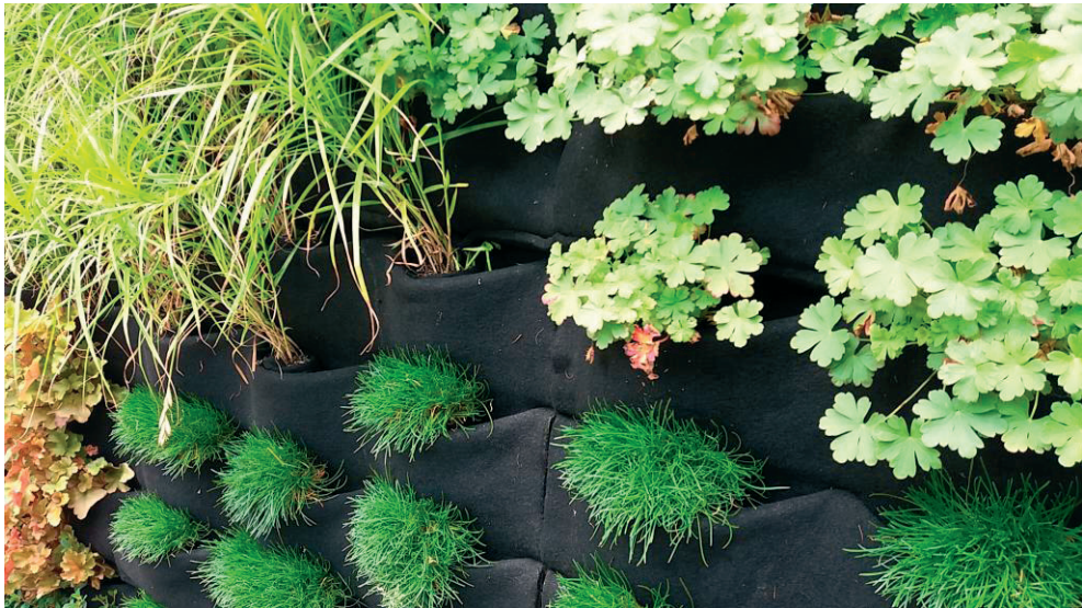
Fot. 2. Rośliny posadzone w filcowym systemie kieszeniowym

System kontenerowy. System rzadko stosowany, polegający na stworzeniu przestrzennej konstrukcji kratownicowej podzielonej na wiele poziomów, na których ustawiane są pojemniki z roślinami. Pojemniki wypełnione są odpowiednim podłożem, posiadającym zdolność magazynowania wody i substancji odżywczych. Wspinaczkę roślin umożliwia system stalowych lin lub siatek, z których można tworzyć proste lub bardziej skomplikowane formy. To rozwiązanie jest bardziej przestrzenne i zajmuje więcej miejsca niż systemy kieszeniowe i panelowe [12].