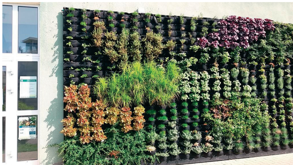
Fot. 1. Ogród wertykalny na ścianie Uniwersytetu Przyrodniczego w Lublinie

no ścianami zieleni o łącznej powierzchni około 30 m 2 . Nawiązują one kształtem oraz wzorem do modernistycznych trendów łącząc historię z nowoczesnym rozwojem miasta [10]. W Lublinie takie rozwiązanie można podziwiać na ścianie budynku Rektoratu Uniwersytetu Przyrodniczego w Lublinie (Fot. 1). Do przygotowania ogrodu o powierzchni 20 m 2 wykorzystano 22 gatunki roślin. Instalacja oprócz walorów estetycznych pełni funkcje naukowe, m.in. określanie wytrzymałości roślin na zewnętrzne warunki atmosferyczne [11].