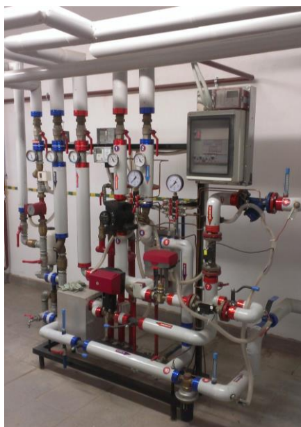
Rys. 3. Компактний вузол теплий Мал. 3. Компактні підстанції

Аналізована установка допомагає підігрівати воду у чотириповерховому будинку. Який знаходиться в Любліні, в третій кліматичній зоні. Установка підживлюється з вакуумних труб площею 15 \text{ m}^2 і складається з двох резервуарів об'ємом 650 \text{ літрів} кожен (мал. 1). Будівля має окремий вузол, подвійного призначення, який співпрацює з сонячною установкою (мал. 2).