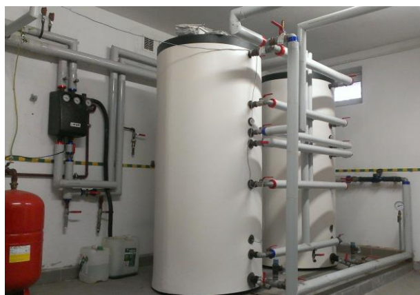
Rys. 2. Zbiorniki magazynujące instalacji słonecznej Мал. 2. Накопичувальні сонячні баки

Analizowana instalacja grzewcza wspomaga podgrzew ciepłej wody użytkowej w budynku wielorodzinnym, czteropiętrowym. Budynek zlokalizowany jest w Lublinie, w trzeciej strefie klimatycznej. Instalacja zasilana jest z kolektorów próżniowych o powierzchni 15 \text{ m}^2 i wyposażona w dwa zbiorniki magazynujące o pojemności 650 \text{ l} każdy (rys. 1). W budynku znajduje się węzeł indywidualny, kompaktowy, dwufunkcyjny współpracujący z instalacją słoneczną (rys. 2).