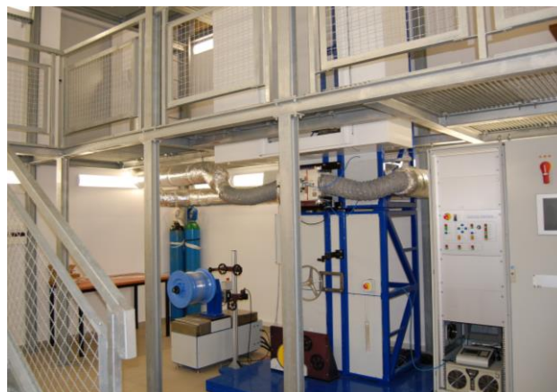
Rys. 5. Fragment instalacji do wytwarzania światłowodów

obejmuje budowę stanowisk oraz prowadzenie prac naukowo - badawczych dotyczących efektywności energetycznej przetwarzania energii w szerokim zakresie zmian prędkości obrotowej oraz przy zmiennym obciążeniu, w układzie przekształtnik - maszyna synchroniczna PMSM, asynchroniczna pierścieniowa lub asynchroniczna klatkowa. W pracy będą wykorzystywane czterokwadrantowe przekształtniki energoelektroniczne, które pozwolą prowadzić badania zarówno w stanach ustalonych jak i stanach przejściowych, zapewniając zwrot energii do sieci zasilającej, z jednoczesną rejestracją momentu mechanicznego i prędkości obrotowej badanych maszyn. Planowane jest opracowywanie i testowanie oryginalnych metod szacowania parametrów systemów elektromechanicznych, kluczowych do uzyskania sterowań o wysokiej jakości.