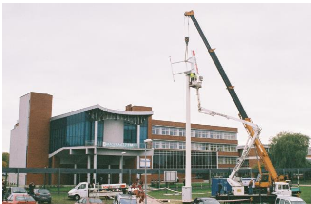
Rys. 4. Budynek Wydziału Elektrycznego oraz kompleks auli. Na pierwszym planie montaż elementów hybrydowego systemu OZE

budowy i opłacalności inwestycji w prosumenckie, hybrydowe systemy wytwarzania energii elektrycznej. Budynek oraz hybrydowy system energetyczny są bazą tworzonego centrum kompetencyjnego, w którym w warunkach rzeczywistych będą prowadzone badania dotyczące budowy, eksploatacji i sterowania w systemach OZE. Centrum będzie pełnił również rolę obiektu wzorcowego w zakresie dobrych praktyk efektywności energetycznej adresowanych do przedsiębiorstw i jednostek samorządu terytorialnego.