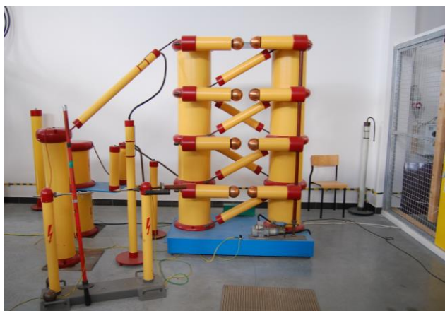
Rys. 3. Elementy stanowiska w laboratorium techniki wysokich napięć

Katedra Energoelektroniki i Napędów Elektrycznych jest jedną z najstarszych na Wydziale Elektrycznym. Działalność naukowa katedry koncentruje się wokół prac z zakresu elektroniki przemysłowej, maszyn elektrycznych, automatyki oraz nowoczesnych technik informatycznych stosowanych w układach sterowania napędami elektrycznymi. Dorobek naukowy pracowników katedry znajduje potwierdzenie w opracowanych konstrukcjach układów przekształtnikowych i napędowych. W toku realizowanych prac zostały sformułowane oryginalne metody sterowania systemów energoelektronicznych i napędowych, bazujące na wykorzystaniu metod analizy wektorowej, algorytmów logiki rozmytej oraz sieci neuronowych.