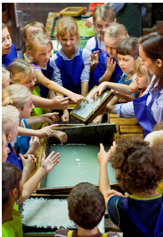
Fot. 4 Czerpanie papieru wg dawnej techniki na zajęciach edukacyjnych