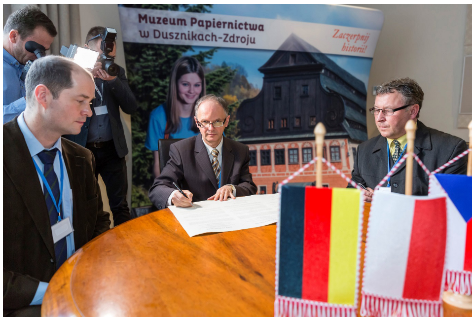
Fot. 5 Podpisanie porozumienia o współpracy pomiędzy przedstawicielami młynów papierniczych z Polski, Czech i Niemiec