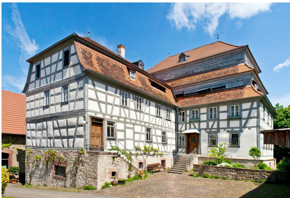
Fot. 7 Papiernia w Homburgu, fot. Oliver Wieser