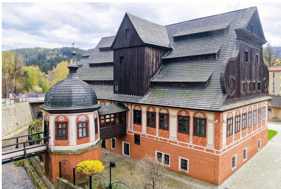
Fot. 1 Młyn papierniczy w Dusznikach-Zdroju