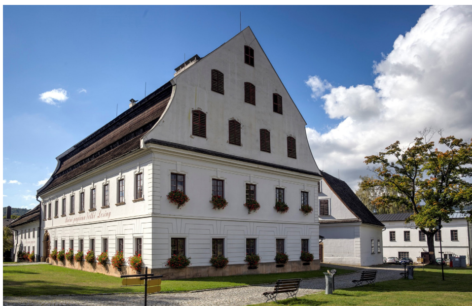
Fot. 6 Papiernia w Velkích Losinách