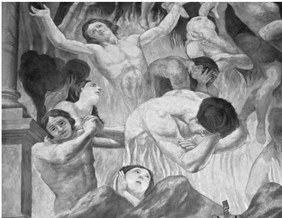
Fot. 6. Węgrów, kościół kolegiacki NMP, malowidła Pallonego na południowej ścianie nawy. Przykład zniszczenia zabytku i obniżenia wartości całego kościoła po niewłaściwie przeprowadzonych pracach konserwatorskich. Fot. 2010.

być bardzo utrudniona. Obecnie brak jest jasnych wytycznych dotyczących finansowych i prawnych procedur związanych z postępowaniem konserwatorskim zależnie od podziału na klasy lub kategorie. Procedury, które gwarantują rzeczywistą ochronę zabytku zostały opracowane tylko wobec obiektów wpisanych do rejestru. W takich zabytkach ochroną prawną objęte są zarówno bryła architektoniczna jak i wnętrza. W pozostałych przypadkach zabytki ujęte w gminnej ewidencji podlegają ochronie jedynie jeśli forma ich ochrony zostanie uwzględniona w miejscowym planie zagospodarowania przestrzennego 16 . Zmiany, jakie można wprowadzić w zabytkach wpisanych do ewidencji opierają się na uzyskaniu decyzji o warunkach zabudowy, które mają gwarantować zachowanie ładu przestrzennego związanego ze sposobem użytkowania budynku oraz z zagospodarowaniem terenu (np. linia zabudowy, szerokość i wysokość elewacji frontowej, geometria dachu) 17 .