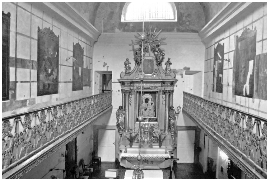
Fot. 3. Warszawa, ul. Krakowskie Przedmieście, kaplica w zespole Res Sacra Miser. Odkrytki pasowe ujawniające nieznane wcześniej polichromie ścienne, co znacząco podnosi wartość budowli. Fot. 2012.

się w gminnej ewidencji 11 oraz wpisane na Światową Listę Dziedzictwa Kulturowego 12 . Wymienione formy ochrony prawnej determinują procedurę postępowania administracyjnego. Obiekty uznane za cenne są ściśle chronione prawem przez wpis do rejestru zabytków, a konsekwencją tego jest ochrona zarówno substancji zabytkowej, formy architektonicznej i wnętrza. Za mniej wartościowe uważane są zabytki nieruchome, znajdujące się w gminnej ewidencji. Gminna ewidencja zabytków jest podstawą do sporządzania programów opieki nad zabytkami 13 , a ochrona tej grupy zabytków jest uwzględniana w studium uwarunkowań i kierunków zagospodarowania przestrzennego gminy oraz w miejscowym planie zagospodarowania przestrzennego oraz o podczas ustalenia lokalizacji inwestycji celu publicznego 14 . Konsekwencją tego jest ochrona zewnętrznej bryły i historycznego wyglądu budynków wpisanych do gminnej ewidencji zabytków, natomiast dozwolone jest znaczne przekształcenie wnętrza. Zakres dopuszczalnych zmian, a więc zakresu prac konserwatorskich jest zależny tylko od formy ochrony prawnej zabytku. Stopień autentyzmu substancji zabytkowej i wartości historyczne artystyczne i naukowe schodzą na dalszy plan, a ich poszanowanie zależy tylko od świadomości właściciela.