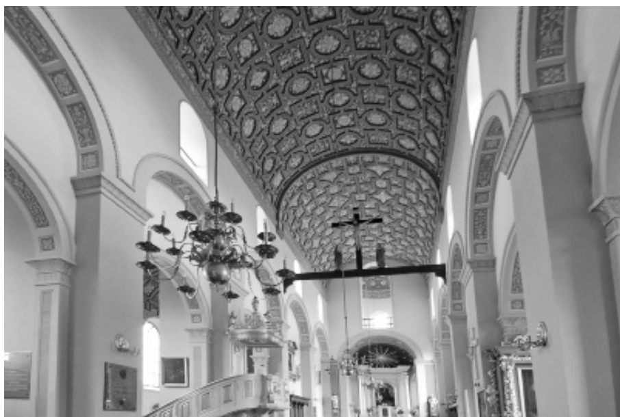
Fot. 1. Brochów, kościół św. Jana Chrzciciela i św. Rocha, sklepienie. Rekonstrukcja polichromie na sklepieniu w 2010 r, znacząco podniosła wartość całego kościoła. Fot. 2010.

i robót budowlanych oraz omówiono zależność prowadzonych prac konserwatorskich od typu zabytku. Następnie zwrócono uwagę na wpływ wyników prac i nawarstwień konserwatorskich na ocenę wartości zabytkowej. Ostatnim analizowanym zagadnieniem był problem czy należy chronić lub usuwać nawarstwienia z wcześniejszych prac konserwatorskich. Stanowiło to podstawę do wysunięcia postulatów odnoszących się do wpływu wyników prac i nawarstwień konserwatorskich na ocenę wartości zabytkowej i na działania urzędów konserwatorskich nadzorujących te prace.