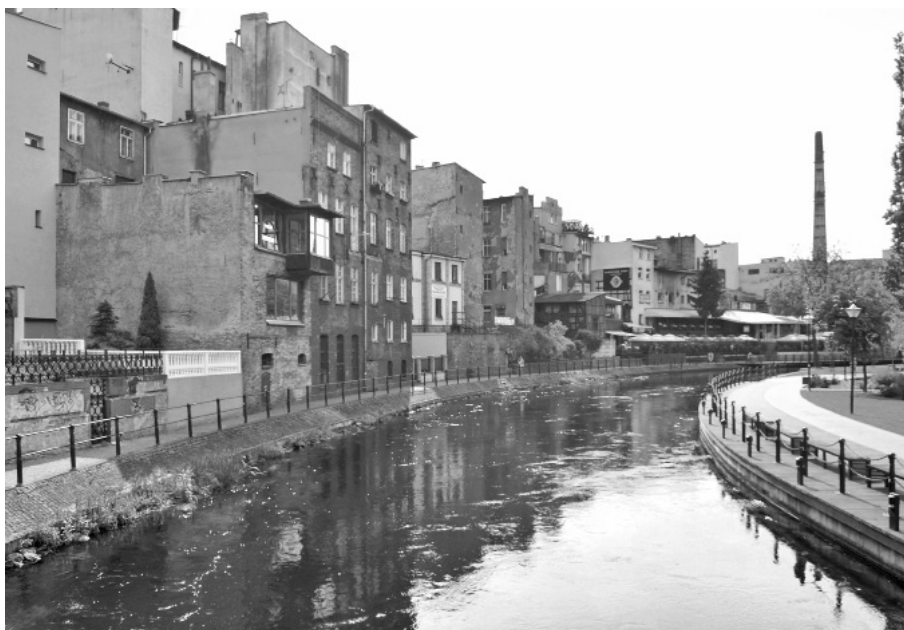
Fot. 7. Bydgoszcz, otoczenie Wyspy Młyńskiej, przykład wzrostu wartości zabudowy na skutek przemysłowego uporządkowania i rewitalizacji otoczenia. Fot. 2016.

może całkowicie zdegradować dotychczasową wartość zabytku. Przykładem takiego postępowania było wpisanie do rejestru zabytków Sali Kongresowej w Warszawie będącej częścią Pałacu Kultury i Nauki, co nastąpiło przed rozpoczęciem prac remontowych i adaptacyjnych. Wpis do rejestru miał miejsce w 2007 roku przed rozpoczęciem prac remontowych i modernizacyjnych, których zakres uległ znaczącej modyfikacji po uznaniu budynku za zabytek. Dzięki temu nawet bardzo ingerencyjne prace jak wymiana wewnętrznych okładzin, aby zwiększyć bezpieczeństwo przeciwpożarowe, czy też wymiana foteli dla publiczności, nie zmieniły wyglądu sali. Nowe elementy były możliwie najbardziej zbliżone wyglądem do oryginalnych. Bez objęcia wpisem do rejestru takie działania zostałyby uznane za niepotrzebne i nieekonomiczne. Autentyzm substancji zabytkowej zachowanej do naszych czasów czy też ranga budowli ma niewielkie znaczenie podczas prac remontowych i modernizacyjnych, jeśli nie idzie za tym ochrona prawna. Jest ona potwierdzeniem wartości zabytku. Podobny przykład dotyczył postępowania podczas translokacji „domu kołodzieja” (1822 r.) ze wsi Wigancice Żytawskie (woj. lubuskie). Zanim budynek przeniesiono w okolice Zgorzelca, co zostało zakończone w 2005 roku, wcześniej został on wpisany do rejestru zabytków (w 2001 roku), a po zakończeniu wszystkich prac do rejestru zabytków wpisano także otoczenie zabytku (2009 r.).