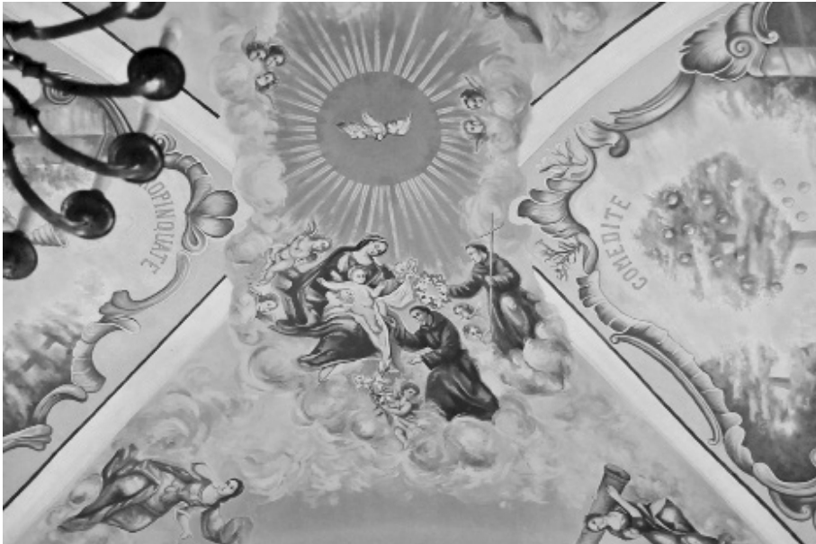
Fot. 5. Ostrołęka, kościół św. Antoniego, polichromie na sklepieniu po rekonstrukcji i częściowej konserwacji. Przykład obniżenia wartości zabytku po niewłaściwie przeprowadzonych pracach konserwatorskich. Fot. 2010.

Tylko w zabytkach wpisanych do rejestru obowiązkowo są prowadzone badania konserwatorskie przed rozpoczęciem prac. Odkrycia nieznanych elementów zabytku podczas badań przygotowawczych z reguły znajdują swoją kontynuację podczas prac restauratorskich, a odnalezione fragmenty są odsłaniane i konserwowane. Prace konserwatorskie mogą ujawnić elementy, które wpływają na zmianę oceny rangi i wartości zabytku. Mogą zostać ujawnione wcześniejsze warstwy chronologiczne jak np. odkrycie i odsłonięcie warstw historycznych – średniowiecznych malowideł ściennych ukrytych pod pobiałami, nieznanego detalu architektonicznego ukrytego pod tynkiem podczas przemurowania ścian czy też oryginalnej kolorystyki. Wszystkie te elementy zawsze podnoszą wartość zabytku.