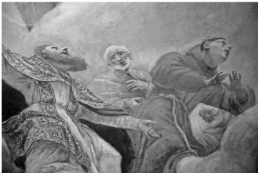
Fot. 2. Węgrów, kościół reformatów, malowidła Palloniego na sklepieniu kopuły. Zabytek w pełni autentyczny i niepoddany żadnym późniejszym przemalowaniom, co znacząco podnosi jego wartość. Fot. 2016.

wartości artystycznych i estetycznych zabytku, w tym, jeżeli istnieje taka potrzeba, uzupełnienie lub odtworzenie jego części, oraz dokumentowanie tych działań; 8) roboty budowlane – roboty budowlane w rozumieniu przepisów Prawa budowlanego, podejmowane przy zabytku lub w otoczeniu zabytku” 2 . Jednakże często nawet roboty budowlane podejmowane w zabytku są potocznie postrzegane jako prace konserwatorskie. Zgody urzędu konserwatorskiego wymagają także prace o mniejszym zakresie – jak np. wykonanie nowej kolorystyki budynku wpisanego do rejestru zabytków, gdyż jest to „podejmowanie innych działań, które mogłyby prowadzić do naruszenia substancji lub zmiany wyglądu zabytku pisanego do rejestru” 3 . Ale jednocześnie NSA potwierdza możliwość stosowania art. 36 ust. 1 Ustawy o ochronie zabytków i opiece nad zabytkami z dnia 23 lipca 2003 r. do obiektów niewpisanych indywidualnie do rejestru, ale objętych wpisem obszarowym. 4 Efekty wszelkich prac przy zabytkach zmieniają i poprawiają nie tylko ich stan techniczny i trwałość, ale w istotny sposób wpływają na sposób odbioru ich wartości zabytkowych.