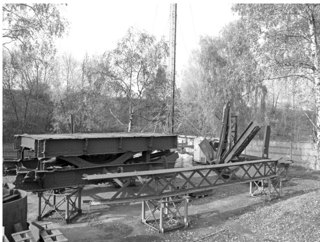
Ryc. 3 Wydobyte fragmenty warszawskich mostów po zabezpieczeniu antykorozyjnym

Wydobyte fragmenty najstarszych stałych mostów w Warszawie powinny być utrwalone dla przyszłych pokoleń. Chociaż nikt nie nazywa tych „okruczości historii” zabytkami, to jest pełna zgoda na to, by je zachować (ryc. 3).