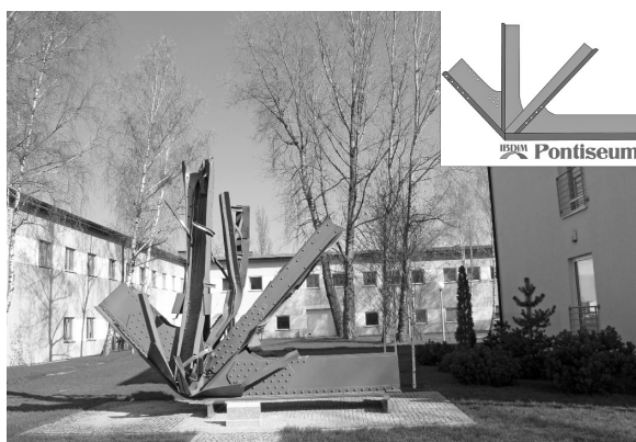
Ryc. 1 Fragment Mostu kolejowego pod Cytadelą na terenie IBDiM oraz logo Pontiseum

W 2014 r. na terenie Instytutu Badawczego Dróg i Mostów w Warszawie (IBDiM) zostało uroczystie otwarte pierwsze na świecie PONTISEUM. Jego nazwę utworzono od włoskiego słowa ponti czyli mosty, analogicznie do słowa muzeum, które jest miejscem poświęconym muzom. PONTISEUM to miejsce poświęcone mostom (ryc. 1), których duże gabaryty uniemożliwiają utworzenie „klasycznego muzeum” mostów, stąd są ekspozowane jak pomniki na wolnym powietrzu.