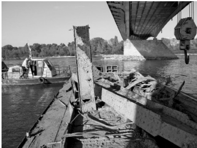
Ryc. 2 Prace poszukiwawcze fragmentów historycznych mostów Warszawy

Trwające prace poszukiwawcze historycznych mostów Warszawy (ryc. 2) wzbudzają ogromne, bardzo życzliwe zainteresowanie wśród Warszawiaków, ale także głośniejsze negatywnie zaniepokojone. Między innymi Minister Kultury i Dziedzictwa Narodowego (w lipcu 2012 r.) wyjaśnia Komitetowi Upamiętnienia Ofiar Obozu Zagłady Konzentrationslager Warschau, że odnalezione “resztki przedwojennej konstrukcji Mostu Poniatowskiego to nie jest ‘ostatnia już w Warszawie ruina pozostała w wyniku napaści Niemiec hitlerowskich na Polskę w 1939 r.’, jak to określa Komitet”.