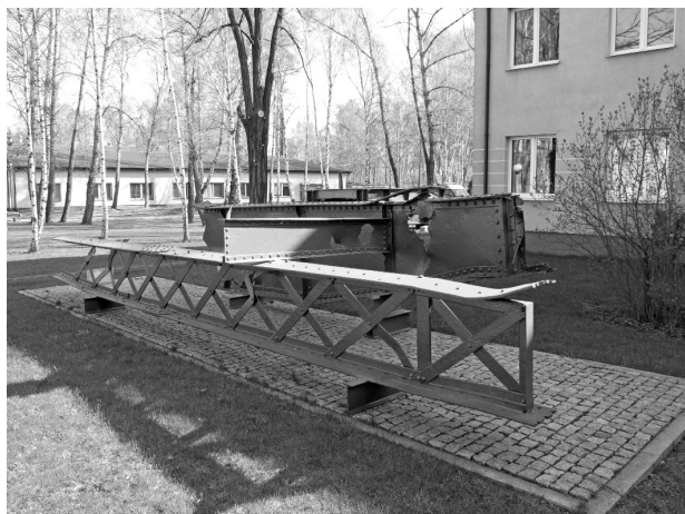
Ryc. 5 Fragmenty Mostu Kierbedzia eksponowane na terenie IBDiM

Część wydobytych z dna Wisły fragmentów mostów, ze względu na nieudane próby pozyskania funduszy na ich badania i konserwację (wnioski do Ministra Nauki i Szkolnictwa Wyższego, Narodowego Centrum Nauki), została zabezpieczona antykorozyjnie sposobem gospodarczym w Instytucie Badawczym Dróg i Mostów i wyeksponowana w Pontiseum (ryc. 5).