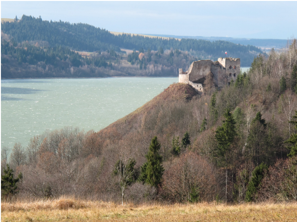
Ryc. 7 Czorzstyn - ruina w krajobrazie, niezmiennie od XIX wieku cel wycieczek i atrakcja widokowa

informacji publicznej, mediów, edukacji i popularyzacji. Na pewno pożyteczny byłby „publiczny bank dobrych praktyk konserwatorskich” 27 . Tylko odwrócenie negatywnego postrzegania ruiny przez lokalne społeczności, samorządy i inwestorów może skutecznie odwrócić obecne niekorzystne tendencje rekonstruktorskie. Jest to jedna z tych sytuacji, gdy skuteczna ochrona konkretnego typu budowli zabytkowej (w tym wypadku ruiny zabytkowej) wymaga działań spoza klasycznego zestawu działań konserwatorskich. Wymaga wyjścia w stronę społeczności, interesariuszy, lokalnych liderów. Wymaga działań z zakresu komunikacji społecznej. Wymaga poszerzenia pojęcia "ochrona zabytków" w sferze świadomości społecznej. Ograniczanie się do stosowania prawa w obronie materii zabytkowej właściwe dla obowiązującego wciąż systemu ochrony zabytków w Polsce okazuje się być niewystarczające. Dla skutecznej realizacji wskazań doktrynalnych w konserwatorstwie konieczne okazuje się przekroczenie tradycyjnych ram dyscypliny, ponowne „uspołecznienie” ochrony zabytków, szczególnie w sferze pojmowania celu działania i związanego z nim interesu społecznego 28 . To duże wyzwanie dla specjalistów z zakresu ochrony dóbr kultury, którzy nie tylko powinni dogłębnie poznawać doktryny konserwatorskie, rozumieć istotę zabytku, ale także zaznajamiać się z technikami informacyjnymi, edukacyjnymi i negocjacyjnymi, by móc mieć wpływ na podejmowane decyzje o losach kolejnych zabytków, w tym szczególnie ruin historycznych .