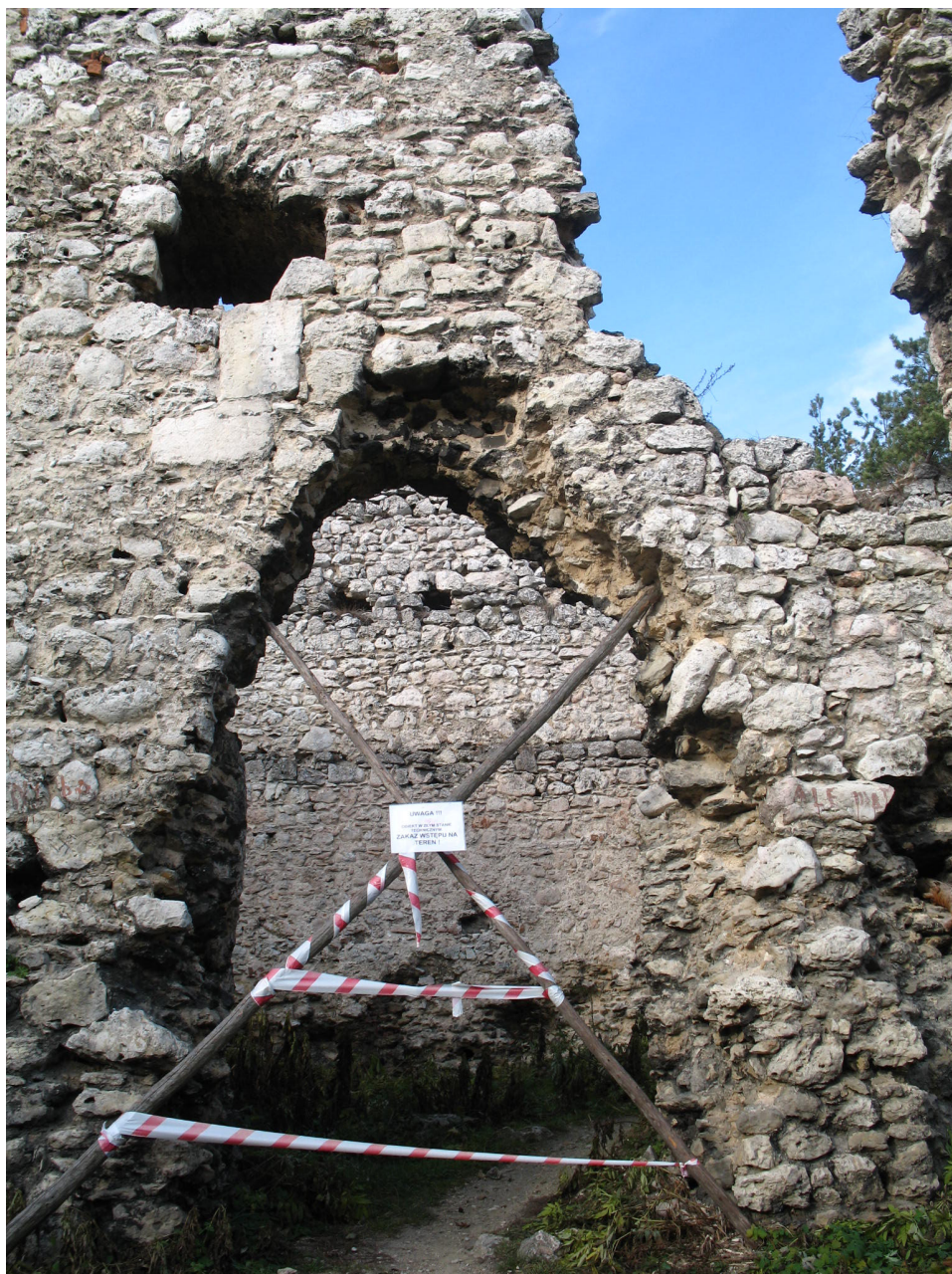
Ryc. 5 Bydlin, fragment ruin zamku – przez gospodarzy terenu postrzeganych jako zagrożenie bezpieczeństwa

Jakie są przyczyny takich postaw społecznych? Odpowiedź na to pytanie może być bardziej skuteczną bronią z nadmiarem rekonstrukcji, niż gromkie oburzenie, czy zapory prawne. Analiza tekstów publicystycznych, wypowiedzi prasowych i okoliczności licznych rekonstrukcji zamkowych wskazuje pewne tropy. Polska jest krajem mocno dotkniętym doświadczeniami