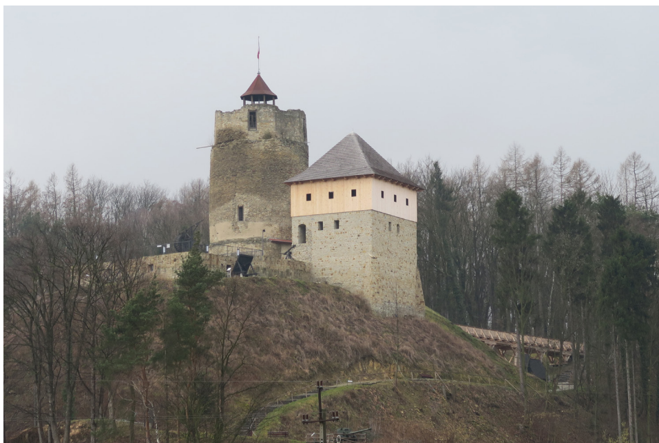
Ryc. 4 Czchów – podwojenie kubatury zamku w wyniku rekonstrukcji inicjowanej przez samorząd