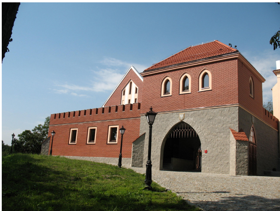
Ryc. 3 Gostynin – fantazyjna odbudowa zamku z inicjatywy samorządu, fot. A. Siwek

czy wręcz budowa nowej bryły, w miejsce dotychczasowej historycznej ruiny są oczekiwane. W przestrzeni publicznej w Polsce pojawił się nawet postulat masowej odbudowy zamków z XIV wieku, z czasów kazimierzowskich, jako symbolu historycznej ciągłości i potęgi kraju 16 . Ruina jest postrzegana jako budowla niekompletna, nieużyteczna i estetycznie wątpliwa. Samorządy, gospodarze terenu, społecznicy, prześcigają się w formułowaniu programów użytkowych dla ruin, a odbudowę całej lub części kubatury stawiając jako cel swego działania. Względy doktrynalne nie są brane pod uwagę. Można się obawiać, że nie są w ogóle znane i poważane. Liczy się gospodarska troska o mienie. Celem jest wygospodarowanie przestrzeni użytkowej, w której będzie można zarabiać, bądź przynajmniej organizować imprezy. Odbudowa jest kojarzona pozytywnie 17 . Utrata wartości historycznych i naukowych nie jest postrzegana jako ważna przeszkoda. Pojawia się napięcie między pełnym dobrych chęci inicjatorem odbudowy, a pełnym wątpliwości konserwatorem zabytków. Jak te napięcia się kończą, ukazują nam liczne przykłady zaawansowanych rekonstrukcji i fantazyjnych kreacji zamkowych w całej Polsce. Konserwator zabytków i doktryna zazwyczaj ulegają naporowi dążeń rekonstrukcyjnych 18 . (Ryc. 4)