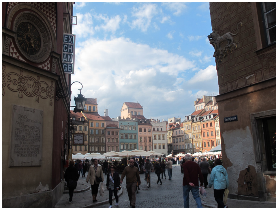
Ryc. 6 Warszawa, Stare Miasto – przykład odbudowy w szczególnych okolicznościach

W wyniku takich procesów historycznych w świadomości społecznej zatarła się różnica między ruiną współczesną, budowlą zniszczoną w dramatycznych okolicznościach wojny, czy katastrofy, a ruiną historyczną, która trwała w tej postaci całe stulecie. Hasło odbudowy zakorzeniło się jako pozytywne i twórcze. Można powiedzieć, że doktryna konserwatorska i świadomość wartości ruiny historycznej przegrała w szerokiej opinii publicznej z potrzebą chwili i propagandową wizją świata. Stąd pozytywne skojarzenie z „budowaniem zabytków”, stąd słaba pozycja zwolenników ruskinowskiej ochrony ruin, jako malowniczych dzieł historii zawieszonych w krajobrazie i prawach natury.