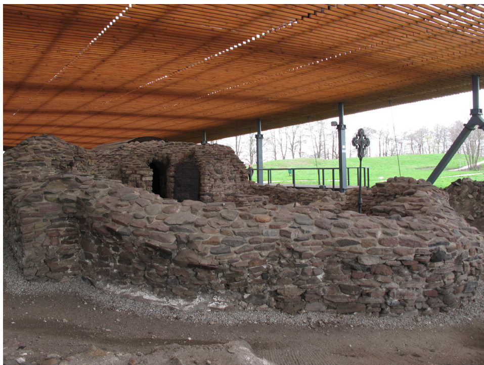
Ryc. 2 Ostrów Lednicki – świadectwo historii - ruiny związane z początkiem państwowości polskiej

W ujęciu doktrynalnym ruina jest postrzegana jako pełnoprawny zabytek, o autonomicznych wartościach 9 . Z tradycji romantycznej dziedziczymy pozytywną ocenę estetyczną ruiny oraz refleksyjny stosunek do jej postaci. Można powiedzieć nawet, że źródła szacunku dla ruin są głębsze. Wynikają z istoty kultury śródziemnomorskiej, wyrastającej na ruinach cywilizacji Grecji i Rzymu. Przecież już w antycznym Rzymie znajdujemy przykłady docenienia nadwyreżonych przez czas budowli Grecji, np. w listach Pliniusza w pierwszym wieku naszej ery 10 . Kolejne odłony renesansu i klasycyzmu nie byłyby możliwe bez zapatrzenia w piękno i potęgę ruin antycznych. Zatem bez obaw możemy stwierdzać, że pozytywne postrzeganie ruin ma długą tradycję kulturową i jest potwierdzane przez rozwój doktryny konserwatorskiej. Mimo to, problematyka ochrony i postępowania z zbytkami określanymi mianem „trwałej ruiny” to nadal jeden z wiodących tematów toczącej się konserwatorskiej dyskusji doktrynalnej. Na gruncie polskim skalę i zakres tematyczny dyskusji określa seria publikacji Polskiego Komitetu Narodowego ICOMOS 11 . Istotną rolę w tej dyskusji odgrywa stosunek do ruin historycznych zamków