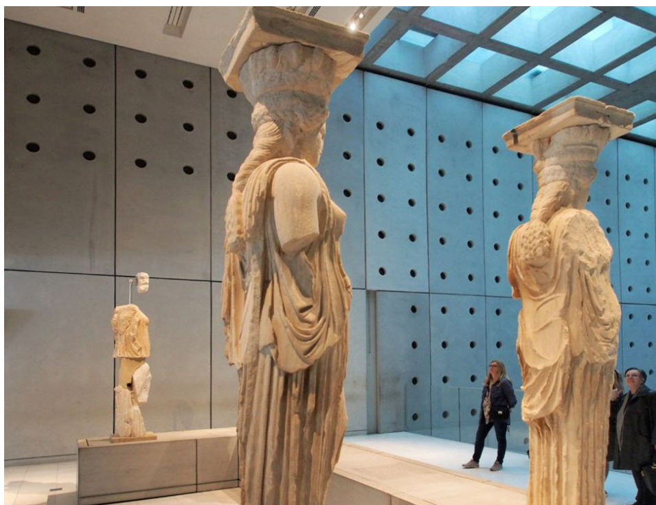
Ryc. 1 Muzeum Partenonu https://pedeka.pl/zwiedzanie-aten/

W postanowieniach konferencji w Atenach, zwołanej przez Międzynarodowe Biuro Muzeów 1931 roku, czyli w tzw. Karcie Ateńskiej przedstawiono konkluzje ogólne dotyczące spraw, które były przedmiotem obrad, w tym omawiano: doktryny i ich ogólne zasady, zarządzanie i ustawodawstwo dotyczące zabytków, uwypuklenie wartości zabytków, materiały stosowane do restauracji, zagrożenia zabytków, techniki konserwacji, współpracę międzynarodową w dziedzinie ochrony zabytków w tym w dziedzinie techniki i problemów etycznych oraz roli wychowania w poszanowaniu zabytków i przydatność dokumentacji międzynarodowej.