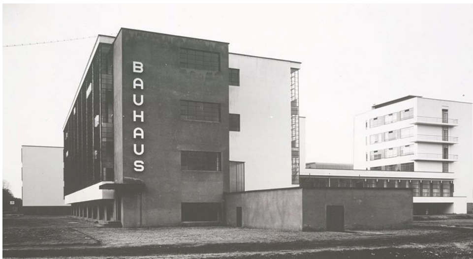
Ryc. 6 Budynek nowej szkoły Bauhausu, https://www.designalive.pl/bauhaus-nowa-szkola/#&gid=1&pid=2

Nowy Europejski Bauhaus (NEB) 14 to europejska interdyscyplinarna inicjatywa podjęta przez kraje Wspólnoty Europejskiej w kontekście dbałości o dziedzictwo kulturowe. Wiąże się ona z refleksją nad sposobem i możliwościami ochrony dziedzictwa materialnego i niematerialnego w zderzeniu z działaniami proekologicznymi i dążeniem do osiągnięcia neutralności klimatycznej w Europie do 2025 roku. Inicjatywa NEB zaistniała w 2020 roku w dużej mierze w niezależnie od międzynarodowego środowiska konserwatorskiego i wyrosła w oparciu o ideę proekologicznego Europejskiego Zielonego Ładu (EZŁ) oraz postawy państw europejskich dla kreacji polityki kulturalnej czyli BAUKULTUR. Przedstawiana jest przy tym jako pomost z ekologii i nauki do świata kultury i sztuki, z holistycznym podejściem do środowiska zbudowanego oraz jako praktyczna realizacja założeń EZŁ w przestrzeni mieszkalnej. Przewidziano trzy fazy wprowadzenia i rozwijania NEB: