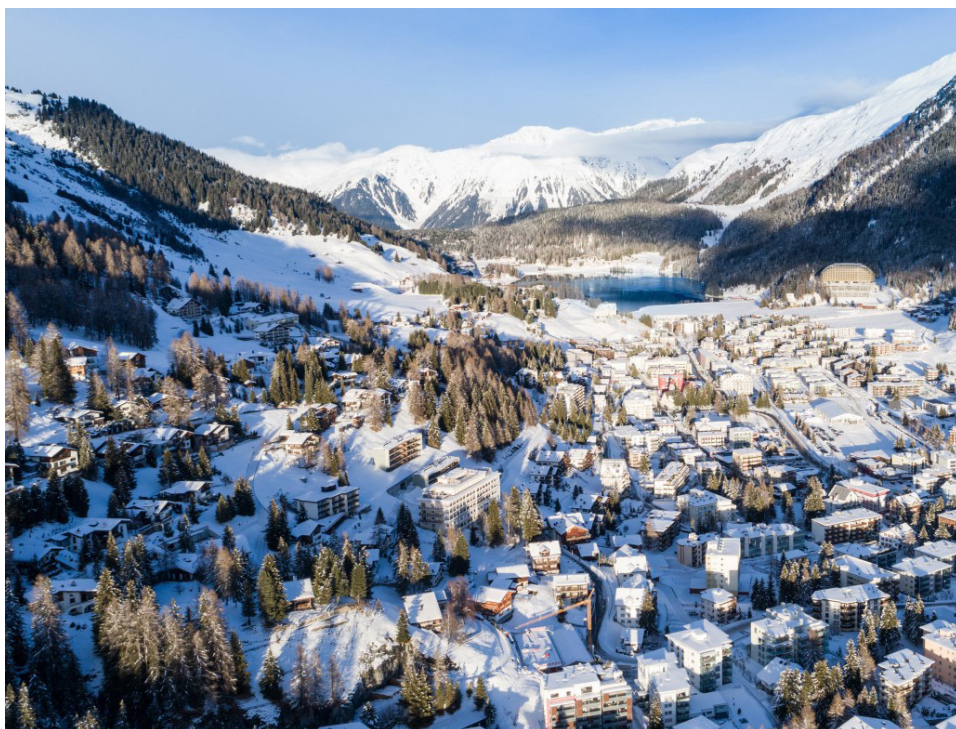
Ryc. 5 Panorama Davos

Deklaracja z Davos „Ku wysokiej jakości Baukultur dla Europy” została podpisana na konferencji Ministrów Kultury z krajów Unii Europejskiej (Davos, Szwajcaria, 20-22 stycznia 2018 roku) 13 . W jej Preambule zapisano min.: „My, Ministrowie Kultury i szefowie delegacji sygnatariuszy Europejskiej Konwencji Kulturalnej oraz państw-obszerników Rady Europy, a także przedstawiciele UNESCO, ICCROM-u, Rady Europy i Komisji Europejskiej oraz Rady Architektów Europy, Europejskiej Rady Planistów Przestrzennych, ICOMOS-u oraz Europa Nostra (...)”: