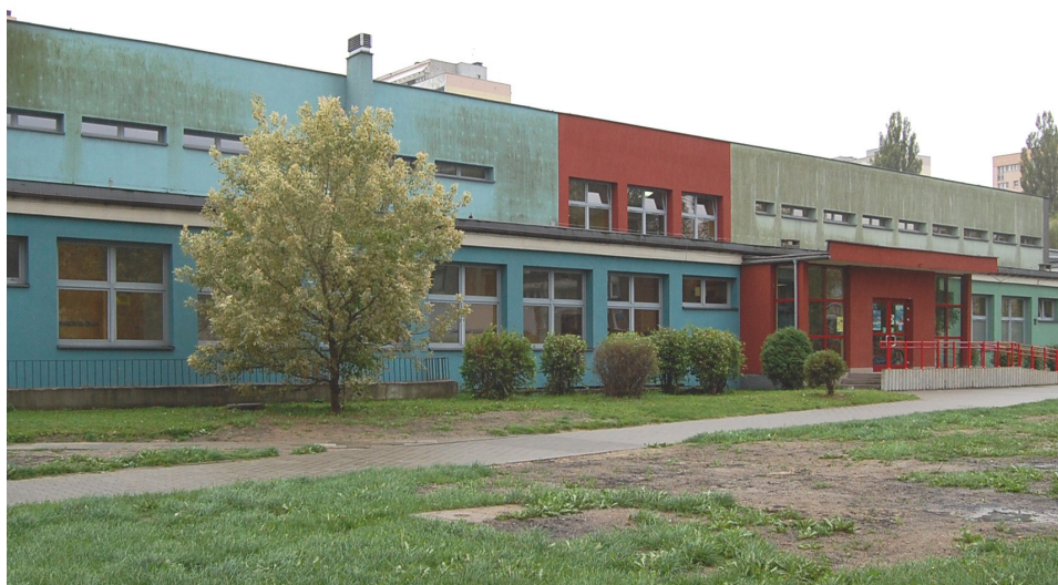
Ryc. 7 Szkoła podstawowa na osiedlu D3 w Tychach, po termorenowacji.

Realizacja neutralności klimatycznej w Europie do 2050 roku, jako głównego celu strategii EZŁ wymaga transformacji społeczno - gospodarczej w Europie postrzeganej jako racjonalna kosztowo, sprawiedliwa i zrównoważona społecznie. Niestety dziedzictwo kulturowe materialne i niematerialne, krajobraz kulturowy, zabytki, ochrona i opieka, krajobraz miejski, architektura i urbanistyka nie znalazły swojego miejsca w EZŁ i jego priorytetach. W związku z tym bezpośrednio lub pośrednio wynikają z tego konsekwencje i zagrożenia dla zabytków i dziedzictwa. Już widoczne dotyczą, między innymi: termoizolacji, fotowoltaiki, urządzeń klimatyzacji i teletechniki, urządzeń związanych z cyfryzacją i teletechniką, energii wiatrowej oraz oszczędności materiałowej i ekonomii zamkniętego obiegu.