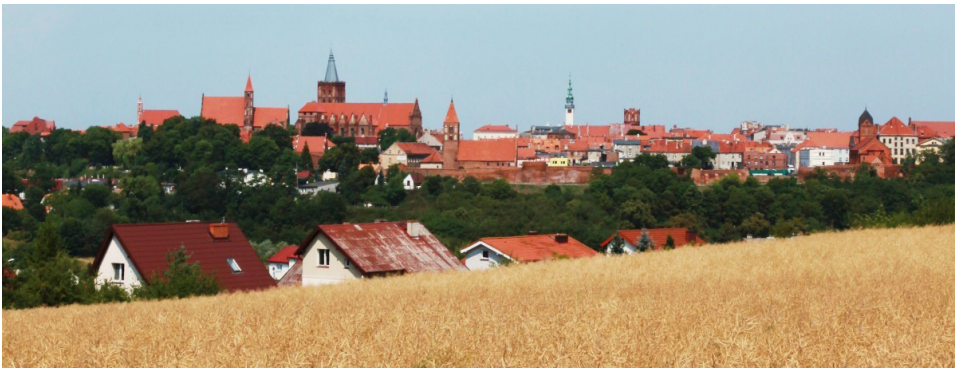
Ryc. 2 Panorama Chełmna,

https://www.globtroter.pl/zdjecia/222981,polska,chelmno,pole,rzepakowe,panorama.html