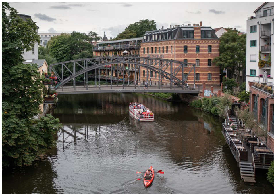
Ryc. 3 Lipsk, Könnernitzbrücke nad rzeką – Biała Elstera https://kolemsietoczy.pl/lipsk-nowe-pojezierze-ciekawe-miejsca-trasy-co-zobaczyc/

Dla dziedzictwa dotyczącego miast i ich okolic ważna jest Karta Lipska 6 z 2007 roku i Nowa Karta Lipska 7 z 2020 roku. Zawarte w nich uzgodnienia, inicjatywy i zapisy związane są całościowo z obszarami miejskimi i z akcentowaniem zrównoważonego rozwoju i transformacji miast.