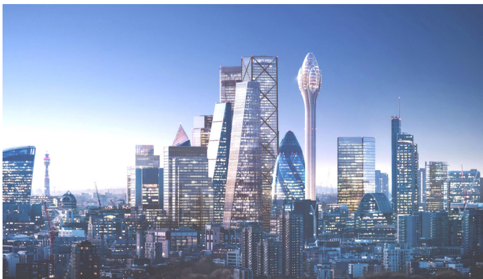
Ryc. 4 Panorama Londynu, https://www.bryla.pl/bryla/7,85298,24194252,londynski-tulipan-od-foster-partners.html

We współczesnym, dynamicznym i zglobalizowanym świecie obserwujemy dość często utratę znaczenia sztywnych doktryn, w miejsce których pojawiają się inicjatywy przynoszące nowe teorie, idee i priorytety mówiące również o zrównoważonym rozwoju i dobrej kontynuacji. Pojmowane są one przy tym nierzadko w sposób nieco odmienny niż miało to miejsce dotychczas, w środowisku związanym z zabytkowością i dziedzictwem kulturowym i krajobrazowym. Można by zatem zaryzykować jeszcze dyskusyjny pogląd, że mnogość i fragmentacja doktryn oraz różnych Kart i Konwencji konserwatorskich stała się ich naturalnym wrogiem.