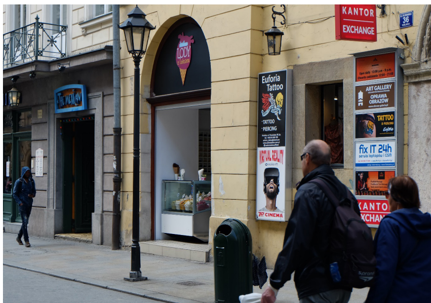
Il. 6. Zmiany, jakie nastąpiły po wprowadzeniu uchwały – ul. Floriańska około 2016 r. (zasoby UMK)