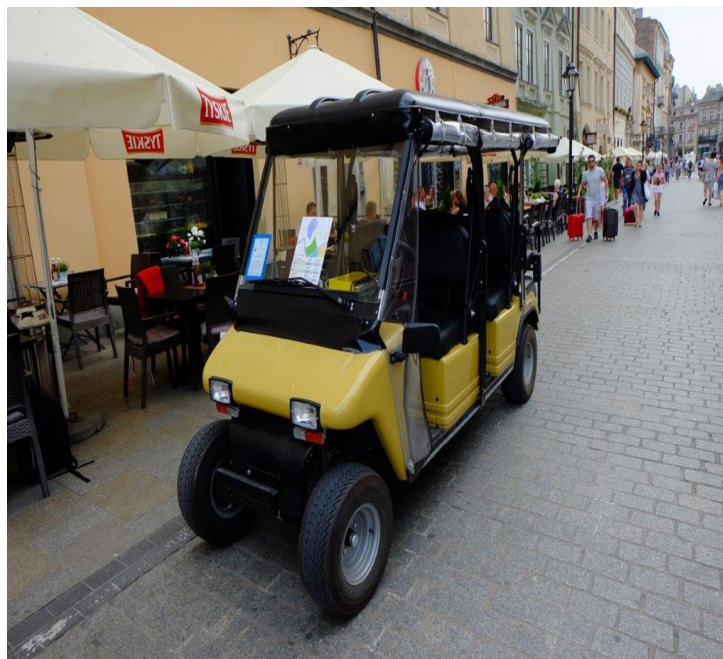
Il. 4. Przykładowy wygląd pojazdu wolnobieżnego obecnie