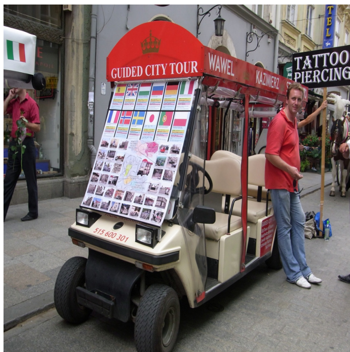
Il. 3. Przykładowy wygląd pojazdu wolnobieżnego przed wprowadzeniem regulacji w uchwale w sprawie utworzenia Parku Kulturowego (zasoby UMK)