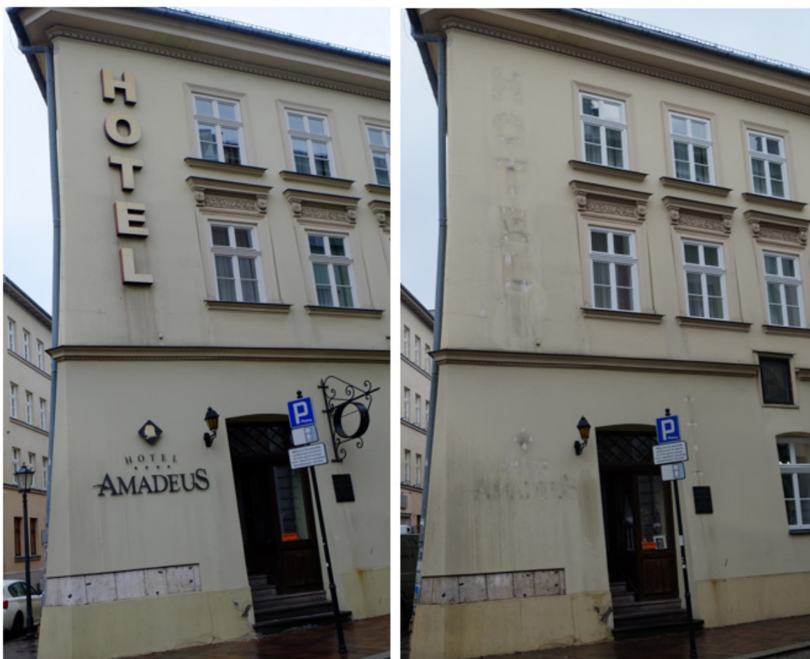
Il. 7. Zmiany, jakie zaszły na elewacji kamienicy przy ul. Mikołajskiej (usunięcie zmultiplikowanych nośników reklamowych – szyldów)

Najbardziej znaczącym krokiem zmierzającym do uporządkowania przestrzeni publicznej było jednak wprowadzenie restrykcyjnych zasad, które pozwalają przedsiębiorcom na instalowanie nie więcej niż 1 nośnika reklamowego stanowiącego szyld w rozumieniu upzp (il. 7), a także ograniczają jego gabaryty (il. 8 i 9). Udało się również w znacznym stopniu uporządkować przestrzeń publiczną, co bardzo dobrze widać przede wszystkim na elewacjach zabytkowych budynków.