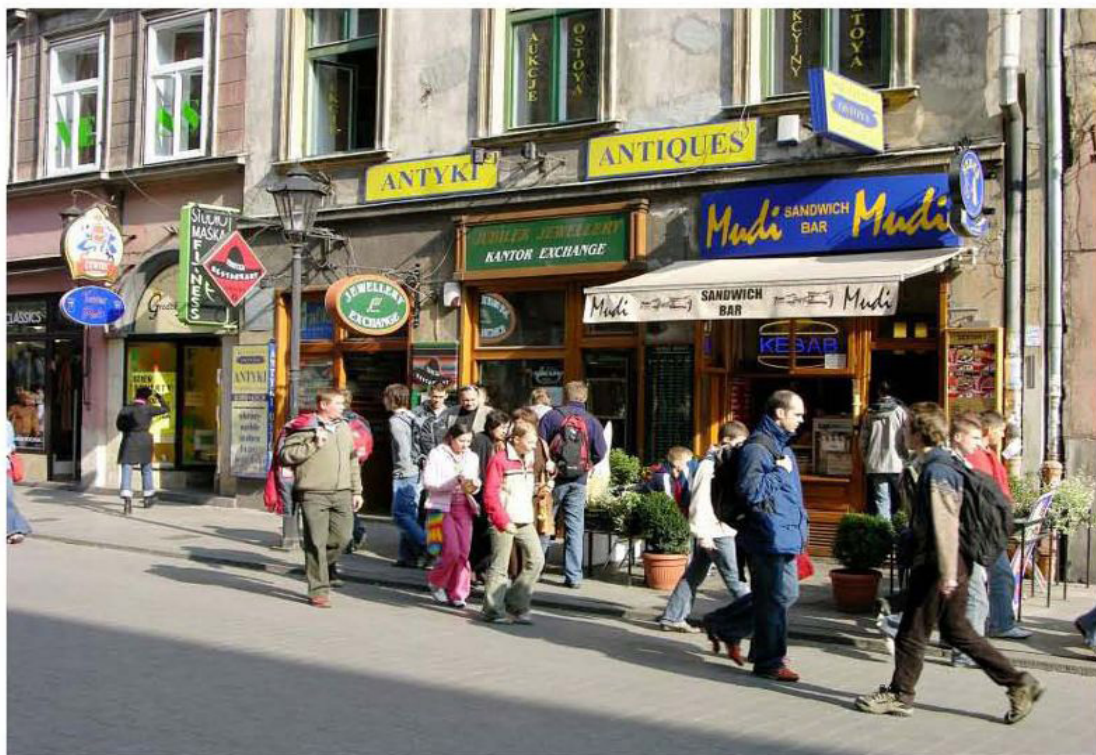
Il. 2. Chaos reklamowy na ul. Grodzkiej – około 2006 r. (zasoby UMK)

na jego charakter, związany głównie z obsługą ruchu turystycznego (niewielka liczba stałych mieszkańców), zauważalna była nadmiernie rozbudowana działalność handlowa i usługowa, której towarzyszyła ogromna liczba nośników reklamowych, instalowanych na elewacjach zabytkowych budynków, najczęściej bez wymaganych decyzji, opinii czy zgód (il. 2).