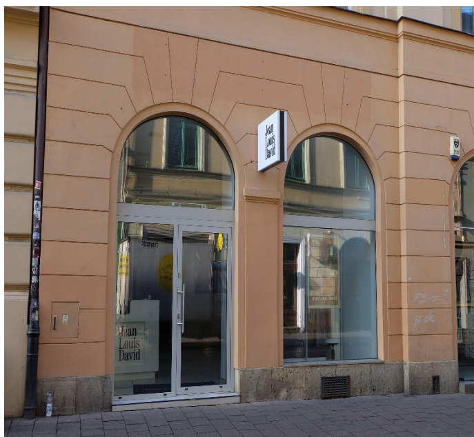
Il. 9. Nośnik reklamowy umieszczony na elewacji kamienicy przy ul. Szewskiej dostosowany do zapisów uchwały