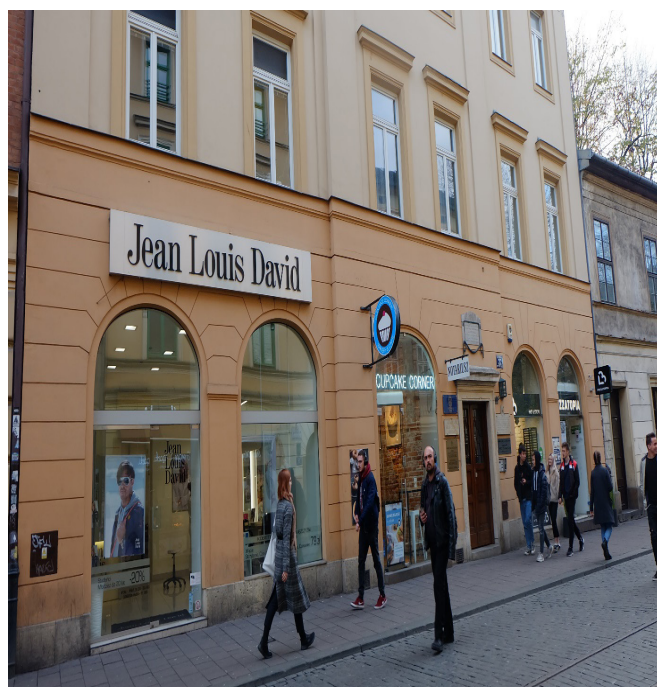
Il. 8. Nośnik reklamowy umieszczony na elewacji kamienicy przy ul. Szewskiej (niezgodny z zapisami uchwały ze względu na zbyt duże gabaryty)