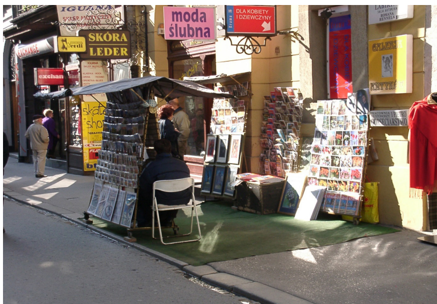
Il. 5. Handel i ekspozycja towaru przed budynkiem – ul. Floriańska przed utworzeniem parku kulturowego

W zapisach uchwały znalazły się również zapisy dotyczące zasad prowadzenia działalności handlowej w przestrzeni publicznej, ograniczające handel obwoźny do konkretnych lokalizacji, ze wskazaniem rodzajów asortymentu, jakim można handlować. Wprowadzono także m.in. zakaz tzw. handlu z ręki i zakaz wystawiania i oferowania do sprzedaży towarów przed budynkami frontowymi oraz na elewacjach tych budynków (il. 5 i 6).