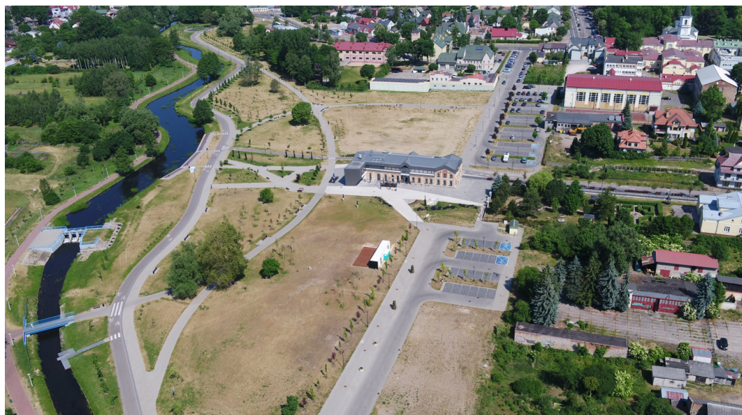
Il. 15. Bulwary nad rzeką Czarną Hańczą i stara łaźnia (fot. Grzegorz Kosiński, czerwiec 2023 r.; ze zbiorów Urzędu Miejskiego w Suwałkach)

odwiedzanym obiektem kultury, edukacji artystycznej, miejscem spotkań dla mieszkańców i działalności organizacji społecznych.