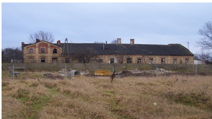
Il. 12. Łaźnia miejska w Suwałkach (fot. Adam Żywiczyński, styczeń 2016 r.)

Łaźnia była własnością prywatną, użytkowaną przez różne podmioty i dowolnie przekształcaną. Mimo że popadła w ruinę, sporządzono dla niej kartę ewidencyjną i włączono ją do wojewódzkiej ewidencji zabytków.