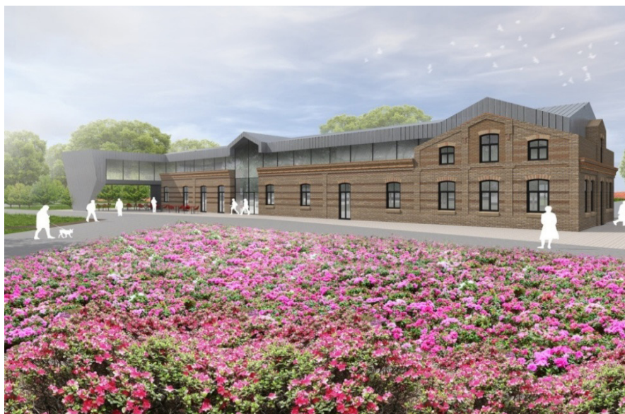
Il. 14. Wizualizacja projektu łaźni, styczeń 2016 r.

Od lipca 2020 roku miasto Suwałki ma nadrzeczne bulwary. Historyczna łaźnia stała się ich reprezentacyjnym elementem i funkcjonuje pod nazwą „Stara Łaźnia” 21 . Jest miejscem wystaw plastycznych (Galeria Stara Łaźnia), a bulwary stały się przestrzenią do organizacji imprez miejskich, gdzie odbywają się np. pokazy filmów w ramach festiwalu „Wajda na nowo” oraz rekreacji w ogóle. Obiekt historyczny został nagrodzony w ogólnopolskim konkursie organizowanym przez Polskie Towarzystwo Mieszkańciew w ramach XX edycji konkursu „Dom 2020”. Galerię Sztuki Stara Łaźnia uznano za najlepszy budynek w kategorii „Remonty, Rewitalizacje i Modernizacje” 22 . Bulwary z dawną łaźnią zostały włączone w organizm miejski i służą społeczeństwu.