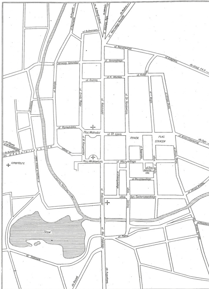
Ryc. 2. Suwałki. Schemat obecnego rozplanowania miasta. Skala 1 : 10 000

Il. 1. Podstawowy układ urbanistyczny miasta Suwałki, plan miasta z 1965 roku wg: W. Trzebiński, Rozwój przestrzenny Suwałk od narodzin osady po okres awansu na miasto wojewódzkie , [w:] Studia i materiały do dziejów Suwalszczyzny , red. J. Antoniewicz, Białystok 1965, ryc. 2.