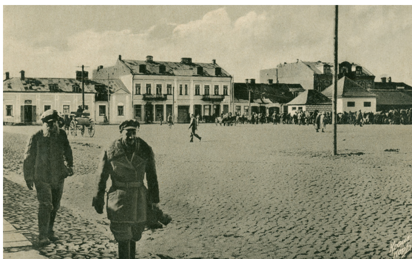
Il. 4. Widok rynku od północnego wschodu (pocztówka z czasów II wojny światowej, napis na oryginale: Suwałki Markt – fotograf i wydawca Fritz Krauskopf, Königsberg; ze zbiorów Urzędu Miejskiego w Suwałkach)

Ulice te z czasem zostały wyasfaltowane. Rynek był placem targowym, na którym Suwałczanie mogli dokonywać zakupów w dni targowe (wtorki i piątki).