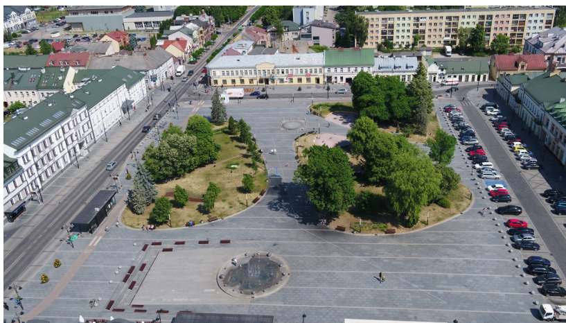
Il. 10. Plac Marii Konopnickiej z lotu ptaka

W oparciu o wybrany projekt konkursowy został opracowany projekt budowlany. Do realizacji nowej formy placu (il. 10) wykorzystano środki z projektu „TRANS-IN-FORM”, środki unijne przewidziane w regionalnym programie operacyjnym (RPO) w perspektywie finansowej 2007–2013, a także środki budżetowe Gminy Miasta Suwałki. W nowej przestrzeni placu, oddanej do użytku 14 maja 2014 roku, umieszczono także nowy, brązowy pomnik Marii Konopnickiej, ponownie autorstwa Bohdana Chmielewskiego, z ławeczką multimedialną i jedną z figurek krasnali zamontowanych na szlaku turystycznym im. Marii Konopnickiej „Krasnoludki są na świecie”.