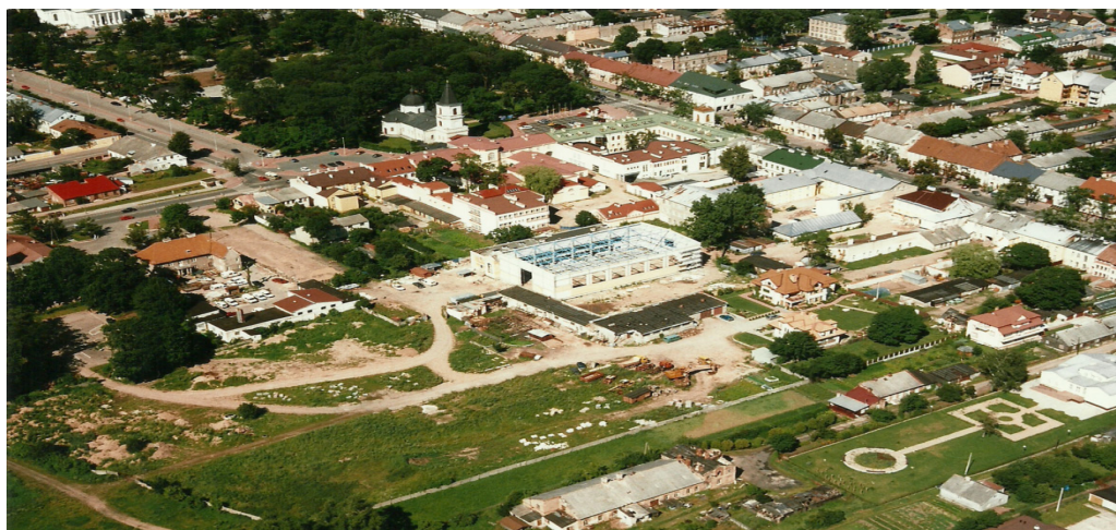
Il. 11. Fragment terenów nadrzecznych

Łaźnia była własnością prywatną, użytkowaną przez różne podmioty i dowolnie przekształcaną. Mimo że popadła w ruinę, sporządzono dla niej kartę ewidencyjną i włączono ją do wojewódzkiej ewidencji zabytków.