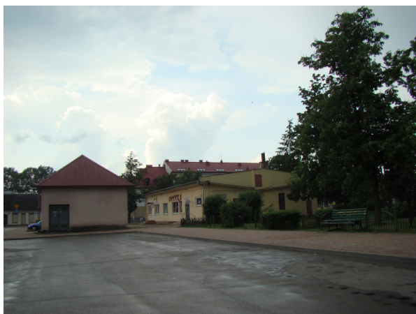
Il. 7. Pawilon handlowy i stacja trafo w parku Marii Konopnickiej w Suwałkach (maj 2007 r.)

Z uwagi na małe rozmiary i otoczenie ulicami jego wartość rekreacyjna była jednak wątpliwa. Z czasem rozrosły się drzewa i krzewy, ale również zdekapitalizowały się asfaltowe i betonowe alejki placu oraz asfaltowe nawierzchnie okolicznych ulic. Przestrzeń tę szpeciła poszarzała bryła pawilonu handlowego i zdewastowany szalet. Dawny rynek przestał być miejscem estetycznym. Pierwszy program rewitalizacji przewidywał: „działania rewitalizacyjne – 2. budowa elementów przestrzeni miejskiej dla wytypowanych kwartałów zabudowy – ulice, place, parkingi, urządzenie terenu, w pierwszym etapie na lata 2004–2007, ze środków budżetu miasta i europejskich środków pomocowych, np. Urban, z założeniem kontynuacji działań w drugim etapie na lata 2008–2015” 13 . Miasto dysponowało miejscowym planem zagospodarowania przestrzennego 14 , uzgodnionym z urzędem konserwatorskim. W 2009 roku Miasto Suwałki ogłosiło i rozstrzygnęło pierwszy konkurs na „Koncepcję zagospodarowania przestrzeni publicznej Placu Marii Konopnickiej w Suwałkach” 15 . Był to pierwszy krok na drodze do realizacji założeń planu i ówczesnego programu rewitalizacji.