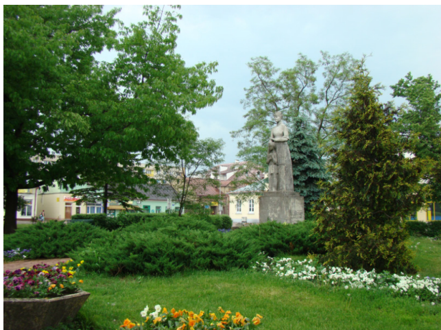
Il. 5. Fragment parku Marii Konopnickiej w Suwałkach