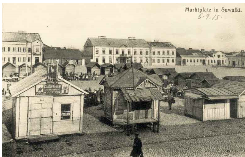
Il. 3. Widok rynku od północnego zachodu (pocztówka z czasów I wojny światowej)