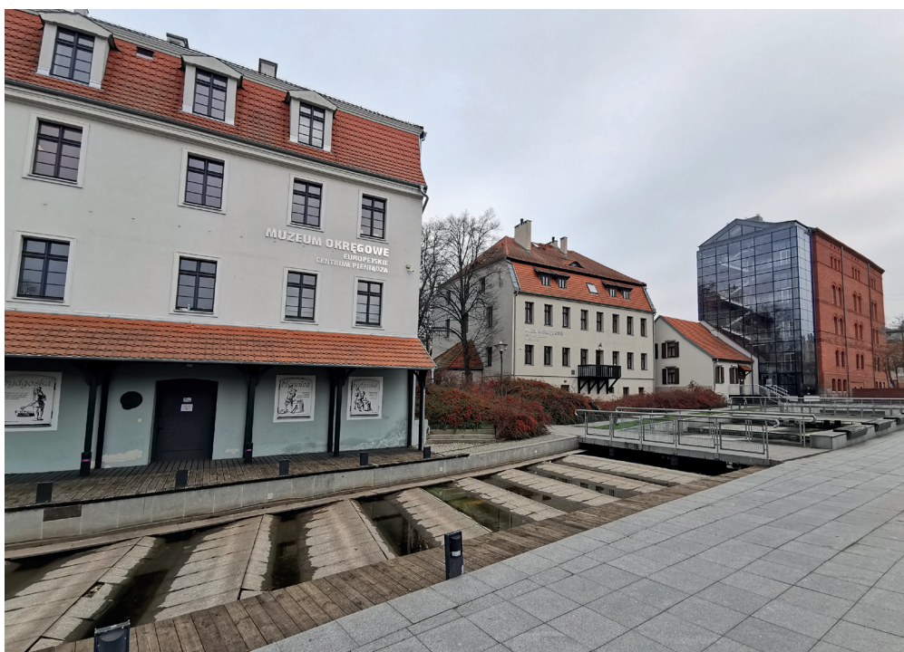
Il. 12. Zrewitalizowane budynki Muzeum Okręgowego w Bydgoszczy na Wyspie Młyńskiej od strony Międzywodzia, widok w kierunku południowo-wschodnim

Rewitalizacji zostały odrestaurowane z zachowaniem układu funkcjonalno-przestrzennego i przeznaczone na siedzibę Parku Kultury – inkubatora aktywności dla przyszłych placówek edukacyjnych, kulturalnych i rozrywkowych 37 (il. 13).