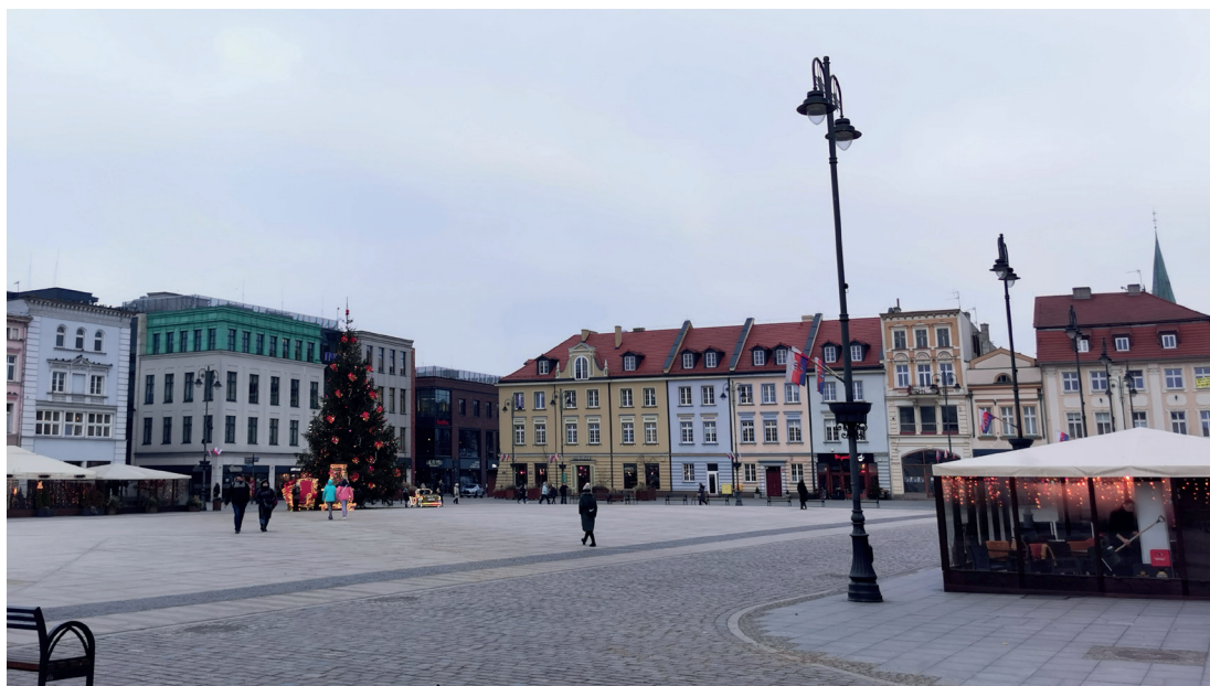
Il. 6. Stary Rynek w Bydgoszczy, widok w kierunku północno-wschodnim na odbudowaną część pierzei północnej i wschodniej

W części wschodniej pierzeję odbudowano już w latach 1953–1956 w stylu historycznym, bez odniesienia do zabudowy istniejącej w tym miejscu wcześniej (il. 6). Wprowadzanie do przestrzeni miejskiej elementów i motywów klasycznych mających nadać jej cechy polskiego krajobrazu było tendencją ogólnopolską. Budynki tworzą zwartą blokową bryłę, wyraźnie wskazującą na inny czas powstania niż pozostała część pierzei. Przed dwudziestoma laty przemaalowano fasady w dość intensywnych kolorach, co podkreśliło artykulację elewacji i osłabiło oddziaływanie blokowej bryły. Sama koncepcja odbudowy może już uchodzić za nawarstwienie historyczne, wskazujące na działalność powojennej „polskiej szkoły konserwatorskiej” 15 . Jednak szare tynki z białymi stolarkami typowymi dla tego czasu, zachowane jeszcze od strony elewacji podwórzowych, społecznie byłyby dziś nie do przyjęcia. Warto jednak w przyszłości zaplanować rewaloryzację zabudowy według koncepcji podobnej do zastosowanej w procesie rewitalizacji ulic Ogarnej czy Szerokiej w Gdańsku 16 .