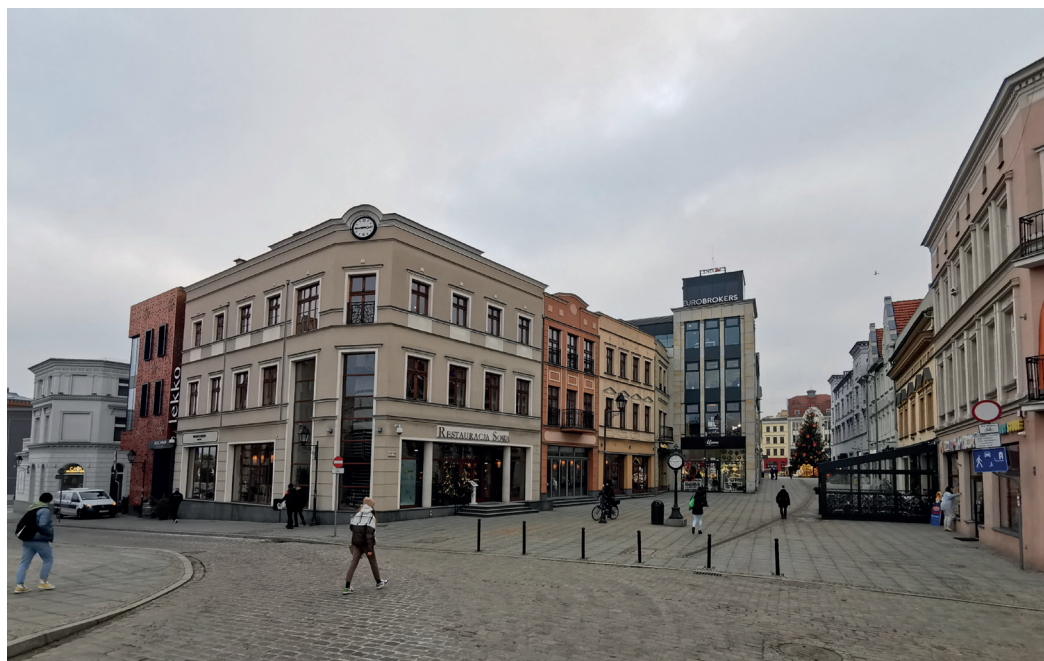
Il. 7. Ul. Mostowa w Bydgoszczy – widok na odbudowaną pierzeję wschodnią, w kierunku południowym – Starego Rynku; po prawej (zachodniej) stronie zachowane historyczne kamienice

zagospodarowania przestrzennego z uwzględnieniem uwag konserwatora wojewódzkiego 22 . „Kaskadę” rozebrano w latach 2011–2012, a pierzeję północną odbudowano w latach 2013–2014 (GM Architekci), przy czym dostosowano kubaturę nowych budynków do sąsiedniej zabudowy i zachowano klasyczny podział artykulacji elewacji, tak jak to postulowano ponad 40 lat temu (il. 4). Do budynków istniejących wcześniej nowe nawiązują proporcjami szerokości i w ogólnym zarysie wysokości, nie naśladowując form historycznych harmonijnie wpisują się w charakter rynku 23 .