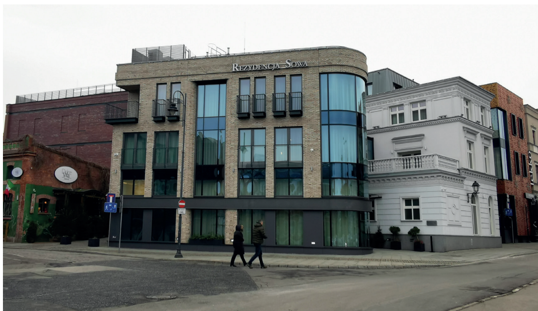
Il. 11. Rybi Rynek – widok w kierunku zachodnim na kompleks hotelowo-usługowy „Łaźnie Miejskie” w bloku zabudowy pomiędzy ul. Jatki, Grodzką a Rybim Rynkiem (fot. K. Zimna-Kawecka, 2023 r.)

Działania od lat 80. XX wieku związane z wprowadzaniem nowej architektury do przestrzeni historycznej zostały określone przez prof. Lubocką-Hoffmann jako retrowersja – metoda zapoczątkowana przez nią w Elblągu. Nowe rozwiązanie polegało na zachowaniu dawnego układu przestrzennego, projektowaniu kamienic o tradycyjnych gabarytach i podziałach elewacji, które otrzymały wyraźnie współczesne formy architektoniczne, nawiązujące jednocześnie do lokalnej tradycji, zharmonizowane z zabytkowymi budowlami i otoczeniem 29 . Bydgoski projekt BRE Banku został nagrodzony w konkursach architektonicznych (m.in. SARP) i otworzył drogę nowej architekturze w historycznym centrum. Jak każda realizacja w przestrzeni publicznej spotkał się on też z krytyką – w widoku prostopadłym z drugiego brzegu monumentalna prosta bryła może sprawiać wrażenie nieco przytłaczające, natomiast w widoku na nabrzeże z głównej osi komunikacyjnej (mostu, przy ulicy Mostowej) budynki te stanowią kompozycyjnie interesujące domknięcie panoramy (il. 10). Wykorzystana okładzina ceramiczna z naturalnymi odcieniami i widocznym kruszywem także jest dobrej jakości.