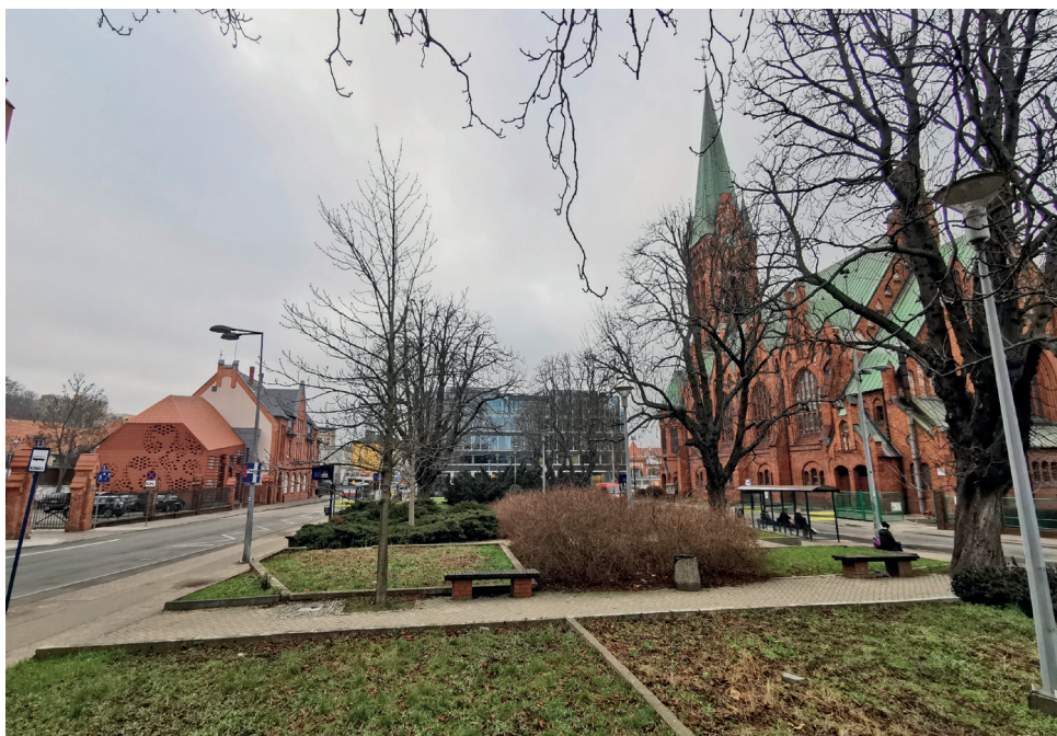
Il. 15. Plac Kościeleckich w Bydgoszczy, widok z wnętrza placu od strony wschodniej. Po lewej (południowej) stronie rozbudowany zabytkowy budynek KPCCK, w centrum biurowiec Immobile, po prawej (północnej) zabytkowy kościół Jezuitów, dawniej ewangelicki (fot. K. Zimna-Kawecka, 2023 r.)

Choć sama architektura jest doceniana ze względu na technologię i estetykę, m.in. kamienne okładziny elewacji, część odbiorców razi zastosowana forma i kubatura blokowa, przeskalowana względem miejsca, kubatura o fasadzie kontrastującej kolorem i materiałem z ceglаныmi budynkami wokół placu (nawet stacja benzynowa ma częściowo ceramiczną okładzinę). Według projektantów budynek harmonizuje się z historyczną przestrzenią, gdyż szklana elewacja zapewnia odbicie kościoła, a nawiązaniem do historycznej zabudowy jest zróżnicowanie płaszczyzn elewacji poprzez wprowadzenie wnęk i wykuszy.