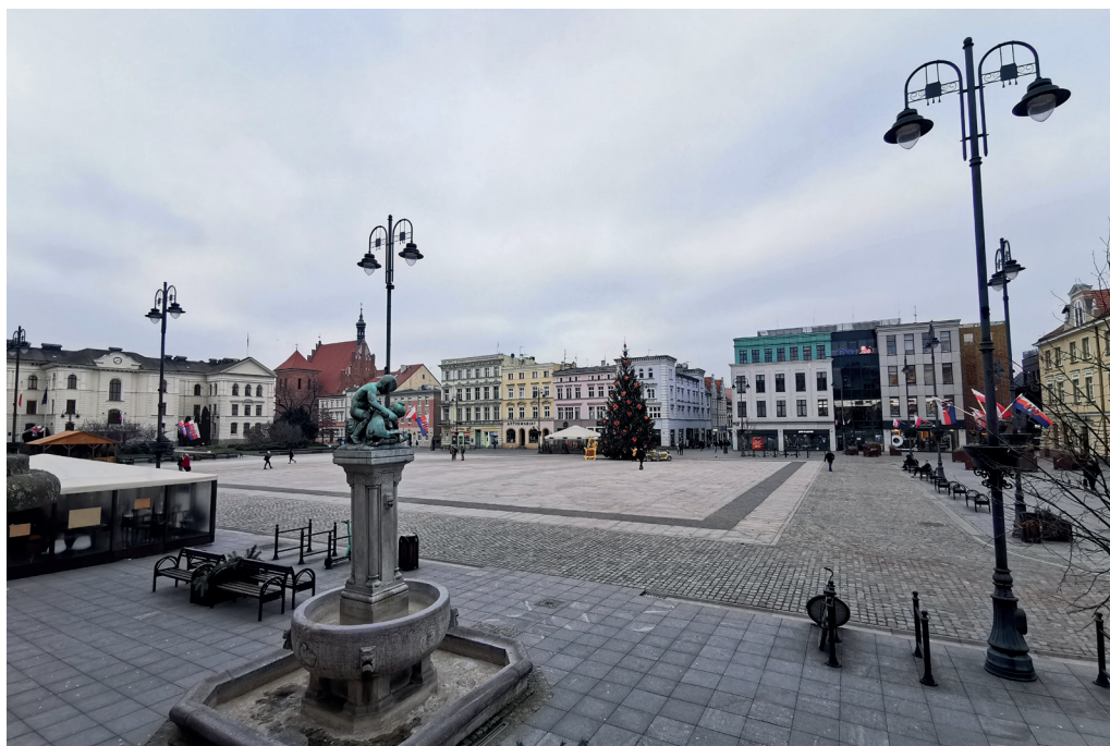
Il. 4. Stary Rynek w Bydgoszczy, widok w kierunku północno-zachodnim. Po prawej (zachodniej) stronie odbudowana część północnej pierzei rynku, po lewej (zachodniej) dawny budynek kolegium jezuickiego

Pierwotny projekt z 2009 roku (GM Architekci) kilkakrotnie zmieniano z powodu braku funduszy. Pierwsza wersja kładła nacisk na jakość detalu rozwiązań i materiałów oraz uwzględniała podziemną trasę turystyczną 10 (il. 5). W wyniku badań archeologicznych zrezygnowano z odsłonięcia i zabezpieczenia szkleniem relikwów murów kościoła i ratusza stojącego kiedyś na środku rynku. Przeważały techniczne trudności z utrzymaniem stabilnych warunków klimatycznych, co wiązałoby się z wbudowaniem urządzeń w zabytkowe fundamenty, oraz wysokie koszty takiej inwestycji. Z tych samych powodów zrezygnowano z fontanny 11 . Służby konserwatorskie początkowo nie wyraziły zgody na nasadzenia drzew, zwracając uwagę, że wcześniej rynek nie był zadrzewiony, a nowe nasadzenia mogłyby spowodować uszkodzenia relikwów budowli. W wyniku oczekiwań społecznych uzgodniono jednak pojedyncze nasadzenia dwóch drzew w narożach wschodnich, miasto nie zdecydowało się jednak na większą liczbę nasadzeń. Nawierzchnię wyłożono kamiennymi płytami, ciemniejszym odcieniem, dzięki czemu wyznaczonoobrys dawnego ratusza.