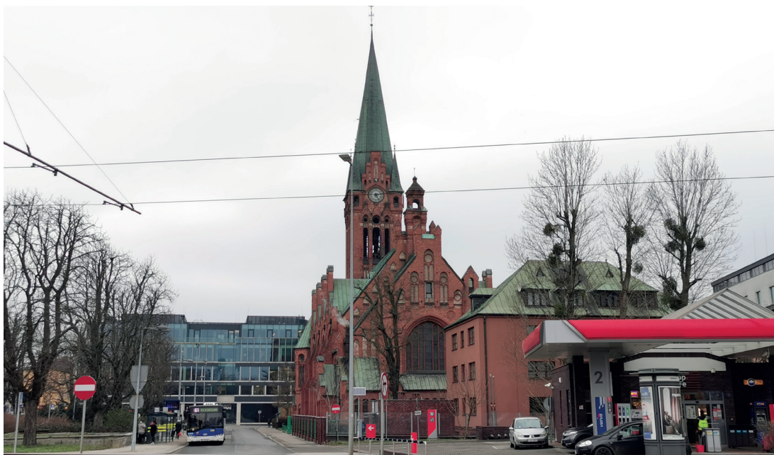
Il. 14. Plac Kościeleckich w Bydgoszczy, widok od strony wschodniej (fot. K. Zimna-Kawecka, 2023 r.)