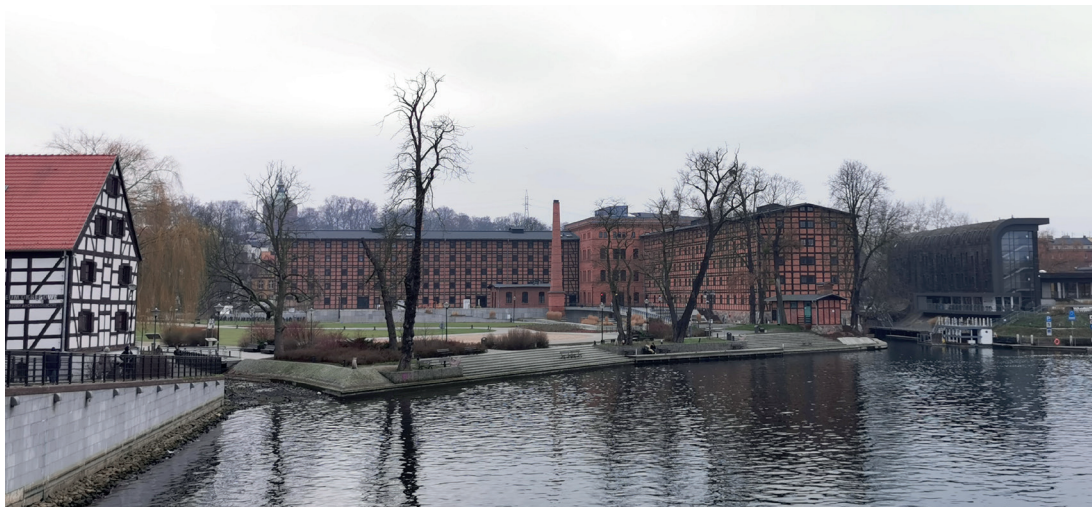
Il. 13. Widok na Wyspę Młyńską od strony Brdy w kierunku południowo-zachodnim. W centrum zrewitalizowany zabytkowy kompleks Młynów Rothera (fot. K. Zimna-Kawecka, 2023 r.)

placu i stanowi jednocześnie formę dialogu z przeszłością – materiał, kubatura i bryła pozwalają na właściwą ekspozycję zabytku (proj. Pracownia Ingraf – arch. Anna Pawlicka-Zabojszcz) 38 . Kolejna realizacja to biurowiec klasy A, prezentujący nowoczesne, ekologiczne rozwiązania konstrukcyjno-funkcjonalne (2016–2018, CDF Architekci).