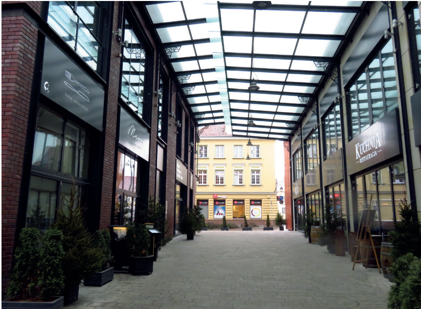
Il. 8. Odbudowana ul. Jatki w Bydgoszczy, widok w kierunku południowym – Starego Rynku

Wcześniejsza część nowej, przeznaczonej na cele restauracyjne zabudowy ulicy Mostowej (2006–2007), to dość zachowawcze projekty o historyzującej formie, z zestawem uproszczonych motywów nowożytnych. Jako tzw. architektura tła miały służyć harmonijnemu widokowi ulicy z zachowanymi w pierzei zachodniej XIX-wiecznymi kamienicami, tak aby z kolei wyeksponować ich wartości artystyczne. Zabudowa ta może być jednak odczytywana jako historyczna. Z kolei utrzymane w nowoczesnych formach kamienice drugiej części bloku – wspólnego z rynkiem (2013) – pełnią inną funkcję: stanowią nowy akcent architektoniczny eksponowany od strony rynku i wlotu ul. Mostowej.