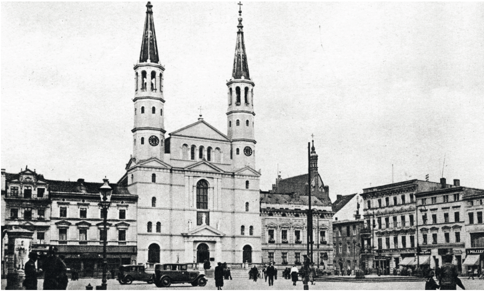
Il. 3. Stary Rynek w Bydgoszczy – pierzeja zachodnia przed zniszczeniem, widok w kierunku północno-zachodnim, przed 1935 r. (Narodowe Archiwum Cyfrowe, sygn. 1-U-407)

plac Kościeleckich, ulica Grodzka) ilustruje wszystkie etapy odbudowy miast historycznych w kontekście zagospodarowania przestrzennego wyszczególnione przez prof. Marię Lubocką-Hoffmann 7 : od odbudowy historycznej, poprzez odbudowę zharmonizowaną i modernizm, po retrowersję, a także współczesną fazę, w której wyróżnić można kilka nurtów, w tym rekonstrukcję i realizację postmodernistyczne, będące interpretacją wartości genius loci miasta, mające wpisywać się w historyczną tkankę miejską 8 .