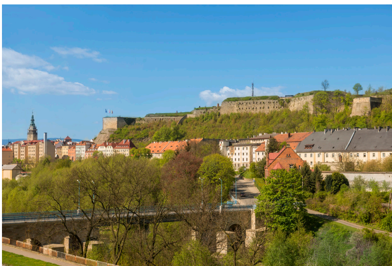
Fot. 4 Widok na Twierdzę Główną i dawne Przedmieście Zabkowickie z koszarami i spichlerzami. Na pierwszym planie dawny most słuzowy nad Nysą Kłodzką