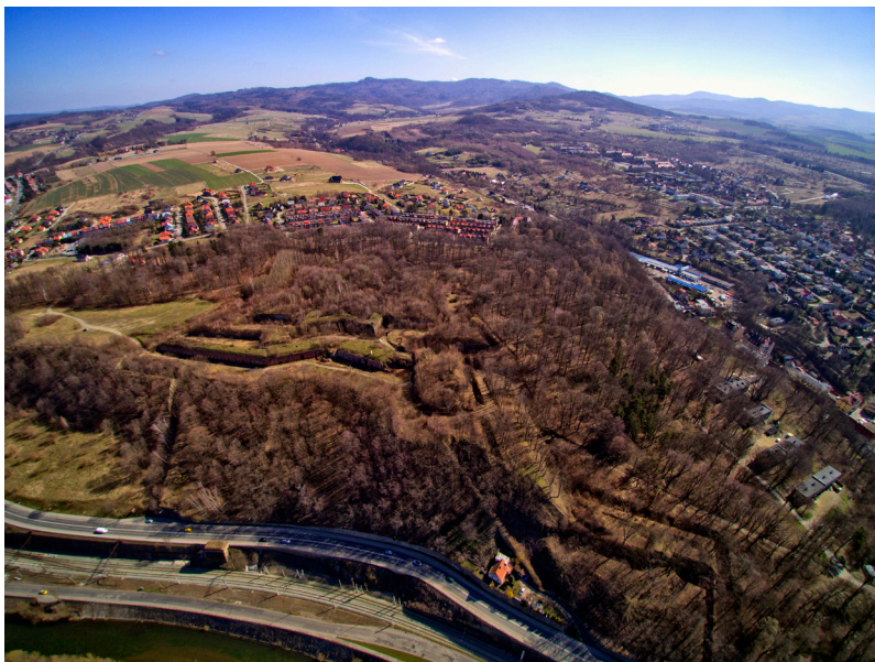
Fot. 3 Widok z lotu Ptaka od zachodu na Fort Owcza Góra