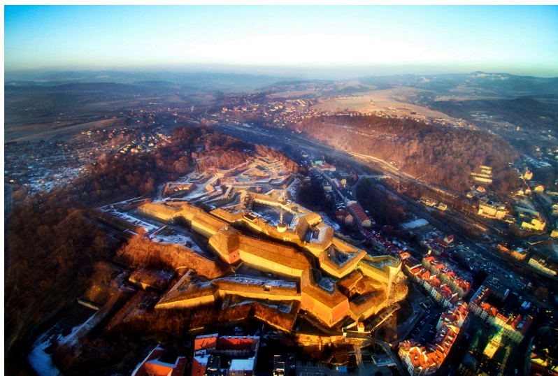
Fot. 5 Widok z lotu ptaka od zachodu na kompleks fortyfikacji kłodzkich. Na pierwszym planie Twierdza Główna, w tle Fort Owcza Góra