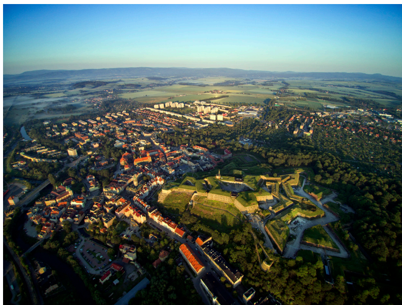
Fot. 2 Twierdza Główna z lotu ptaka w orientacji zachód – wschód