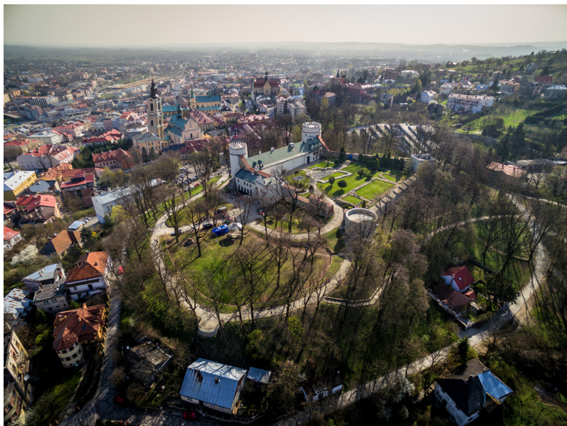
Fot. 1 Zamek w Przemysłu, widok z lotu ptaka od pn.-zach. Poniżej wzgórze, patrząc od lewej najważniejsze świątynie: katedra rzymskokatolicka z wieżą-dzwonnicy, kościół franciszkanów, kościół jezuitów (obecnie katedra greckokatolicka), kościół karmelitów oraz kościół karmelitanek.