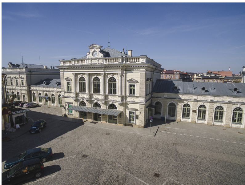
Fot. 4 Dworzec główny w Przemyślu. Widok z lotu ptaka od pd.-wsch.

Opracowanie tak szeroko zakrojonego wniosku, obejmującego rozległy teren Twierdzy Przemyśl zlokalizowany na obszarze dziewięciu gmin powiatu przemyskiego, nie byłoby możliwe, gdyby nie powołany w r. 2008 Związek Gmin Fortecznych Twierdzy Przemyśl zrzeszający dziewięć gmin powiatu przemyskiego 7 . Powołanie Związku umożliwiło realizację unikatowego w skali kraju projektu zagospodarowania części Twierdzy Przemyśl. W latach 2007-2013 zrealizowano I etap projektu Zagospodarowanie zespołu zabytkowego Twierdzy Przemyśl w celu udostępnienia dla turystyki kulturowej . Koszt projektu wyniósł 22 071 887,89 zł, w tym wysokość kosztów kwalifikowanych 20 761 471,39 zł. W projekcie wykonano prace na 24 obiektach dziedzictwa kulturowego. Na podstawie prognoz przewidziano, że rocznie odwiedzi obiekty ponad 14 tys. turystów. W wyniku projektu udostępniono około 20% Twierdzy Przemyśl. Działania te zostały docenione w r. 2016 w ramach konkursu Ministra Kultury i Dziedzictwa Narodowego i Generalnego Konserwatora Zabytków – Zabytek Zadbany, i przyznano Związkowi Gmin Fortecznych Twierdzy Przemyśl wyróżnienie w kategorii rewaloryzacji przestrzeni kulturowej i krajobrazu 8 .