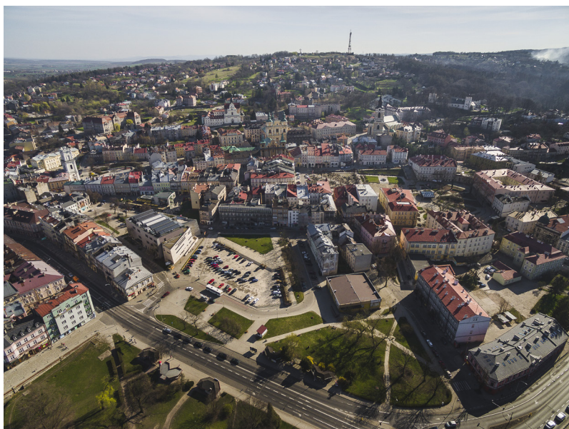
Fot. 2 Przemysl - część staromiejska, widok od pn. z lotu ptaka ukazujący tarasowy układ zabudowy.