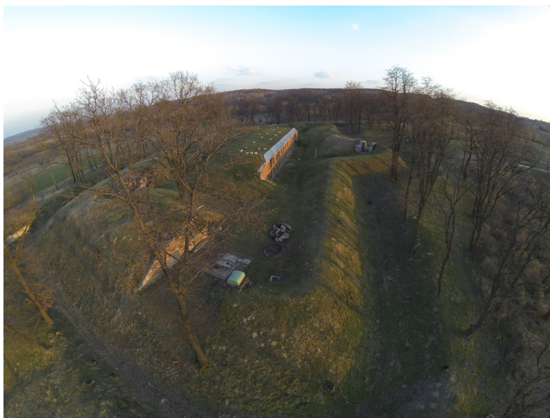
Fot. 3 Fort XV „Borek”, widok z lotu ptaka. Stan po przeprowadzonych pracach rewitalizacyjnych.

Najwięcej pytań i wątpliwości dotyczyło Twierdzy Przemyśl (1854-1914) 4 . Związane było to ze stanem zachowania obiektów pofortecznych, a przede wszystkim z obszarem, rozległością terytorialną i rozdrobnieniem poszczególnych mniejszych i większych dzieł fortecznych (fot. 3).