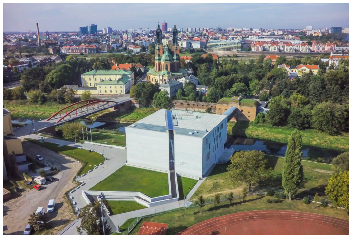
Fot. 4 Widok na Ostrów Tumski, na pierwszym planie Brama Poznania - Interaktywne Centrum Historii Ostrowa Tumskiego

Trzeba również wspomnieć o obiektach historycznych, będących przedmiotem szczególnej troski służb konserwatorskich. Po wielu latach zaniedbań remontu doczekał się Pałac Mielżyńskich, w którym nowy właściciel rozpoczął prace renowacyjne i adaptacyjne. Wkrótce ruszy remont modernistycznego budynku przy ul. Paderewskiego 1. Na Ostrowie Tumskim trwają prace związane z remontem zabytkowej Psalterii, kompleksową konserwacją wnętrza późnogotyckiego kościoła Najświętszej Marii Panny in Summo, a w najbliższym czasie zostanie na nowo zaaranżowane jego bezpośrednie otoczenie w ramach programu „Tu się wszystko zaczęło”. W kościele św. Jana Jerozolimskiego w trakcie żmudnych badań konserwatorskich we wnętrzu odkryto bardzo cenne warstwy pierwotnego wystroju malarskiego. Wskazane przykłady są przykładem dużego zaangażowania inwestorów, ale również zdecydowanego wzrostu świadomości wartości dziedzictwa kulturowego wśród mieszkańców oraz inwestorów 20 .