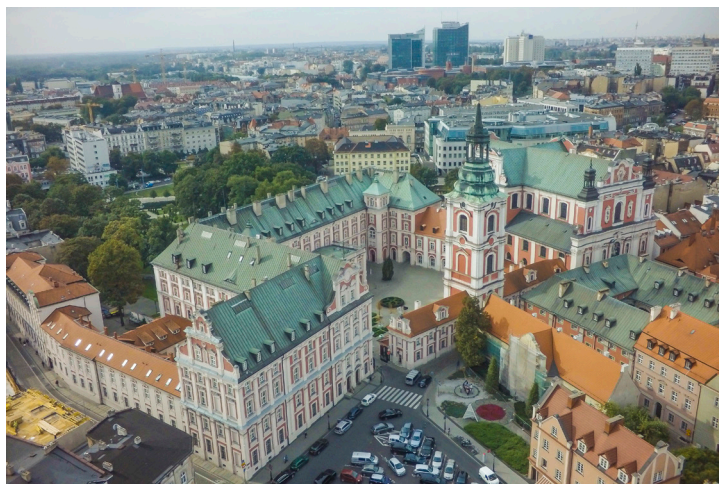
Fot. 2 Widok na zespół budynków dawnego Kolegium Jezuickiego (obecnie Urząd Miejski) oraz na dalszym planie PFC, Andersia, Stary Browar

spektakularne inwestycje ostatnich lat, w tym m.in. Centrum Handlowe „Stary Browar”, a także kompleks dwóch poznańskich wieżowców klasy A – Poznań Financial Centre i Andersia Tower. Na obszarze wpisanym, już po 2008 roku powstały takie inwestycje, jak zrealizowany przy ul. Stawnej hotel „Puro” będący przykładem nowoczesnej architektury inspirowanej historycznymi formami, znakomicie wpisujący się w zabudowę ulicy biurowiec „Za Bramką” czy nowoczesna w swoim wyrazie Brama Poznania - Interaktywne Centrum Historii Ostrowa Tumskiego zlokalizowane na terenie Śródkki.