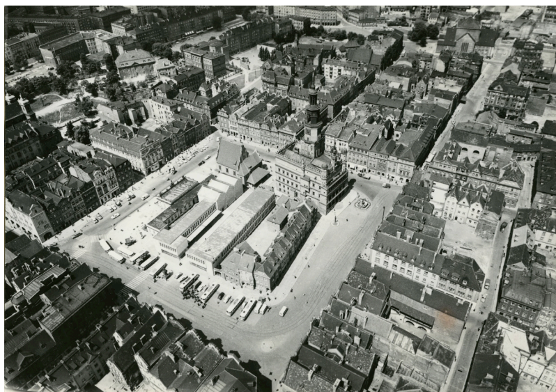
Fot. 1 Widok na zrekonstruowany zespół Starego Miasta, 1963, fot. Janusz Korpala, archiwum Miejskiego Konserwatora Zabytków w Poznaniu źródło: cyryl.poznan.pl

Miasta 5 , poprzez „Stary Rynek” 6 , „Centrum Miasta” 7 , „Ostrów Tumski ze Śródką” 8 , aż po „Aleje Niepodległości” 9 i pozostałości pruskich fortyfikacji, z których „Cytadela” objęta została odrębnym wpisem 10 . Te prewencyjne działania dały w następnych latach podstawy pod konsekwentną politykę ochrony kulturowego dziedzictwa centralnego obszaru miasta i wzmocnienie roli Miejskiego Konserwatora Zabytków w polityce kształtowania i przeobrażania przestrzeni miejskiej.