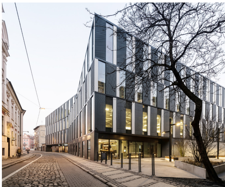
Fot. 3 Budynek biurowy przy ul. Za Bramką, fot. Przemysław Turlej, źródło: Ultra Architects