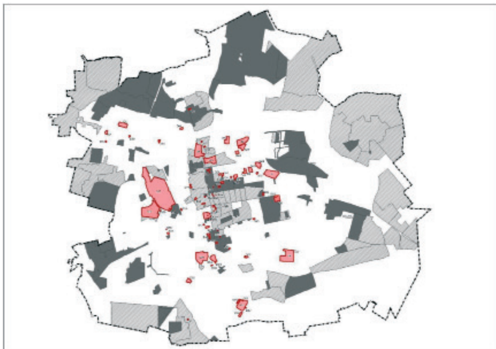
Rys. 2 Dobra Kultury Współczesnej w obszarze miasta i ich ochrona w planach miejscowych. Kolorem czerwonym oznaczono DKW, kolorem jasnym szarym obszary gdzie sporządzane są plany miejscowe, kolorem ciemnym szarym obszary obowiązujących planów. Rysunek – Katarzyna Pielużek Miejska Pracownia Urbanistyczna w Łodzi.

W najbliższych dniach odbędzie się ponownie spotkanie środowiskowe w celu podjęcia dyskusji dotyczącej kryteriów wyboru, wspólnej weryfikacji postulowanych obiektów oraz określenia zasad ich ochrony w polityce przestrzennej Łodzi.