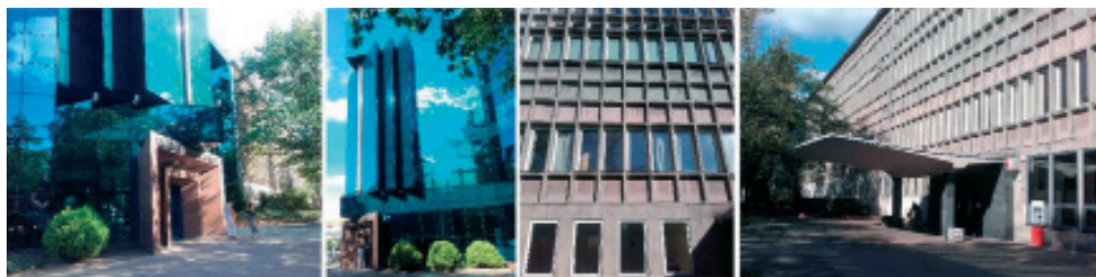
Rys. 1 Biblioteka Uniwersytetu Łódzkiego (zdjęcia po prawej stronie) wraz ze współczesną rozbudową (zdjęcia po lewej stronie). Obiekt typowany jako Dobro Kultury Współczesnej do obowiązującego Studium, obecnie zabytek.

Od czasu uchwalenia Studium tj. od października 2010 r. cztery z siedmiu wskazanych tam DKW stały się zabytkami, co stało się jednym z argumentów do ponownego przeanalizowania zasobu uznanych dzieł urbanistyki i architektury z II połowy XX wieku w Łodzi.