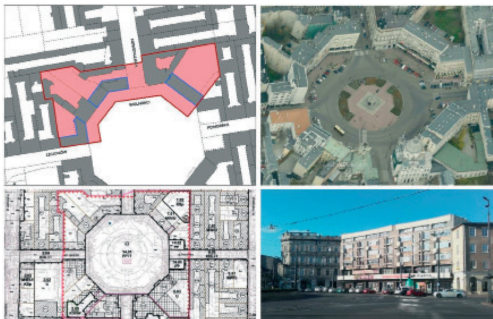
Rys. 3 Budynki mieszkalno-usługowe przy Placu Wolności 5, 7/8 oraz 10/11. Dobro Kultury Współczesnej chronione ustaleniami planu miejscowego.

Dodatkowo zaproponowano, aby nie rezygnować całkowicie ze wskazywania imiennej listy pozostałych obiektów współczesnych i w aneksie do studium (stanowiącym załącznik nr 10) zamieszczono listę uznanych obiektów urbanistyki i architektury XX wieku z lat 1945–1989 obejmującą 92 pozycje 19 . Lista ta miała w założeniu stanowić podpowiedź dla autorów opracowywanych planów miejscowych, które z obiektów z terenu miasta warto objąć ochroną poprzez ustalenia aktów prawa miejscowego. Ustalenie to miało jedną podstawową zaletę, ale również jedną zasadniczą wadę. Zaletą było zamieszczenie i upublicznienie w jednym miejscu wykazu obiektów wytypowanych wg jednorodnych kryteriów, wadą – fakultatywność wyboru spośród wskazanej listy.