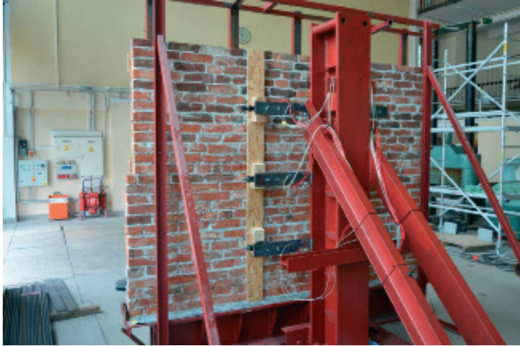
Il.05. Opracowanie metody prostowania ściany i likwidacji deformacji na specjalnie przygotowanej replice ściany. Fot. Politechnika Krakowska, 2016