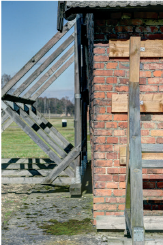
II.04. Barak murowany na terenie byłego KL Auschwitz I. Widoczna silna deformacja ściany szczytowej. Fot. Kamil Będkowski, 2016