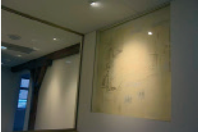
II.02. Ekspozycja Shoah w bloku 27. na terenie byłego KL Auschwitz I. Odkryte w trakcie prac konserwatorskich malowidło zostało wyeksponowane i włączone do wystawy. Fot. Anna Łopuska, 2016