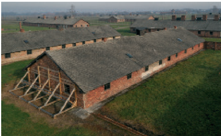
Il.03. Barak murowany na terenie byłego KL Auschwitz I. Tymczasowe podpory zabezpieczają ścianę baraku.

Baraki wzniesione zostały w latach 1941/1942, przy czym znaczna część procesu budowlanego miała miejsce w okresie jesiennym i zimowym. Do budowy kompleksu wykorzystano przymusową siłę roboczą składającą się z wyczerpanych sowieckich jeńców wojennych, którzy masowo umierali przy pracy 11 . Materiał budowlany w postaci cegieł i drewnianych elementów konstrukcyjnych pozyskany został z rozbiórki domostw należących do wcześniej wysiedlonych mieszkańców wsi Brzezinka, a konstrukcja baraków daleka była od jakichkolwiek standardów. Pośród najbardziej niebezpiecznych wad elementów konstrukcyjnych wymienić należy zbyt płytkie fundamenty lub ich całkowity brak, brak odpowiedniej izolacji, smukłość i niewielką szerokość ścian (w większości wypadków 12 cm) oraz niedostateczne przekroje elementów drewnianych. Eksploatacja tych budynków zaplanowana była jedynie na kilka lat funkcjonowania fabryki śmierci i nikt w tamtym czasie nie zamierzał utrzymywać ich przez kolejnych ponad 70 lat, które upłynęły od czasu budowy. W tym czasie objekty te nieustannie eksploatowane były na działanie czynników niszczących, takich jak silne wiatry, woda, mróz, korozja biologiczna i intensywne ruch odwiedzających.