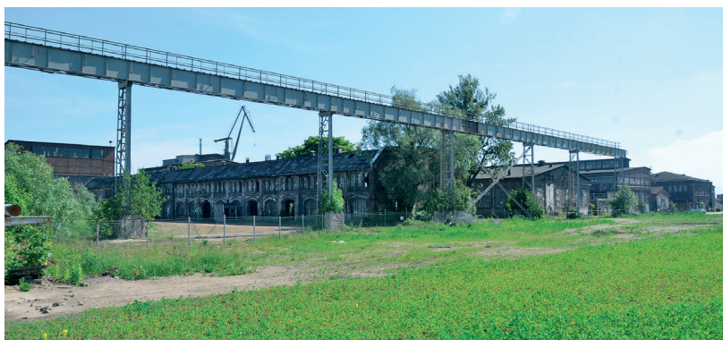
Il. 5 Tereny dawnej Stoczni Gdańskiej, widok w kierunku historycznego zespołu Stoczni Cesarskiej.

W ramach wyżej przedstawionych postulatów dotychczas jedynie znacząco rozszerzono wojewódzką ewidencję zabytków, a najcenniejsze budowle wpisano do rejestru zabytków 24 . Pozostałe zalecenia nie doczekały się realizacji.