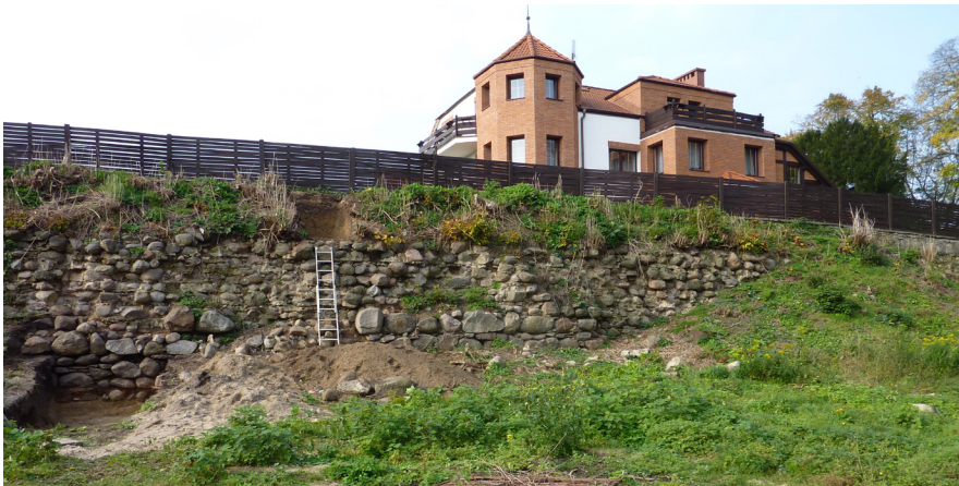
Ryc. 5 Mur skarpy przedzamcza zachodniego. Odkrywka archeologiczna po lewej stronie ukazuje głębokość posadowienia; widoczny budynek – prawdopodobna przyczyna zawalenia długiej partii muru (2017)