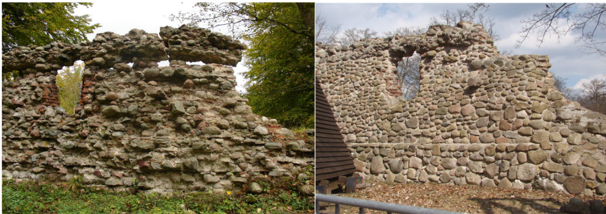
Ryc. 4 Fragment muru „Kujaw”: utrata „dramatyzmu” ceną za zachowanie zabytku... (2007, 2014)