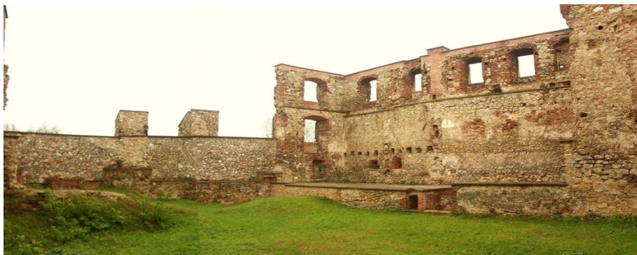
Ryc. 5 Siewierz. Zamek widok od strony dziedzińca na ruiny skrzydła zachodniego i południowego w 2006 r. Widoczna płyta betonowa nad sklepieniem piwnicy, betonowe parapety nad koronę murów. W skrzydle południowym widoczne zasypane fundamenty murów wewnętrznych oraz mur parawanowy wzniesiony w latach 60. XX w. w miejscu zawalonej w 20. -leciu międzywojennym południowej ściany zamku