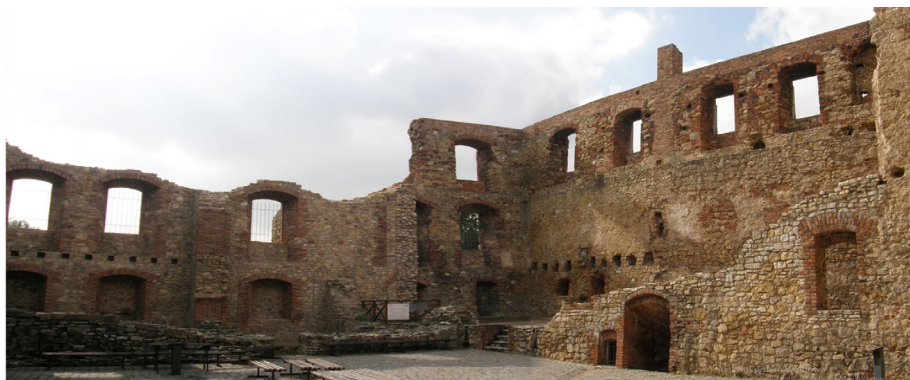
Ryc. 6 Zamek widok od strony dziedzińca na ruiny skrzydła zachodniego i południowego w 2018 r. Stan po pracach konserwatorsko – restauratorskich z lat 2007 – 2009. Skrzydło zachodnie i południowe po reintegracji w postaci odsłonięcia i częściowej rekonstrukcji murów przyziemia oraz częściowej rekonstrukcji zewnętrznej ściany południowej. Zmienione zabezpieczenie korony murów oraz likwidacja niewłaściwych przemurowań z poprzednich prac.