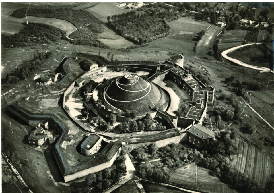
Fot. 2 Mogiła Kościuszki i Fort „Kościuszko” z lotu ptaka od strony zachodniej. Fot. Agencja Fotograficzna „Światowid” 1935. Muz. Hist. M. Krakowa