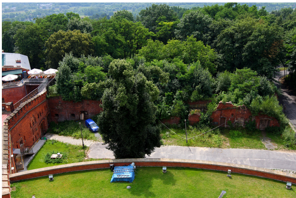
Fot. 4 Kurtyna przed remontem konserwatorsko-adaptacyjnym.