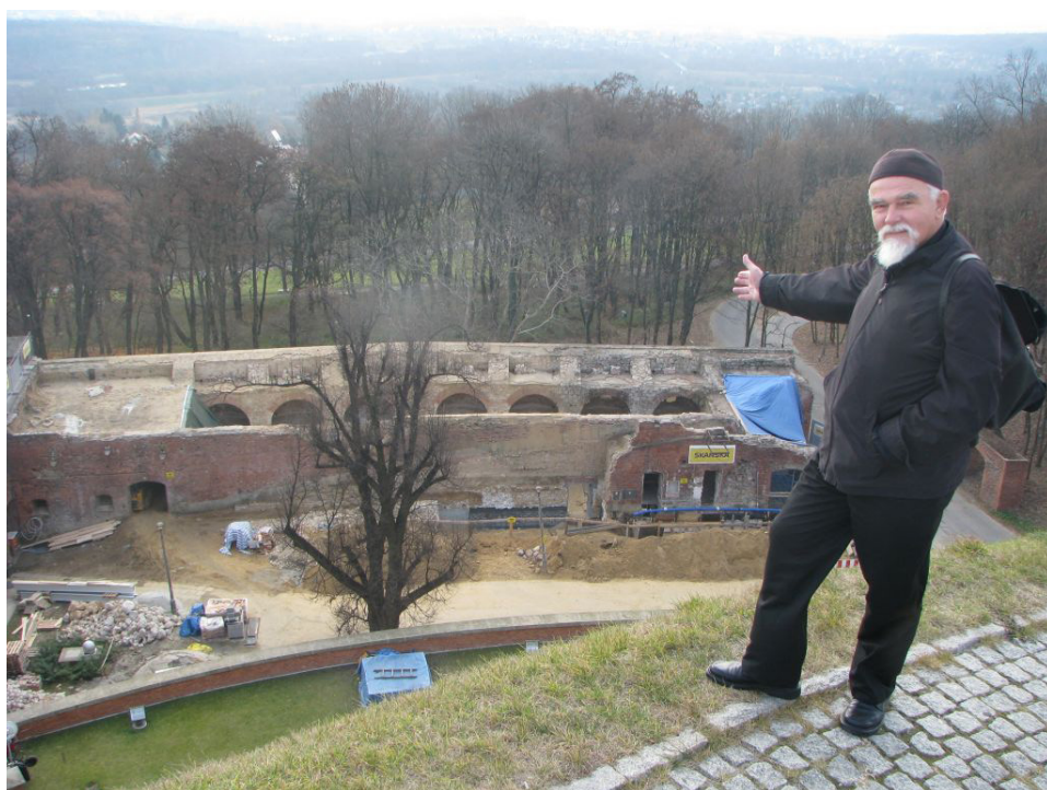
Fot. 5 Kurtyna po wykarczowaniu drzew i wybraniu ziemi.