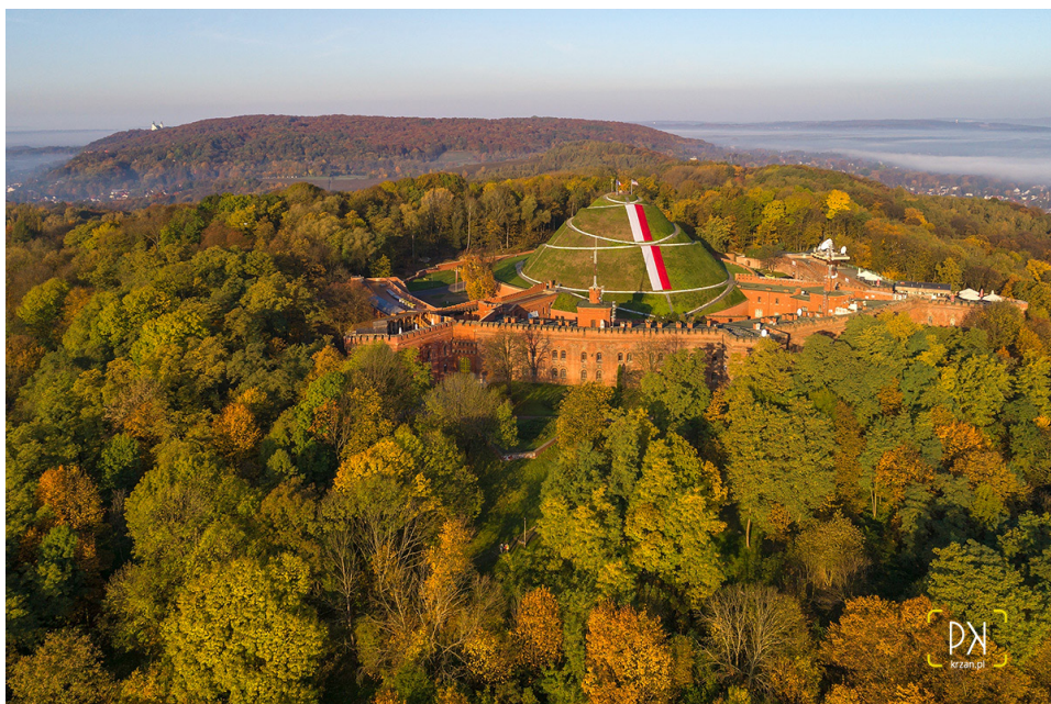
Fot. 9 Tak wygląda Kopiec Kościuszki w święta narodowe i dni uroczyste.