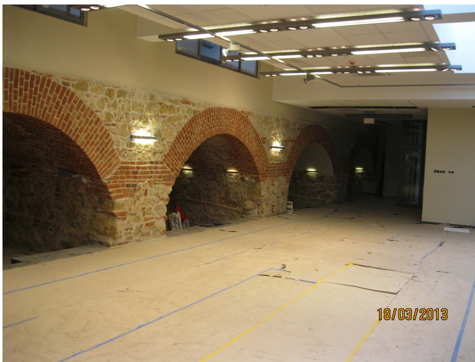
Fot. 7 Fragment wnętrza Kurtyny w trakcie remontu.