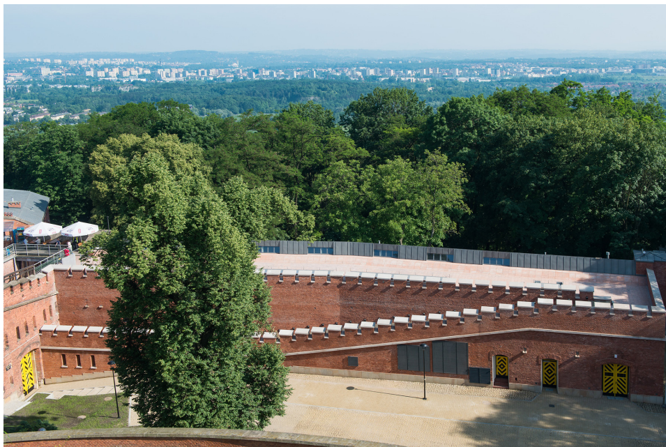
Fot. 6 Kurtyna po remoncie.