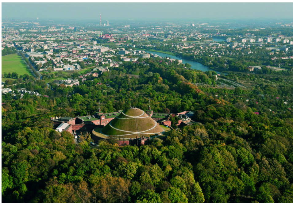
Fot. 3 Kopiec Kościuszki od ponad pół wieku zarasta samosiewny las.