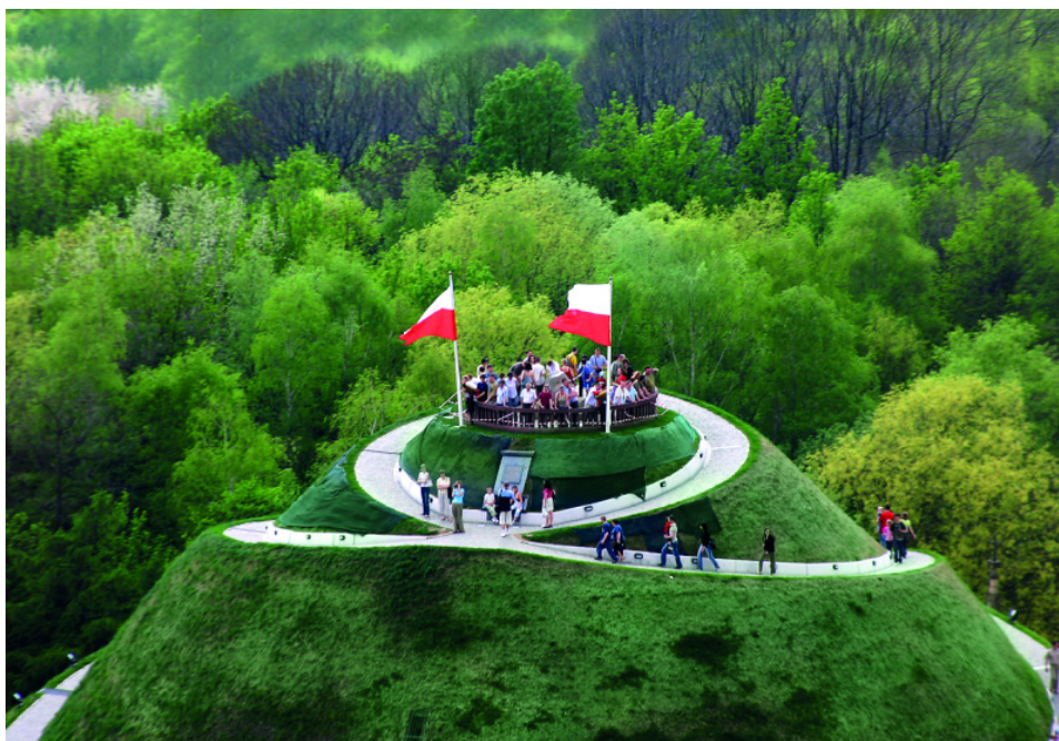
Fot. 10 Szczyt Kopca Kościuszki w dzień powszedni.