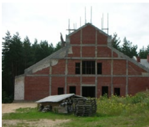
Ryc. 17. Kościół pw. św. Józefa, arch. Arkadiusza Koca i Lecha Żendziana.