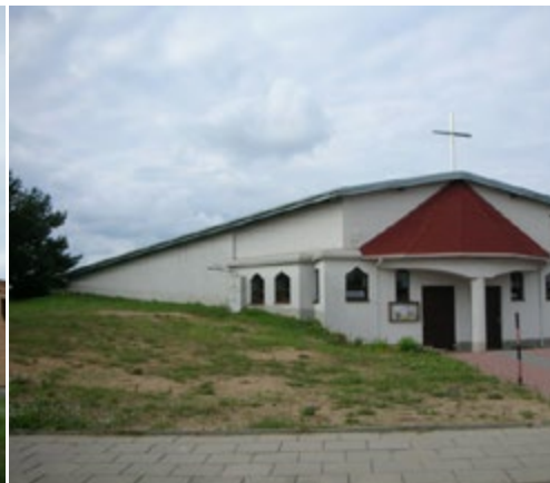
Ryc. 16. Kościół pw. NMP Nieustającej Pomocy, arch. Andrzej Nowakowski, proj. 2000.