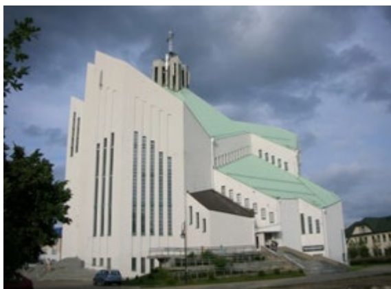
Ryc. 7. i 8. Kościół pw. NMP Matki Kościoła, arch. Andrzej Chwalibóg (1990–1996). Fig. 7. & 8. Church of the Mother of the Church, arch. Andrzej Chwalibóg (1990–1996).