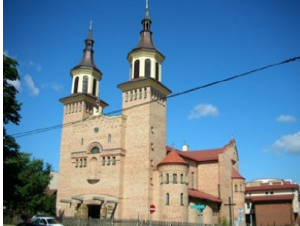
Ryc. 12. Kościół pw. Matki Bożej Fatimskiej, arch. Andrzej Nowakowski (1996–2005) Fig. 12. The Mother of God of Fatima church, arch. Andrzej Nowakowski (1996–2005).

W okresie tym wzniesiono również nową kaplicę zakonną Sióstr Misjonarek Św. Rodziny przy ul. Zielnej (autor: arch. Maciej Citko, realizacja 2002–2004) oraz przystosowano na potrzeby kościoła (kościół garnizonowy pw. św. Jerzego) obiekt dawnego warsztatu wojskowego przy ul. Kawaleryjskiej (autor: arch. arch. Andrzej Porażko, Robert Misiuk, realizacja 1999–2000).