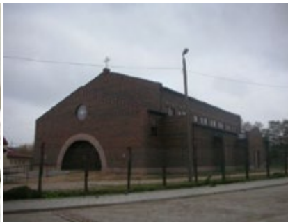
Ryc. 14. Kościół pw. Bł. Bolesławy Lament, arch. Arkadiusz Koc, arch. Iwona Toczyłowska (2004–2009).

Fig. 13. The Blessed Bolesława Lament's church, Conceptual project diorama, I Award, arch. Arkadiusz Koc, I. Toczyłowska, Source: Roman Catholic Congregation of the Blessed Bolesława Lament booklet, Białystok 2005, s. 6.