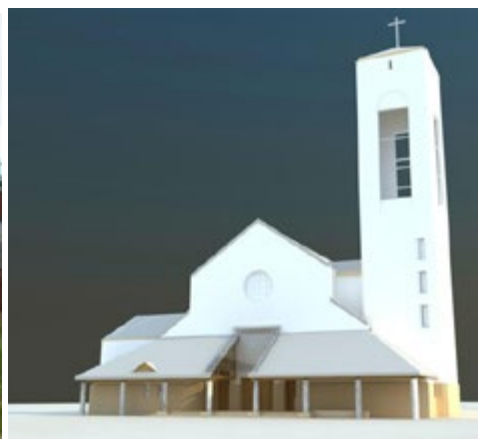
Ryc. 18. Kościół pw. św. Ojca Pio, arch. Adam Suflński.