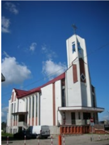
Ryc. 11. Kościół pw. Św. Rodziny, arch. Danuta Łukaszewicz (1993) Fig. 11. Church of the Holy Family, arch. Danuta Łukaszewicz (1993).