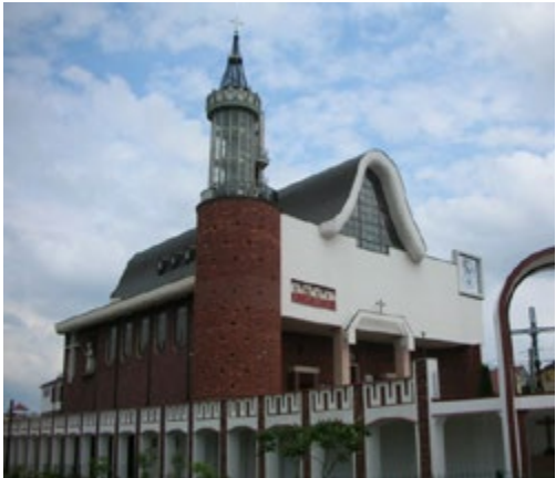
Ryc. 1. Kościół pw. Św. Kazimierza Królewicza, arch. Jan Krutul (1983–1993)

Na terenie przyległym do świątyni w roku 1998 odsłonięto pomnik autorstwa Dymitra Grozdewa – Grób Nieznanego Sybiraka.