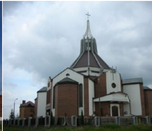
Ryc. 4. Kościół pw. Ducha Świętego, arch. Jerzy Zgliczyński, (1990–1996)

Fig. 3. Saint Jadwiga the Queen church, Arch. Marian Szymański (1984–1988)