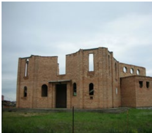
Ryc. 15. Kościół pw. św. Karola Boromeusza, arch. Michał Bałasz, proj. 2000.