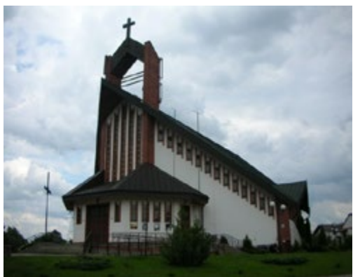
Ryc. 5. Kościół pw. Chrystusa Króla, arch. Andrzej Koć (1986–1989) Fig. 5. Christ the King church, arch. Andrzej Koć (1986–1989)

z przekątniowo prowadzoną osią główną kompozycji. Układ rzutów w bryle odzwierciedlają wysokie namiotowe dachy. Przekątniowe prowadzenie rzutu nadaje im charakterystyczny dynamiczny kształt. W obu przypadkach w kompozycji elewacji oddzielono dach od masywu muru. W kościele autorstwa Krystyny Drewnowskiej wprowadzono w tym celu duże przeszklenia wypełnione witrażami, zaś w kościele pw. Chrystusa Króla wrazenie to stwarza szereg odrębnych otworów okiennych. Ponad świątyniami w obu przypadkach dominują krzyże. W kościele na osiedlu Pietrasze jest to monumentalna, ażurowa żelbetowa forma, zawieszona ponad prezbiterium. Jej zgeometryzowany kształt powielony został w formach otworów drzwiowych i okiennych oraz w kształcie zadaszenia nad wejściem głównym do świątyni. Konkuruje z nim znacznie skromniejszy metalowy krzyż usytuowany ponad partią wejściową. Krzyż z kościoła na osiedlu Dojlidy wyrasta ponad pylony stanowiące elementy kompozycyjne frontonu świątyni. Zdecydowanie różna wielkość obu świątyni (ok. czterokrotnie większy jest kościół na os. Pietrasze) wpływa na emocjonalny odbiór ich wnętrz. Wspólne staje się uzyskanie jednorodnej, otwartej, pozbawionej podpór przestrzeni wewnętrznej, nakierowanej na ołtarz główny. W przypadku kościoła pw. Św. Maksymiliana efekt ten wzmacnia rysunek żelbetowych elementów sklepienia.