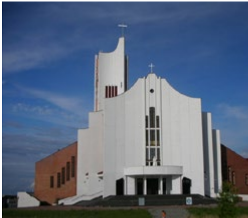
Ryc. 3. Kościół pw. Św. Jadwigi Królowej, arch. Marian Szymański (1984–1988)

Fig. 2. Sanctuary of the God's Mercy, arch. Andrzej Nowakowski, Janusz Pawłowski (1984–1988)