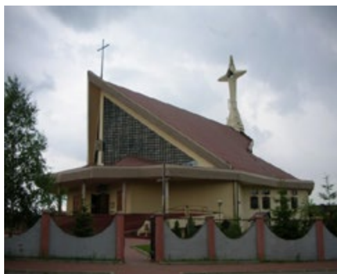
Ryc. 6. Kościół pw. Św. Maksymiliana Marii Kolbego, arch. Krystyna Drewnowska (1983–1995) Fig. 6. Saint Maximillian Maria Kolbe's church, arch. Krystyna Drewnowska (1983–1995)

W omawianym okresie powstała również kaplica seminaryjna pw. św. Jerzego, zlokalizowana na terenie kompleksu Wyższego Seminarium Duchownego w Białymstoku. Obiekt wzniesiono w latach 1982–1984 według projektu arch. Henryka Toczyńskiego. Kaplicę zaprojektowano na rzucie kwadratu z wnętrzem uformowanym po przekątnej.