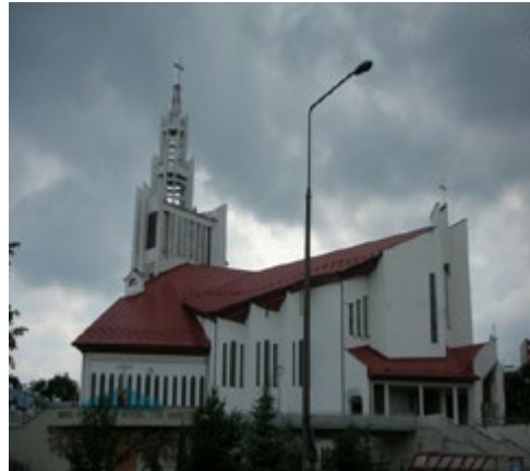
Ryc. 2. Sanktuarium Miłosierdzia Bożego, arch. Andrzej Nowakowski, Janusz Pawłowski (1984–1988)

Fig. 1. Saint Kazimierz church, arch. Jan Krutul (1983–1993)