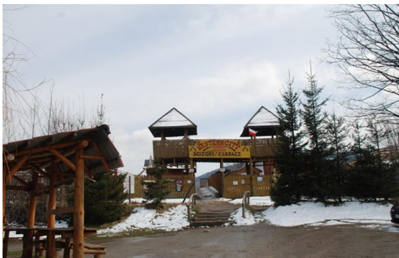
Ryc. 1. Brama wjazdowa do westernowego miasteczka w Ściegnach k. Karpacza

Jedną z najstarszych i dobrze rozpoznawalnych inwestycji tego trendu jest Western City w Ściegnach k. Karpacza. Park rozrywki w stylu western rodeo, który powstał w 1995 roku, jest prekursorem dolnośląskich wiosek tematycznych. Odwiedzający, a są wśród nich grupy szkolne, rodziny z dziećmi, hobbisci i pasjonaci stylu western, mogą skorzystać z takich atrakcji jak: akademia westernu, czyli szkolenie z jazdy konnej, wyprawa indiańską łodzią canoe po stawie, wizyta w indiańskim tipi lub domku traperskim czy też lekcja płukania złota, którą można zakończyć wybicciem pamiątkowej monety. Weekendowo organizowane są pokazy napadu na bank, a kilka do kilkunastu razy w roku zawody rodeo. Ofertę uzupełniają: dmuchana zjeżdżalnia, mechaniczny byk i mini zoo.