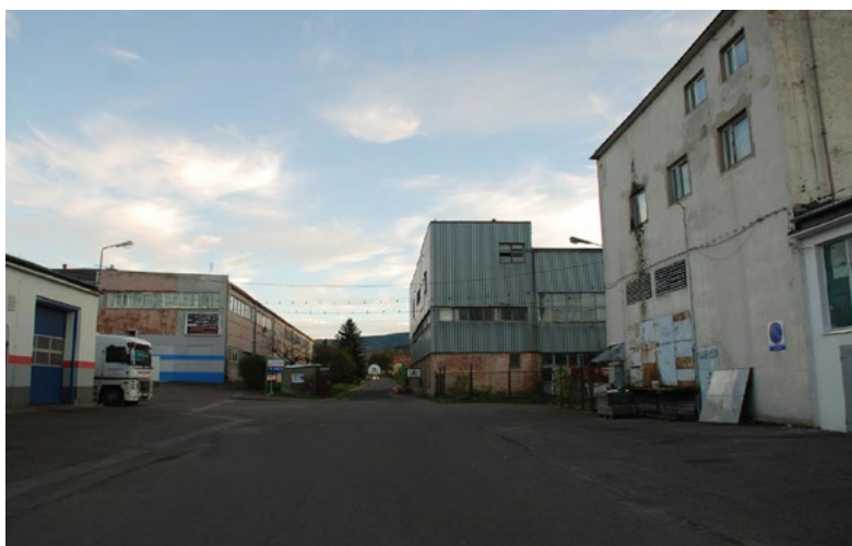
Ryc. 2. Droga dojazdowa do parkingu Parku Miniatur Zabytków Dolnego Śląska wiodąca przez tereny dawnej fabryki dywanów

The entrance road to the parking of the Lower Silesia Monuments miniature Park leading through the former carpet factory