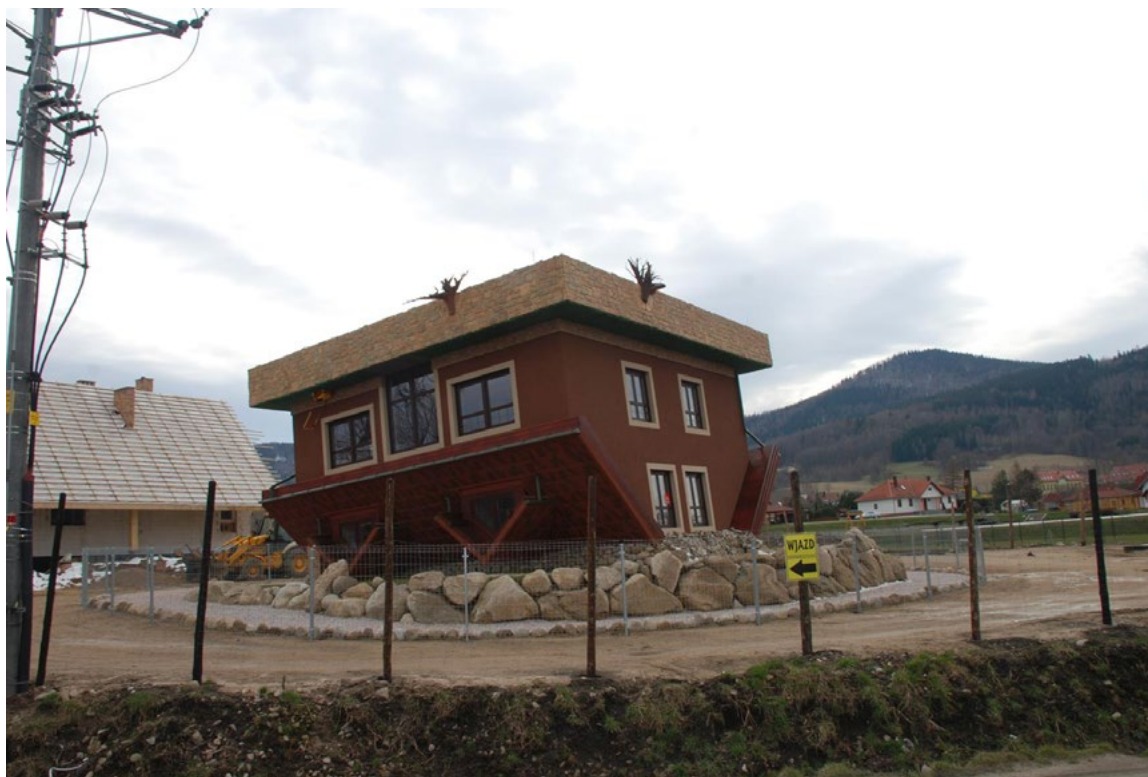
Ryc. 5. Dom na głowie w Miłkowie na końcowym etapie realizacji budowy.

The house on the head in Milkow AT the final stage of construction.