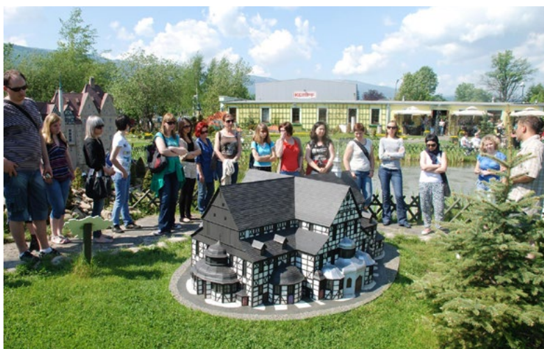
Ryc. 3. Grupa turystów zwiedzająca Park Miniatur Zabytków Dolnego Śląska. W tle pawilon z ekspozycją zadaszoną i kawiarnią a za nim obiekty zakładu budowy pojazdów samochodowych Kempf

The entrance road to the parking of the Lower Silesia Monuments miniature Park leading through the former carpet factory