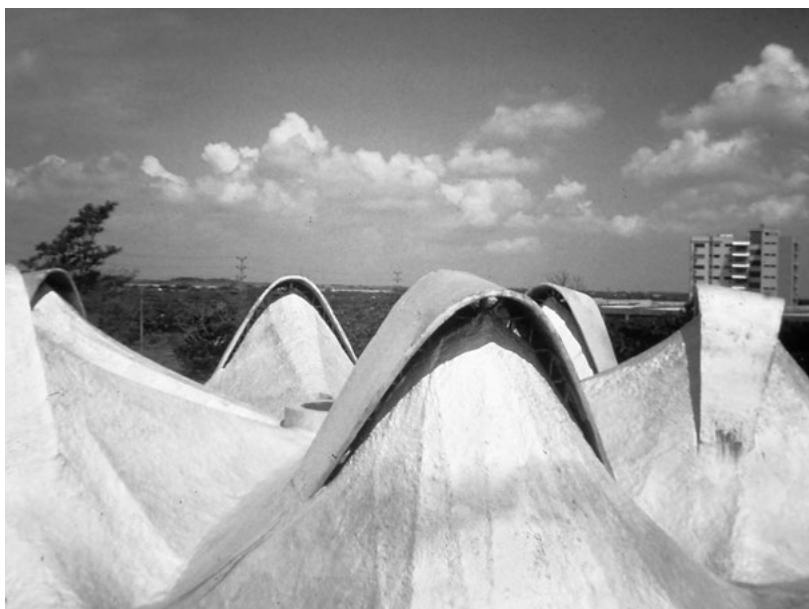
Ryc. 1. Widok zewnętrzny powłoki

Słowa kluczowe: forma konstrukcji, powłoka żelbetowa