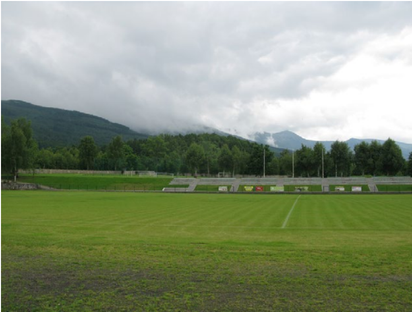
Ryc. 6. Kowary zespół sportplatzu łączący cechy założenia górskiego (panorama okolic) z typowym założeniem o liniowej kompozycji. Zieleni obecna pochodzi z powojennych nasadzeń, rzadko uzupełniana po 1945 roku, w układach swobodnej zieleni obrzeżnej. Widoczny jest brak czytelnej wizji projektowej obecnej w poprzednim układzie. Stan w czerwcu 2015 r.