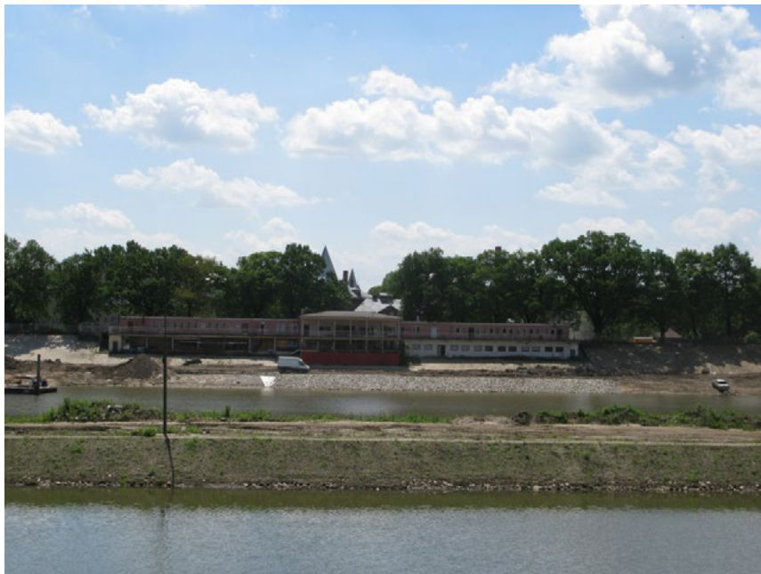
Ryc. 3. Dawne kąpielisko Nordbad we Wrocławiu, zlikwidowane w wyniku zanieczyszczenia wód rzecznych. Zachowana została, choć znacznie przekształcona, architektura zespołu oraz zielen szpalerowa wzdłuż drogi, stanowiąca tło dla dawnego zespołu kąpieliska. Całkowicie zniszczona została zielen niska i kompozycja na terenie zalewowym. Obecnie teren pozbawiony zieleni. (stan w maju 2015 r. ) Autor S. Wróblewski.