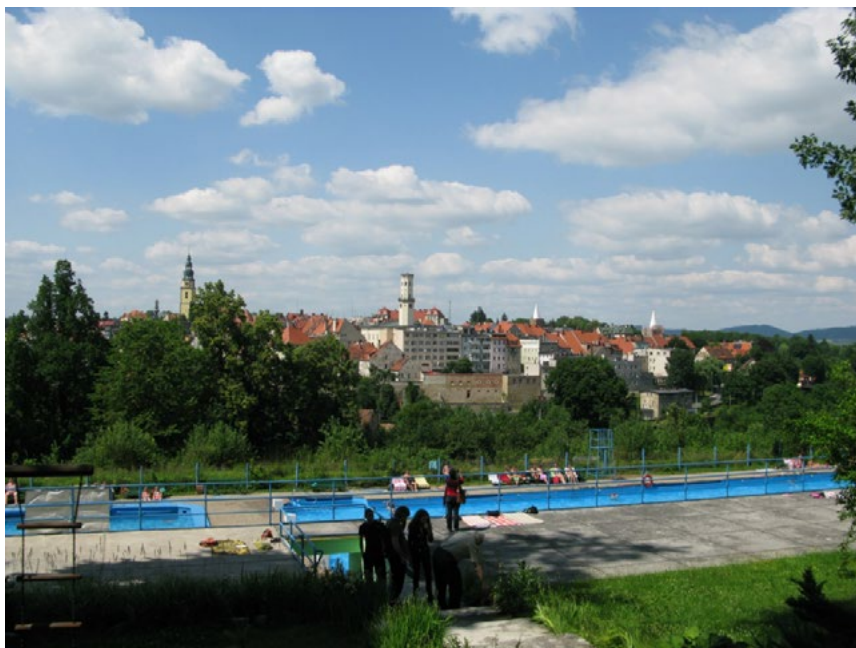
Ryc. 8. Wciąż działające, jedno z niewielu zachowanych kąpielisk górskich w Bystrzycy Kłodzkiej. Swobodnie rosnąca zieleni przy braku kontroli zagraża podstawowemu walorowi kąpieliska, jakim był widok na spektakularną panoramę miasta. W obrębie zespołu przypadkowe układy zieleni z nasadzeń po 1945 r. również zaburzają pierwotną kompozycję projektową kompleksu. Stan w lipcu 2013 r. Autor.S.Wróblewski.