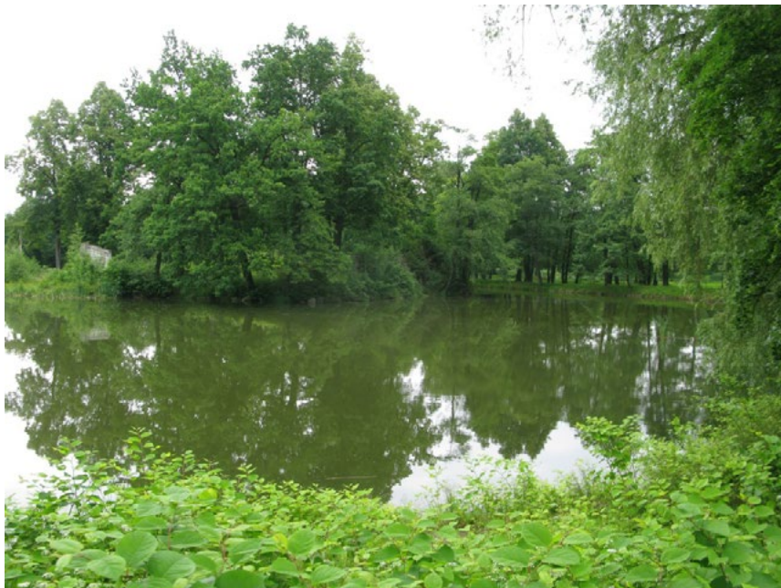
Ryc. 7. Kowary – układ dawnego kąpieliska miejskiego o charakterze parkowym, łączącego cechy inselbaidu i kąpieliska górskiego bergbaidu, zamkniętego po zanieczyszczeniu wód naturalnego zbiornika. Zieleni zaniedbana, w dużej mierze z przypadkowych nasadzeń po 1945 roku tworzy rodzaj opuszczonego parku. Stan w czerwcu 2015 r. Autor S. Wróblewski.