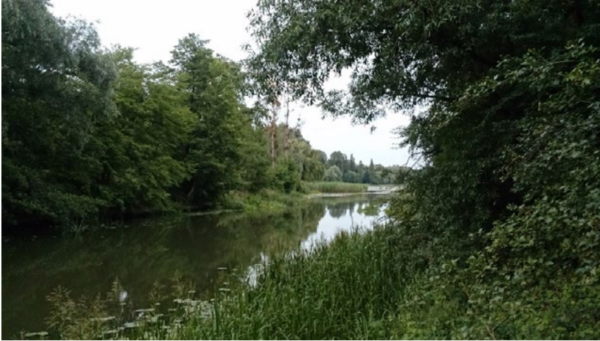
Ryc. 5. Tereny dawnego kąpieliska Ohle Strandbad we Wrocławiu. Paradoksalnie teren dawnego kąpieliska porzuconego w wyniku zanieczyszczenia wód powierzchniowych i rozebranego ma bogatszą szatę roślinną niż w okresie do 1945 roku. Nieuporządkowane formy zieleni przestaniają zdegradowaną przestrzeń miejską. Stan w maju 2015 roku.