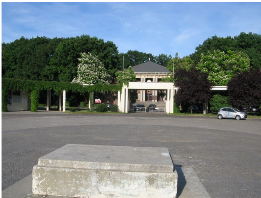
Ryc. 4. Dzisiejszy wygląd placu honorowego we Wrocławskim Parku Sportowym Zalesie. Zielen parkowa sukcesywnie uzupełniana po 1945 roku, w formie zieleni parkowej, z widocznymi zaniedbaniami. Część szpalerów prowadzących do placu została zniekształcona, podobnie jak i formy zieleni towarzyszącej. Zespół ma zostać poddany pracom rewitalizacyjnym. Stan w czerwcu 2015 r. Autor S. Wróblewski.