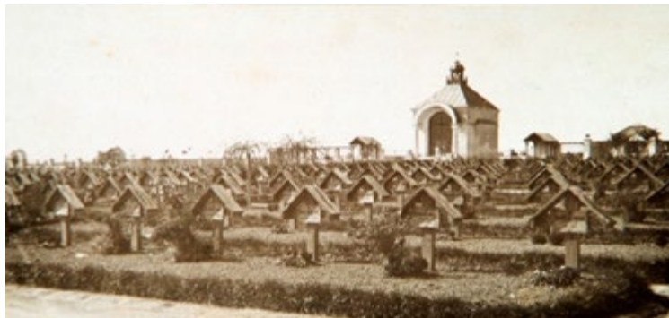
Ryc. 3. Fotografia aut. F. Lala z albumu „Valka 1914–1918” Fig. 3. Phot. auth.. F. Lala from the album “Valka 1914–1918” gained by Lubelskie Museum