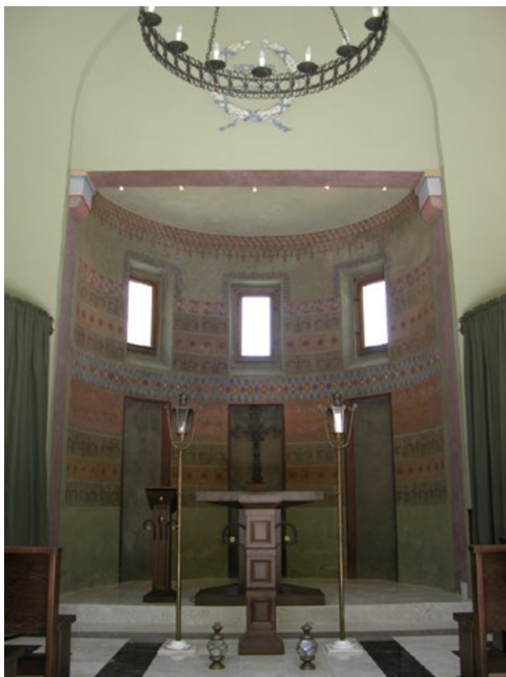
Ryc. 4. Dekoracja wnętrza kaplicy po pracach konserwatorskich Fig. 4. Decoration of interior walls in cemetery chapel – after conservation