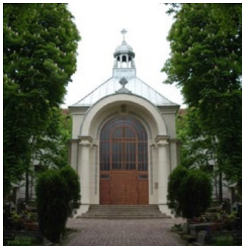
Ryc. 2. Kaplica cmentarna po pracach remontowych przeprowadzonych w roku 2007 Fig 2. The cemetery chapel after restoration works in 2007