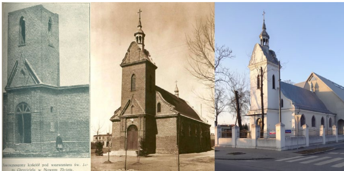
Ryc. 5. 6. 7. Kościół pw. św. Jana Chrzciciela na Nowym Żółtowie: budowa 1930, w stanie surowym 1931, obecnie 2020