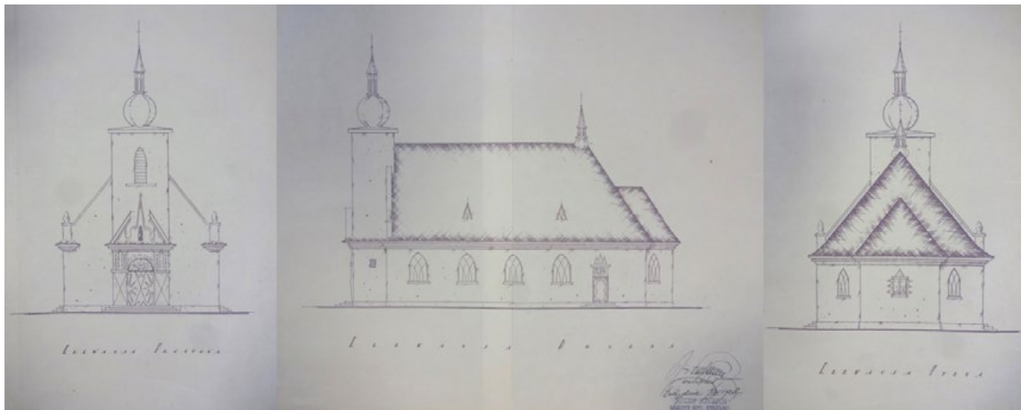
Ryc. 4. Projekt kościoła pw. Jana Chrzciciela na Nowym Złotnie, arch. J. Kaban 1926

art déco. Nawiązywały doń także portal boczny i oprawa pasyjnej sceny umieszczonej na zewnętrznej ścianie prezbiterium (Ryc. 4).