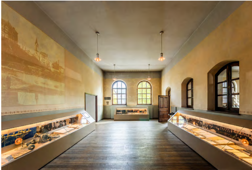
Ryc. 3. Ekspozycja we wnętrzach synagogi Chewra Lomdej Misznajot.

Nieco inny charakter mają dalsze sale. Wąskie pomieszczenie ilustrujące tematykę działu „Zagłada” bazuje na płynnie zagiętej ścianie z wąskim wycięciem na wysokości wzroku, podkreślając efekt wielofunkcyjnej wstęgi przecinającej kameralne, jasne wnętrze. Analogiczną zasadę wykorzystano też w sali „Pamięć”, gdzie dziewięć interaktywnych monitorów z symultaniczną instalacją multimedialną otacza widza obrazem, światłem i dźwiękiem 11 . Nawet szatnia przy wyjściu na zewnętrzny taras podąża za podobnym schematem – rząd ruchomych wieszaków przecina na jednym poziomie trzy ściany niewielkiej wnęki.