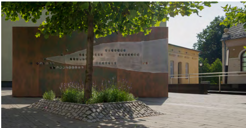
Ryc. 1. Element ekspozycyjny na placu przed wejściem do Centrum Żydowskiego w Oświęcimiu.

dawny dom Kornreichów i Dattnerów 3 , synagoga Chewra Lomdej Misznajot 4 i dom rodziny Klugerów 5 ) został zintegrowany za pomocą zróżnicowanych środków architektonicznych i spójnego systemu identyfikacji wizualnej. Na zewnątrz część ścian Centrum obsadzono różnymi gatunkami bluszczu, a przed głównym wejściem zaplanowano podłużną ławkę o zmiennej wysokości (dla osób o różnym wieku i wzroście). Historyczne wnętrza zostały „wyczyszczone” ze zbędnych elementów i odrestaurowane, a wystawę pt. „Oszpicin. Historia żydowskiego Oświęcimia” 6 podzielono tematycznie na kilka działów eksponowanych w poszczególnych pomieszczeniach – „Początki (do roku 1772)”, „Galicja (1772–1918)”, „Między Wojnami (1918–1939)”, „Zagłada (1939–1945)”, „Polska Ludowa (1945–1989)” i „Pamięć”. W założeniach autorów ekspozycji, miała być ona uzupełnieniem i swoistą przeciwważą dla pobliskiego Miejsca Pamięci i Muzeum Auschwitz-Birkenau 7 , prezentując głównie pozytywną tożsamość i codzienne życie miasta, w którym splatały się losy wielu ludzi, religii i kultur 8 . W ramach nowego projektu architektonicznego wszelkie ingerencje w zabytkową tkanę powstały w szacunku dla delikatnej i trudnej historii oraz wyjątkowego charakteru miejsca.