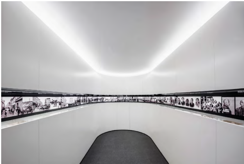
Ryc. 4. Sala ekspozycyjna „Zagłada (1939–1945)”.

Nieco inny charakter mają dalsze sale. Wąskie pomieszczenie ilustrujące tematykę działu „Zagłada” bazuje na płynnie zagiętej ścianie z wąskim wycięciem na wysokości wzroku, podkreślając efekt wielofunkcyjnej wstęgi przecinającej kameralne, jasne wnętrze. Analogiczną zasadę wykorzystano też w sali „Pamięć”, gdzie dziewięć interaktywnych monitorów z symultaniczną instalacją multimedialną otacza widza obrazem, światłem i dźwiękiem 11 . Nawet szatnia przy wyjściu na zewnętrzny taras podąża za podobnym schematem – rząd ruchomych wieszaków przecina na jednym poziomie trzy ściany niewielkiej wnęki.