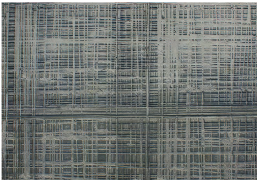
Ryc. 7. Detal płyty z szarego piaskowca, zastosowanej w posadzce Parku Pamięci.

te służyły jako podstawy do cięcia mniejszych formatów i nikt wcześniej nie wpadł na pomysł zastosowania ich w budownictwie. Są one odpadem przemysłowym, ponownie wykorzystanym i „przywróconym do życia”, niejako w geście sprzeciwu wobec nadmiernej eksploatacji bogactw naturalnych.