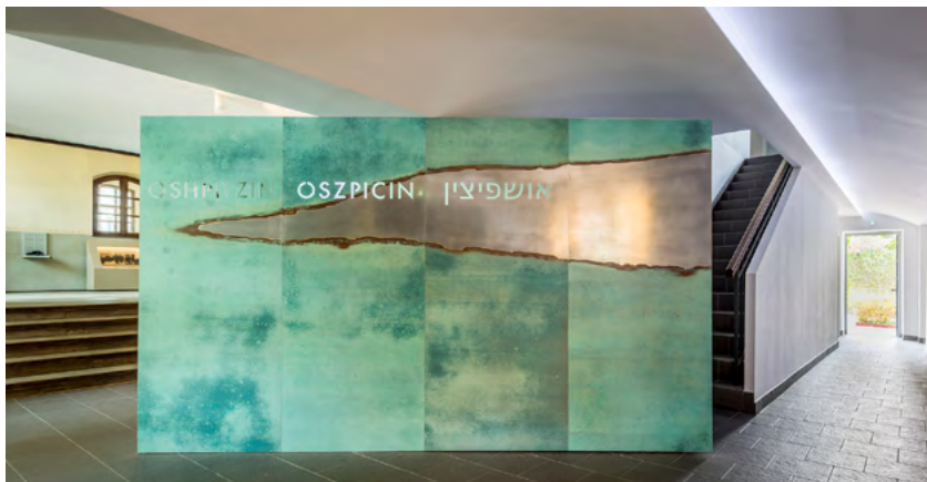
Ryc. 2. Strefa wejściowa Centrum Żydowskiego w Oświęcimiu.

Szpiczaste kształty rzutów opisywanych elementów symbolizują zdeformowane i zdekonstruowane ramiona Gwiazdy Dawida, a kierunki wskazywane przez poszczególne formy ilustrują konkretne miejsca emigracji narodu żydowskiego. Te graniastopy trójkątne z różnych rodzajów blachy sugerują kierunek zwiedzania, akcentują też początek i koniec ekspozycji.