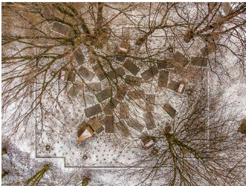
Ryc. 5. Widok z góry Parku Pamięci Wielkiej Synagogi w Oświęcimiu.

Centrum Żydowskie w Oświęcimiu zajmuje się nie tylko działalnością ekspozycyjną, edukacyjną i kulturalną w obrębie opisywanych wcześniej budynków. Instytucja opiekuje się również dwoma ważnymi historycznie miejscami w centrum miasta. Pierwsze z nich, to cmentarz żydowski 14 , drugie, to teren po nieistniejącej już bożnicy w pobliżu bulwarów rzeki Soły. To właśnie w tej malowniczej lokalizacji 28 listopada 2019 roku, 80 lat po zburzeniu świątyni przez hitlerowców, otwarto Park Pamięci Wielkiej Synagogi (2018–2019). Głównym elementem architektonicznym tej przestrzeni stał się odpad przemysłowy – płyty z szarego piaskowca z niezliczoną ilością nieregularnych nacięć. Ten unikatowy materiał symbolizuje ruiny nieistniejącej już Wielkiej Synagogi i ścieżki życia wielokulturowej społeczności, krzyżujące się niegdyś w tym miejscu.