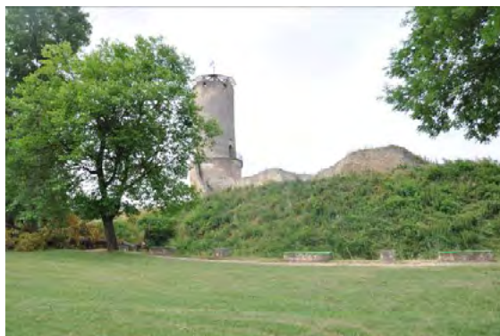
Ryc. 11. Widok z dziedzińca zamku dolnego na zamek górny