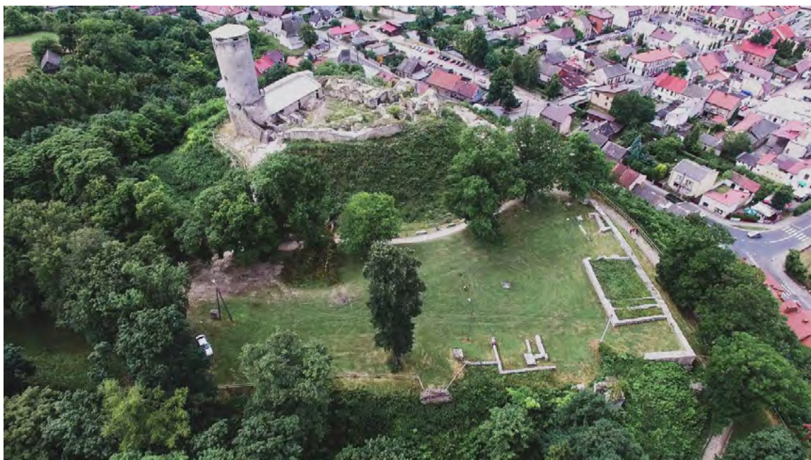
Ryc. 3. Widok na zamek górny i relikty zamku dolnego w Łży, 2018

W drugiej fazie przebudowy wzmocniona została brama wjazdowa na teren zamku górnego. Poza obrębem murów powstała czworoboczna wieża bramna z przyporami w narożach (Ryc. 2, nr 6). Wieża bramna była drugim co do wysokości elementem zespołu. Do zamku prowadził most kamienny oparty na filarach (Ryc. 2, nr 9), który składał się z kilku odcinków, w tym dwóch części zwodzonych, a ostatnie przęsło mostu było podnoszone. Na drodze dojazdowej mostu usytuowano wieżę przedbramną (Ryc. 2, nr 8). 14