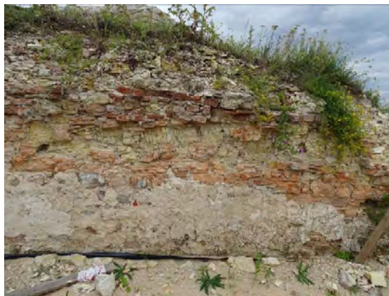
Ryc. 5. Mur wewnętrzny w zachodniej części zamku – degradacja korony murów spowodowana rozrostem roślinności. Korozja mrozowa oraz solna występująca w środkowej części muru