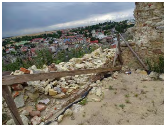
Ryc. 7. Zachodnia część zamku – całkowicie zniszczony fragment muru zewnętrznego. Miejsce niezabezpieczone po prowadzonych i nieukończonych pracach remontowych