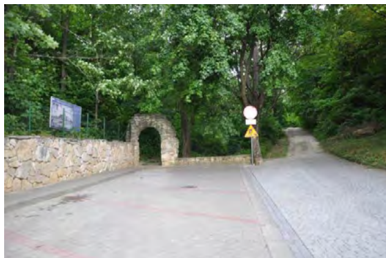
Ryc. 9. Wejście na wzgórze zamkowe od ul. świętego Franciszka