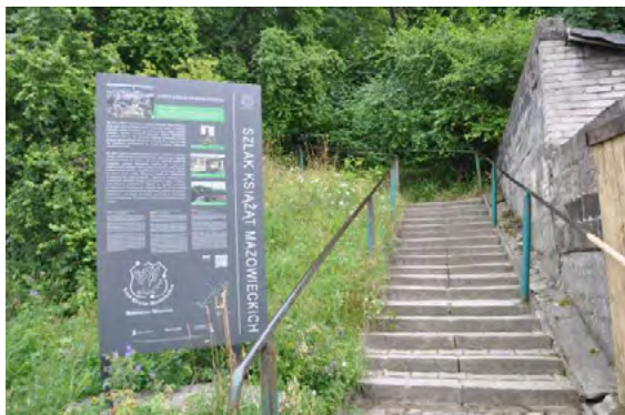
Ryc. 8. Wejście na wzgórze zamkowe od ul. Podzamcze