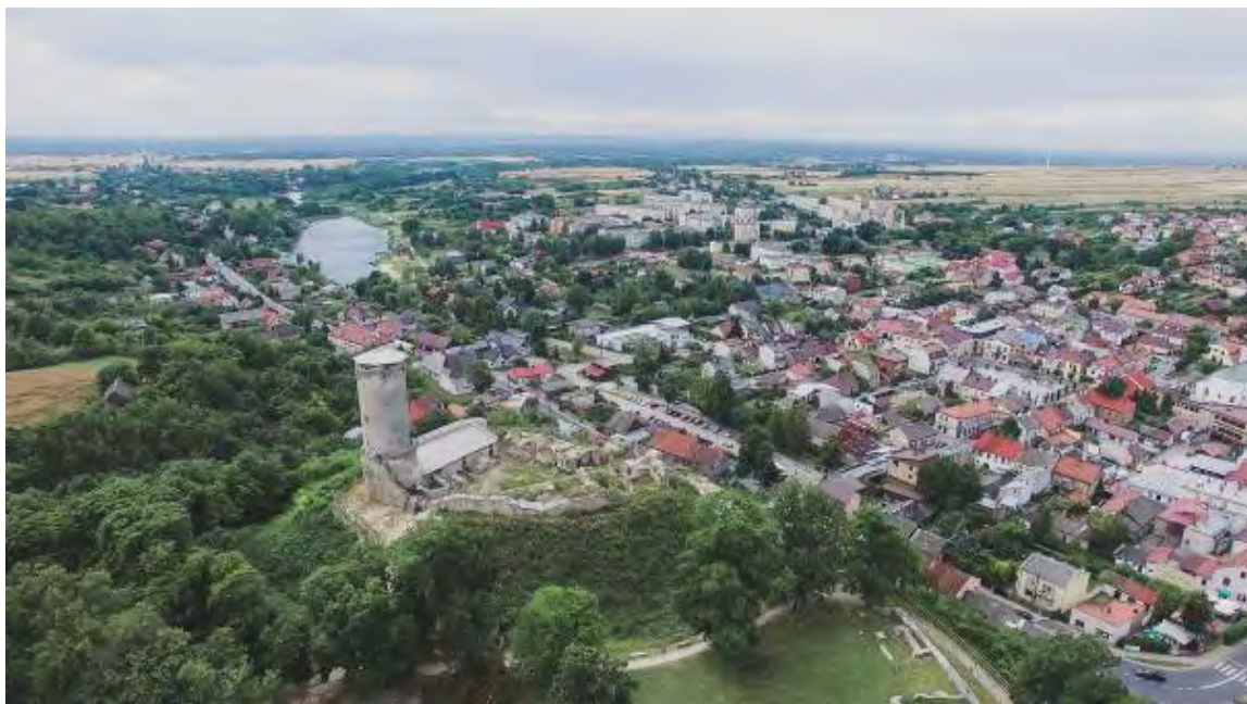
Ryc. 1. Widok na ruiny zamku oraz miasto Iłża, 2018

Obecnie pozostałości budowli obronnej są największą atrakcją miasta. 5 Miejsce to posiada funkcję turystyczną, kulturalną i rekreacyjną. Dodatkowo, ze względu na swoje położenie, stanowi charakterystyczną dominantę w sylwecie miasta. Ruiny górują nad zabytkowym układem urbanistycznym Iłży (Ryc. 2), są widoczne z odległości wielu kilometrów z dróg wjazdowych i przejazdowych przez miasto. Główne otwarcia widokowe z terenu zamku uchwycono w opracowaniu studialnym z 1997 roku. 6