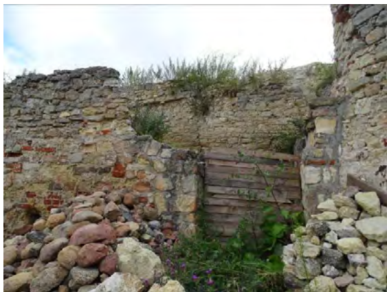
Ryc. 4. Mur w północno-wschodniej części zamku górnego – widoczne liczne uszkodzenia muru oraz znaczna degradacja lica muru

Obecnie, pomimo prowadzonych wcześniej prac konserwatorskich i zabezpieczających mury zamku górnego są w stanie technicznym niedostatecznym. Brak zabezpieczeń koron murów wykonanych z niskiej jakości materiału powoduje stałe niszczenie obiektu. W miejscach niezabezpieczonych występują różnego typu uszkodzenia konstrukcyjne i powierzchniowe. W murach występują między innymi liczne rysy, spękania, uszkodzenia lica, ubytki w spoinowaniu oraz intensywne degradacja spowodowana krystalizacją solną. W spoinach zalegają warstwy humusowe powodujące intensywny rozrost roślinności. W miejscach wykonanych wcześniej zabezpieczeń koron doszło do ich degradacji pod wpływem czynników atmosferycznych. Wykonane zabezpieczenia miały charakter czasowy i w związku z brakiem bieżących interwencji doszło do ich zużycia. 22