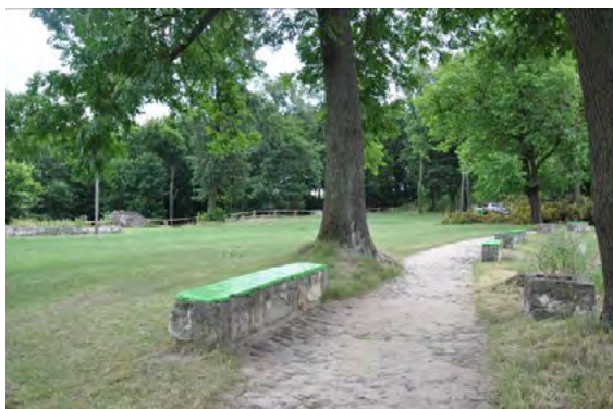
Ryc. 10. Brukowa ścieżka i elementy małej architektury na terenie wzgórza zamkowego

Dla odwiedzających dostępny jest także sporej wielkości teren wzgórza zamkowego. Zamek górny jest w niewielkim stopniu przystosowany do ruchu turystycznego. Udostępniona jest wieża główna, na szczycie której znajduje się punkt widokowy. Dostęp do niej prowadzi początkowo przez zewnętrzne schody żelbetowe, natomiast w jej wnętrzu wykonano schody wachlarzowe wspornikowe o konstrukcji stalowej. Z tarasu widokowego wieży zamkowej oglądać można rozległe panoramy miasta oraz okolic, a widoczność sięga wielu kilometrów. W pomieszczeniach skrzydła południowego znajduje się niewielka ekspozycja związana z historią zamku.