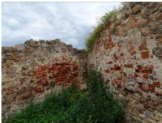
Ryc. 6. Południowo-wschodnia część zamku – intensywna korozja solna i mrozowa we fragmentach muru z cegły ceramicznej