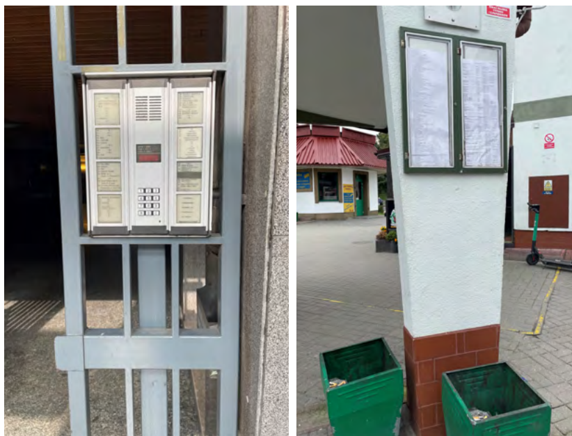
Ryc. 11. (z lewej) Zbyt wiele informacji na panelu informacyjnym, zróżnicowana czcionka – bariera wizualna dla osób słabowidzących, niedowidzących i niewidomych, fot. Katarzyna Szmygin, Mediolan 2021; (z prawej) Zbyt wiele informacji na panelu informacyjnym, zbyt mała czcionka, elementy uniemożliwiające podejście/podjazd do tablicy informacyjnej, tablice informacyjna umieszczona zbyt wysoko – bariera wizualna dla osób słabowidzących, niedowidzących i niewidomych, a także dla osób poruszających się na wózku inwalidzkim fot. Katarzyna Szmygin, Lublin 2020

Barierą, z której niejednokrotnie projektanci i użytkownicy przestrzeni nie zdają sobie sprawy jest kolorystyka. Podobnie jak w przypadku architektury, kolor w założeniu urbanistycznym powinien mieć ścisły związek z otoczeniem, kontekstem oraz przeznaczeniem. Specyfika przestrzeni publicznej będącej łącznikiem obiektów, które je otaczają wymusza wykorzystanie kolorystyki tworzącej całościowo kompozycję przestrzenną. Ze względu na nieskończenie dużą ilość elementów zmiennych w przestrzeniach publicznych (ludzie, reklamy, znaki drogowe, informacyjne, środki komunikacji miejskiej lub prywatnej, tymczasowe elementy wyposażenia przestrzeni, itd.) na etapie projektowania przestrzeni koniecznym jest poprawne skomponowanie elementów stałych, do których zalicza się posadzki (ulice, place, trawniki, rabaty...), ściany (elewacje budynków, ogrodzenia, szpalery drzew...) sufit (nieboskłon, zadaszenia, gzymsy, korony drzew...), a także elementy wolno stojące, jak na przykład mała architektura. Kolor w przestrzeni miejskiej ma za zadanie jej uporządkowanie, artykulację elementów istotnych dla tej przestrzeni, łączenie lub dzielenie elementów przestrzeni, jak również przeciwdziałanie monotonii otoczenia. Istnieje wiele przestrzeni publicznych, w których zły dobór kolorystyki (np. agresywne zestawienie barw), zbyt duża ilość faktur, czy nieintuicyjną artykulację elementów informacyjnych stanowią barierę w poprawnym odbiorze przestrzeni.