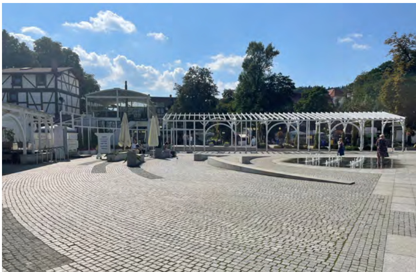
Ryc. 4. Źle zaprojektowane miejsca wypoczynku – brak zadaszenia nad siedziskami wymusza konieczność zacieniania ich elementami niestałymi, o niskich walorach estetycznych. Brak zadaszenia sprawia, iż w ciepłe dni siedziska nie nadają się do użytku., Polanica Zdrój 2021