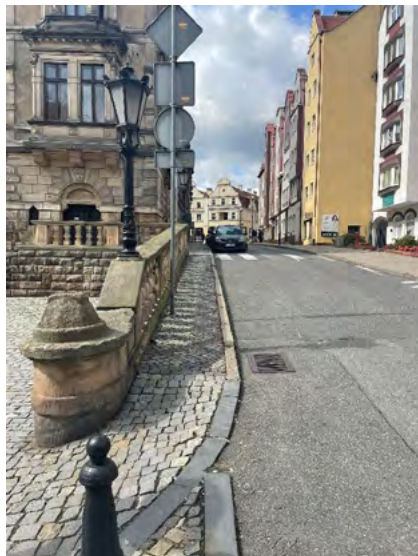
Ryc. 10. Zbyt wąskie trakty piesze, trakty, których szerokość ograniczona jest zaparkowanymi samochodami, fot. Katarzyna Szmygin, Kłodzko 2021