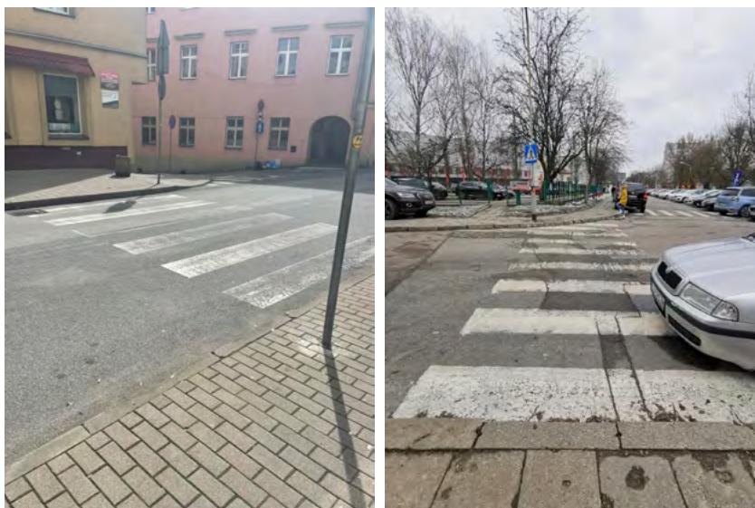
Ryc. 2. Zbyt wysokie krawężniki przy przejściach dla pieszych, fot. Katarzyna Szmygin, Kłodzko 2021 (z lewej), Lublin 2019 (z prawej)