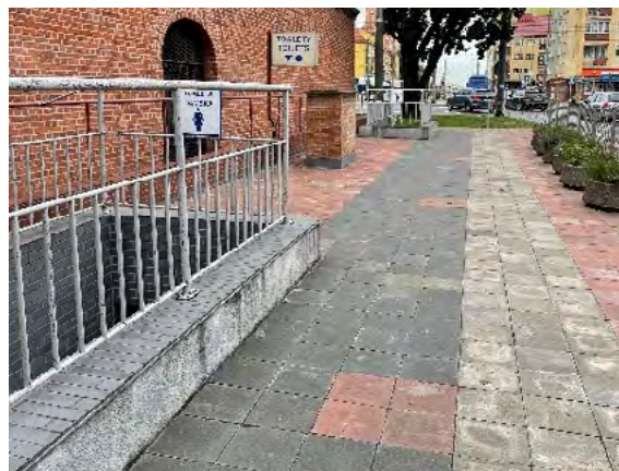
Ryc. 5. Toalety w przestrzeni publicznej nieprzystosowane do korzystania z nich przez osoby niepełnosprawne, Kłodzko 2021 (z lewej), Szczecin 2021 (z prawej)