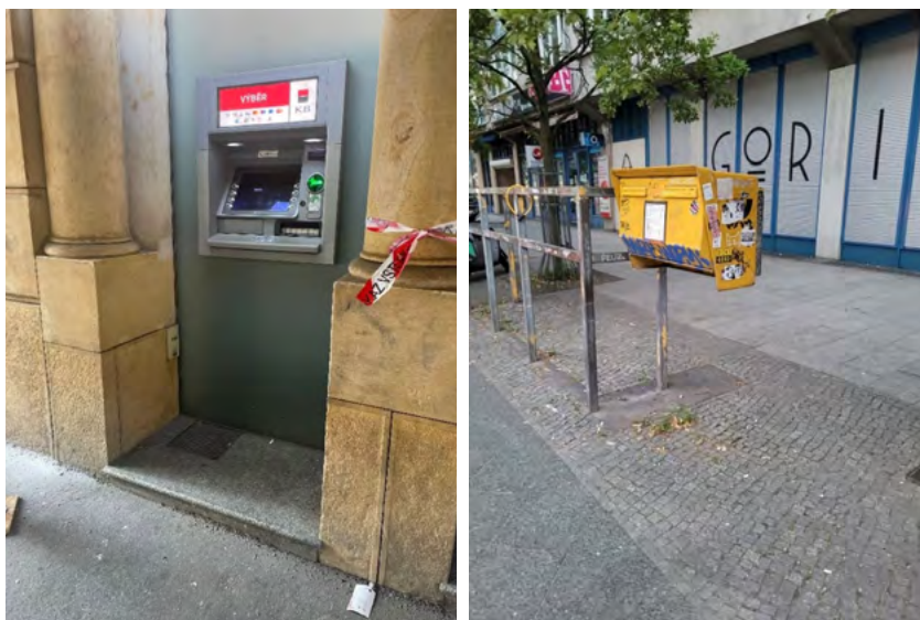
Ryc. 6. Nieprzystosowane urządzenia do korzystania przez osoby niepełnosprawne: (z lewej) bankomat, z którego nie mogą korzystać osoby poruszające się na wózku inwalidzkim, fot. Katarzyna Szmygin, Praga 2021; (z prawej) skrzynka pocztowa zlokalizowana na wysokości uniemożliwiającej korzystanie z niej osobom poruszającym się na wózku inwalidzkim, fot. Katarzyna Szmygin, Berlin 2021