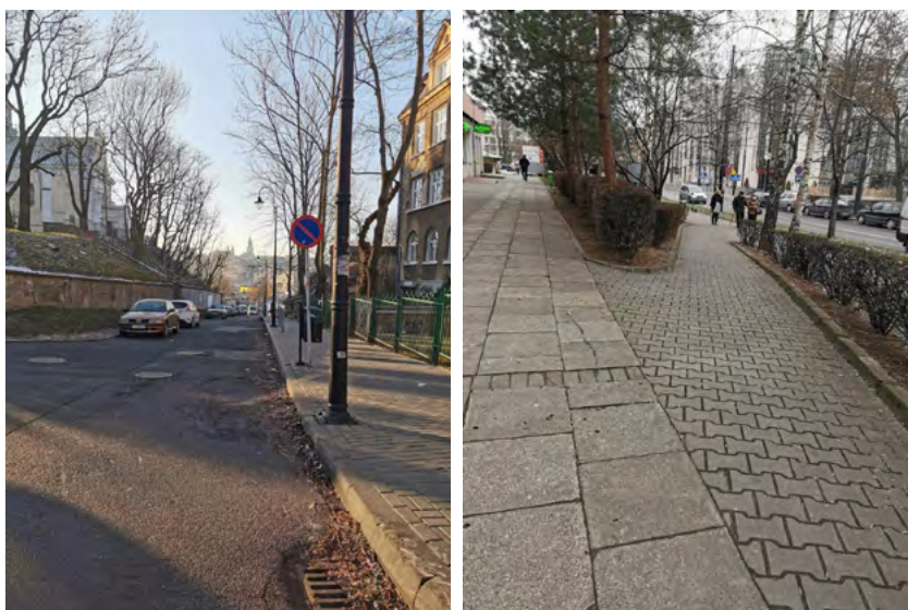
Ryc. 7. Zbyt długie płaszczyzny ruchu, utrudnienie dla osób starszych, osób poruszających się na wózkach inwalidzkich, osób z wózkami, itp., fot. Katarzyna Szmygin, Lublin 2020