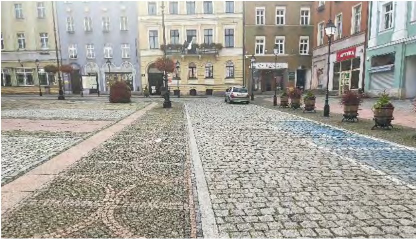
Ryc. 8. Nieodpowiednie wyróżnienie posadzki na granicy strefy pieszej i samochodowej, będącej utrudnieniem dla osób niewidomych i słabowidzących, fot. Katarzyna Szmygin, Wałbrzych 2021