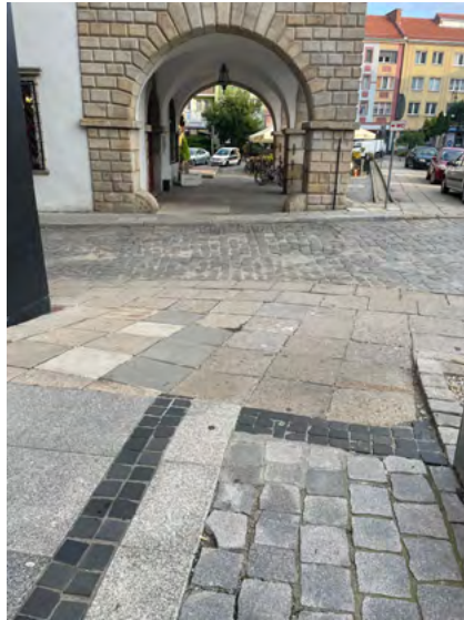
Ryc. 9. Niejednoznaczne oznakowanie przestrzeni: (z lewej) Chodnik zakończony ścieżką rowerową bez przejścia dla pieszych – bariera dla wszystkich użytkowników przestrzeni, fot. Katarzyna Szmygin, Kłodzko 2021; (z prawej) Na chodniku wykorzystano zróżnicowane wykończenie w miejscach, które nie stanowią zmiany charakteru przestrzeni. Przy przejściu przez ulicę brak wyróżniającej się nawierzchni – bariera dla osób niewidomych i słabowidzących, fot. Katarzyna Szmygin, Nysa 2021