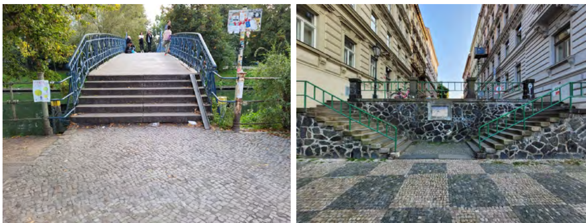
Ryc. 1. Brak pochylni na trakcie pieszym, fot. Katarzyna Szmygin, Berlin 2021 (z lewej), Praga 2019 (z prawej)