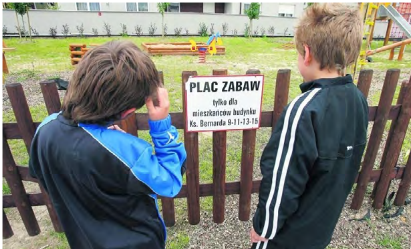
Ryc. 12. Tablica informująca o możliwości korzystania z placu zabaw wyłącznie przez wybranych mieszkańców, źródło: https://gazetawroclawska.pl/swidnica-place-zabaw-tylko-dla-mieszkancow/ga/c3-264329/zd/515431 dostęp: 06.03.2021