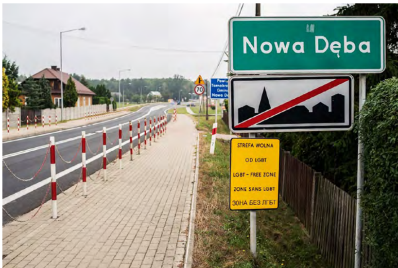
Ryc. 13. Tablica, którą aktywiści oznakowali miejscowość, której władze uchwałyły ustawę przeciwko ideologii ruchów LGBT – ograniczenie wolności w przestrzeni miasta

Zagrożeniem dla dostępności przestrzeni publicznych może być także „zawłaszczanie” fragmentów bądź całych przestrzeni przez różne grupy społeczne, czego skutkiem jest segregacja i wykluczenie społeczne z takich przestrzeni. Należy pamiętać o tym, iż charakter przestrzeni określany jest przez osoby, które z niej korzystają i czynności, jakie wykonują. Oczywiście sposób, w jaki dana przestrzeń jest zaprojektowana może sprzyjać i wpływać na aktywności i profil użytkownika, ale nie jest to warunek konieczny.