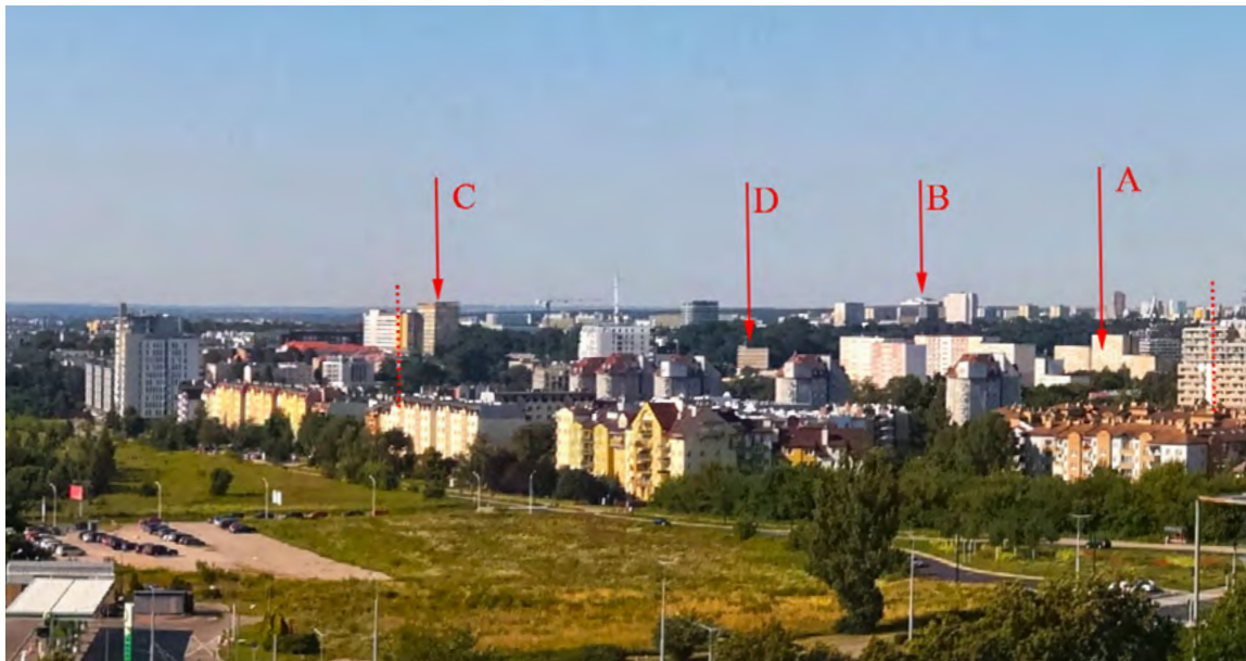
Ryc. 6. Panorama północna Wieniawy, C – Urząd Miasta Lublin, ul. Wieniawska 14, D – Urząd Miasta Lublin, ul. St. Leszczyńskiego 20–22, B – budynki KUL-u, A – lokalizacja dawnego rynku Wieniawy; fot. autor, 06.2019

Obszary dawnego rynku (Ryc. 6. A) są skryte za wysokimi budynkami mieszkaniowymi. Linia pierzei zabudowy przy ulicy St. Leszczyńskiego jest niemal całkowicie niezauważalna, wyróżniają się wyłącznie dwa budynki administracyjne – dominanta wysokościowa Urzędu Miasta Lublin przy ulicy Wieniawskiej 14 (Ryc. 6. C) oraz Urząd Miasta Lublin przy ulicy Leszczyńskiego 20–22 (Ryc. 6. D).