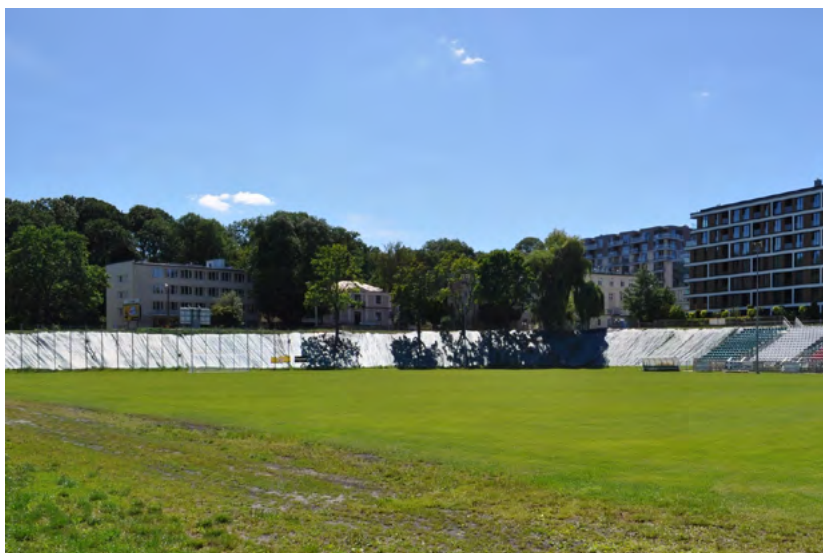
Ryc. 2. Zachodnia część ulicy Stanisława Leszczyńskiego, Lublin; od lewej: budynek GUS, dawny magistrat gminy Konopnica, zabudowa mieszkaniowa (za drzewami), budynek UP, budynek mieszkaniowo-usługowy, budynek mieszkaniowy (fot. autor 08.2022)

Western part of Stanisława Leszczyńskiego Street, Lublin; from the left: the building of the Central Statistical Office, the former magistrate of the Konopnica commune, residential buildings (behind the trees), the building of the University of Life Sciences, a residential and commercial building, a residential building (photo: author 08.2022)