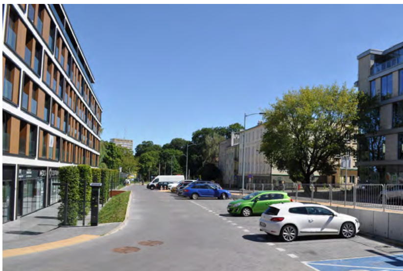
Ryc. 3. Zachodnia część ulicy Stanisława Leszczyńskiego, Lublin (fot. autor 08.2022)

Na obszarze opracowania występują obiekty powstałych w różnych okresach przede wszystkim XX wieku. Rejon ten cechuje się znaczącą różnorodnością stylistyczną. Najczęściej występującym stylem jest modernizm, zarówno z okresu dwudziestolecia międzywojennego, jak i okresu PRL. Tym samym oryginalny, małomiasteczkowy charakter Wieniawy uległ całkowitej zmianie. Niskie drewniane obiekty, uzupełnione pojedynczymi murowanymi obiektami użyteczności publicznej zastąpione zostały zabudowaniami o charakterze śródmiejskim – dużej powierzchni zabudowy, wysokim wskaźniku intensywności zabudowy i niewielkiej powierzchni biologicznie czynnej.