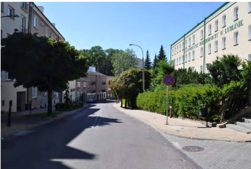
Ryc. 5. Wschodnia część ulicy Stanisława Leszczyńskiego, fot. autor, 08.2022

Analysis of the urban composition of Wieniawa, Lublin: (authors: W. Jabłoński, A. Bylicka, 08.2022)